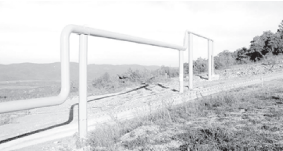
рен и принят сразу в трёх чтениях.