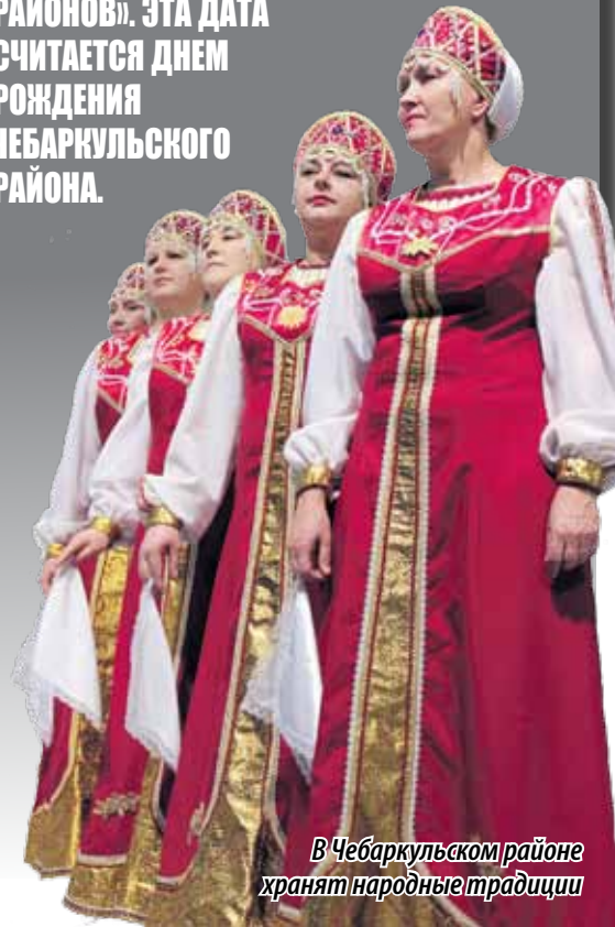
В Чебаркульском районе хранят народные традиции

В 1923 ГОДУ, С УПРАЗДНЕНИЕМ ВОЛОСТЕЙ И ОБРАЗОВАНИЕМ РАЙОНОВ, ЧЕБАРКУЛЬСКИЙ СЕЛЬСКИЙ СОВЕТ ВОШЕЛ В СОСТАВ МИАССКОГО РАЙОНА. ПОСЛЕ ЕЩЕ ДВУХ КРУПНЫХ АДМИНИСТРАТИВНЫХ ПЕРЕДЕЛОВ 18 ЯНВАРЯ 1935 ГОДА ВЫШЛО РЕШЕНИЕ ВЦИК РСФСР «О РЕОРГАНИЗАЦИИ РАЙОНОВ». ЭТА ДАТА СЧИТАЕТСЯ ДНЕМ РОЖДЕНИЯ ЧЕБАРКУЛЬСКОГО РАЙОНА.