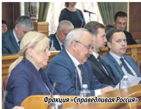
Фракция «Справедливая Россия»