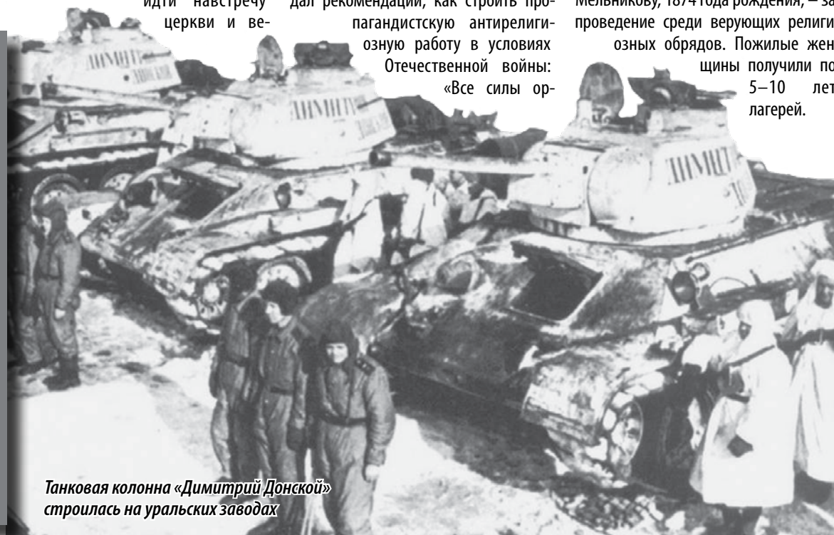
Танковая колонна «Димитрий Донской» строилась на уральских заводах

НА ПОСТРОЙКУ ТАНКОВОЙ КОЛОННЫ ИМЕНИ ДМИТРИЯ ДОНСКОГО ВЕРУЮЩИМИ БЫЛО СОБРАНО СВЫШЕ 8 МИЛЛИОНОВ РУБЛЕЙ. ТАНКИ ПРОИЗВОДИЛИСЬ НА УРАЛЬСКИХ ЗАВОДАХ. ЭСТАФЕТУ ПРИНЯЛИ РАБОЧИЕ ЧЕЛЯБИНСКА. В КОРОТКИЙ СРОК БЫЛО ПОСТРОЕНО 40 ТАНКОВ Т-34. ОНИ И СОСТАВИЛИ КОЛОННУ С НАДПИСЯМИ НА БАШНЯХ БОЕВЫХ МАШИН «ДИМИТРИЙ ДОНСКОЙ».