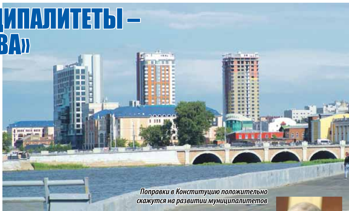
Поправки в Конституцию положительно скажутся на развитии муниципалитетов