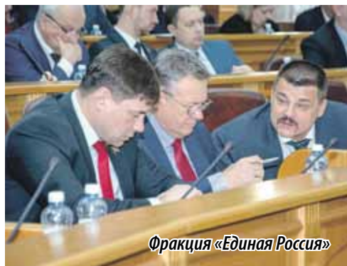
Фракция «Единая Россия»

229,3 МЛН РУБ. – НА ПРОВЕДЕНИЕ СПОРТИВНЫХ МЕРОПРИЯТИЙ МИРОВОГО И ВСЕРОССИЙСКОГО УРОВНЯ (ЭТАП КУБКА МИРА ПО ФРИСТАЙЛУ, СПОРТИВНЫЕ ИГРЫ СТРАН БРИКС, КУБОК МИРА ПО СНОУБОРДУ, ЧЕМПИОНАТ РОССИИ ПО ФИГУРНОМУ КАТАНИЮ).