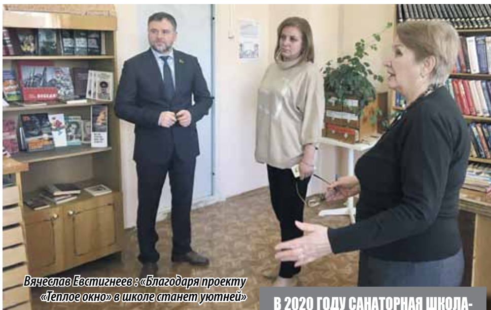
Вячеслав Евстигнеев: «Благодаря проекту «Теплое окно» в школе станет уютней»

ДЕПУТАТ ЗАКОНОДАТЕЛЬНОГО СОБРАНИЯ ВЯЧЕСЛАВ ЕВСТИГНЕЕВ (ФРАКЦИЯ «ЕДИНАЯ РОССИЯ»), ПОБЫВАВ В САНАТОРНОЙ ШКОЛЕ-ИНТЕРНАТЕ № 2 ГОРОДА МАГНИТОГОРСКА, УЗНАЛ О НАСУЩНЫХ ПРОБЛЕМАХ ПЕДАГОГИЧЕСКОГО КОЛЛЕКТИВА.