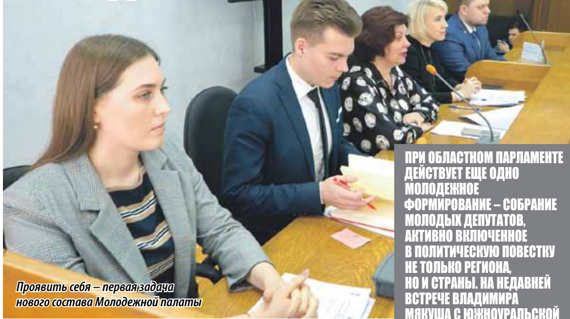
Проявить себя – первая задача нового состава Молодежной палаты