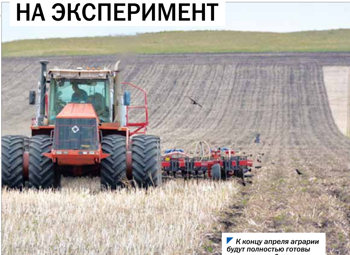
К концу апреля аграрии будут полностью готовы к полевым работам.

Аграрии Челябинской области попробуют вырастить в этом году нетрадиционные для нашего региона культуры — расторопшу, сурепицу и амарант. Под них отведут 4,3 гектара.