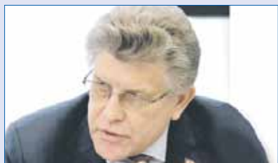
Александр ЖУРАВЛЕВ, председатель комитета Законодательного Собрания по социальной политике (фракция «Единая Россия»):

4 УСТАНОВИТЬ НОРМУ ВЫПЛАТЫ ПО БОЛЬНИЧНОМУ В РАЗМЕРЕ ОДНОГО МРОТ ДО КОНЦА ГОДА.