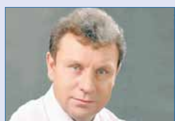
Александр БЕРЕСТОВ, председатель комитета Законодательного Собрания по аграрной политике (фракция «Единая Россия»):

Специалисты отмечают, что одной из основных проблем охраны лесов от пожаров являются так называемые ландшафтные пожары. Мало того, что они распространяются на огромные площади и заходят в лес широким фронтом, так еще и создают угрозу населенным пунктам и объектам экономики. Доля лесных пожаров на территории области по этой причине ежегодно достигала 60-70%, только в 2019 году ее удалось снизить до 40%.