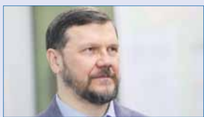
Константин ЗАХАРОВ, заместитель председателя Законодательного Собрания, председатель комитета по экономической политике и предпринимательству (фракция «Единая Россия»):

/// Всем участникам экономических взаимоотношений нужно прислушаться к выступлению президента и оперативно исполнять посылы обращения. Так, налоговые органы объявили, что прекращают блокировку счетов предприятий и предпринимателей при наличии задолженности. Вторая большая тема предпринимателей – банки. Мы ожидаем реакцию Центробанка, который бы дал предписание всем банкам не блокировать или разблокировать счета. Соответственно и предпринимателей призываем написать письма в банки. ///