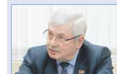
Владимир МЯКУШ, председатель Законодательного Собрания Челябинской области (фракция «Единая Россия»):

Кроме того, совместно с епархией местное отделение «Единой России» организовало питание для сотрудников Росгвардии, ДПС, дежурных специалистов.