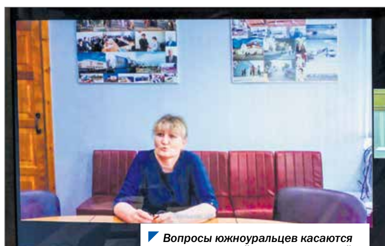
Вопросы южноуральцев касаются целых территорий и многих жителей.

Следующий видеозвонок из села Малое Шумаково Увельского района.