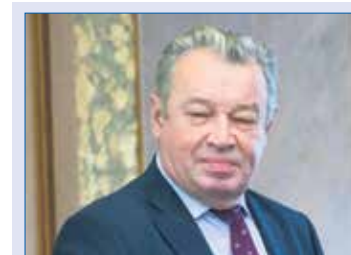
Анатолий БРАГИН, председатель комитета по законодательству, государственному строительству и местному самоуправлению (фракция «Единая Россия»):

вреждений фасадов, ограждающих конструкций, входных групп (узлов), навесных металлических конструкций, оконных проемов, витрин и вывесок, а также разрушения их отделочного слоя; за установку дополнительных входных групп (узлов), навесных металлических конструкций, оконных про-