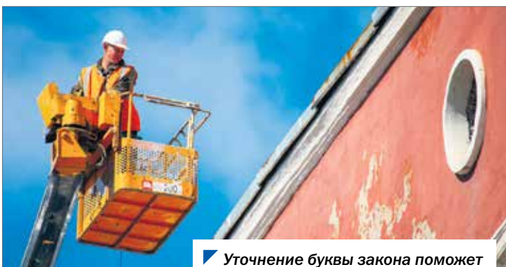
Уточнение буквы закона поможет избежать ошибок благоустройства.

Поправки, принятые южноуральскими депутатами в первом чтении, уточняют состав одного из административных правонарушений в сфере благоустройства территорий муниципалитетов.