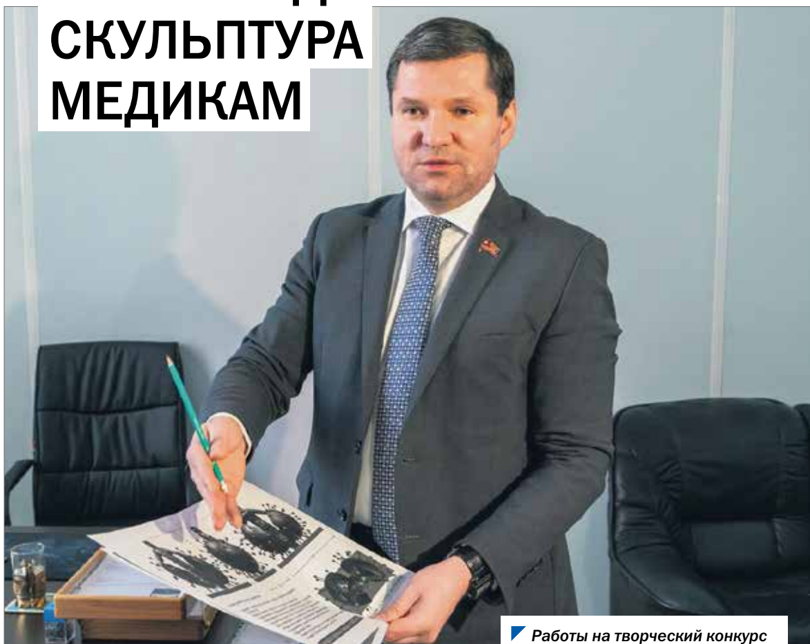
Работы на творческий конкурс принимаются в срок до 15 марта.

В южноуральской столице продолжается сбор заявок на творческий конкурс по разработке эскизного проекта скульптурной композиции медицинским работникам. В первые дни после объявления конкурса поступили эскизные работы из Каслинского района, Челябинска, а также Санкт-Петербурга.