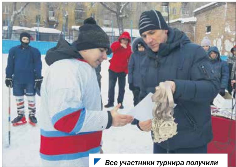
Все участники турнира получили памятные медали и призы.