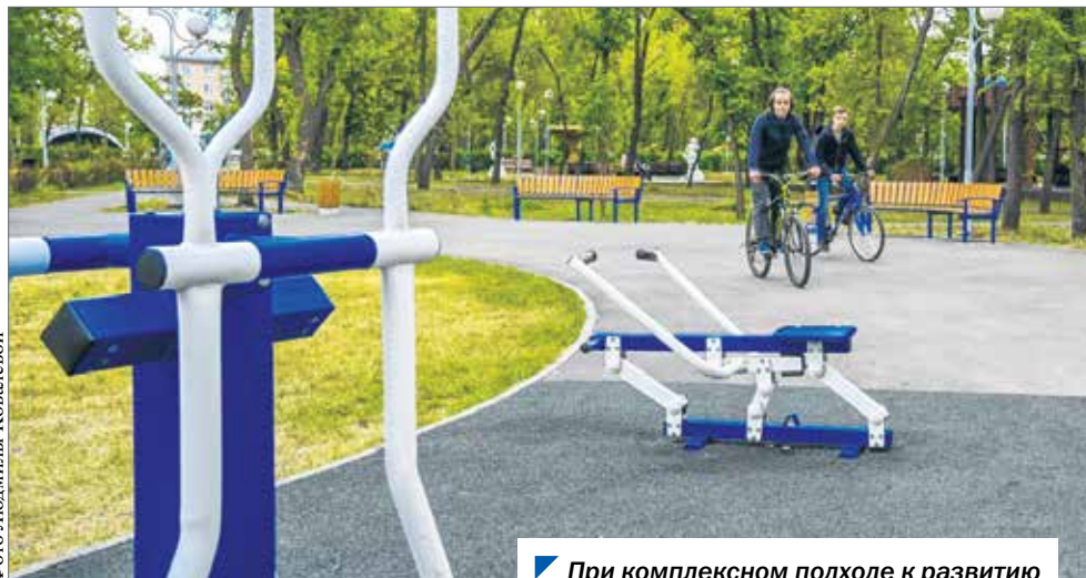
При комплексном подходе к развитию территории в выигрыше остаются все.

— В региональном бюджете на 2021 год утверждена сумма в 750 миллионов рублей на всю Челябинскую область. При этом губернатор поручил министерству финансов проработать вопрос увеличения суммы в два раза. Хотелось бы, чтобы все инициативы этого года были реализованы именно в текущем году. Однако если сейчас у конкретной инициативной группы что-то не получилось, можно в следующем году выйти с тем же проектом.