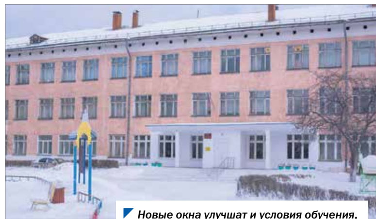
Новые окна улучшат и условия обучения, и общий вид школ и детских садов.

— Задача стояла следующая: к 2022 году должны быть полностью заменены окна в образовательных организациях по всей Челябинской области. И эта задача посильная, — подчеркнул председатель Законодательного Собрания.