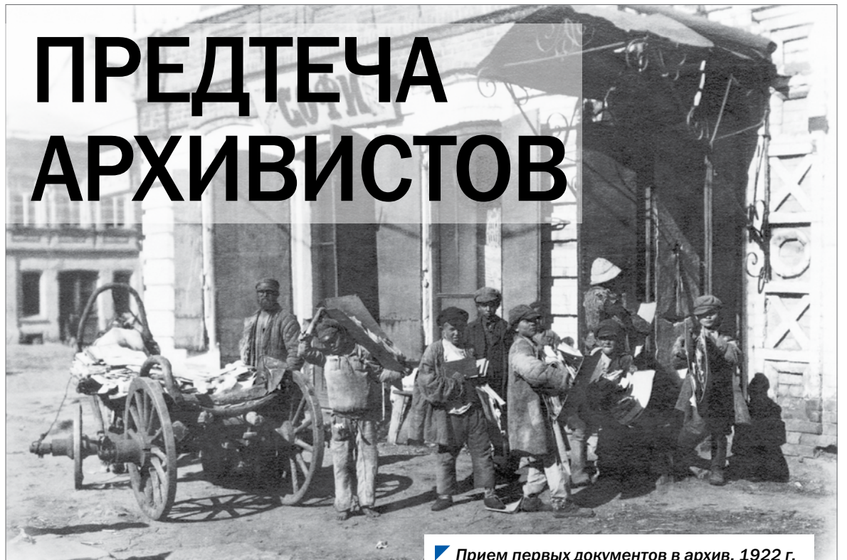
Прием первых документов в архив, 1922 г.

Еще одна серьезная тревога произошла на рубеже 1923 — 1924 годов, когда Челябинская губерния была ликвидирована и на ее основе создали четыре округа, вошедшие в состав гигантской Уральской области. Местные власти считали, что содержание архива слишком затратно для одного округа, и собирались вместо него оставить лишь по одному архивариусу в каждом окружном исполкоме, которые занимались бы не столько сбором истори-