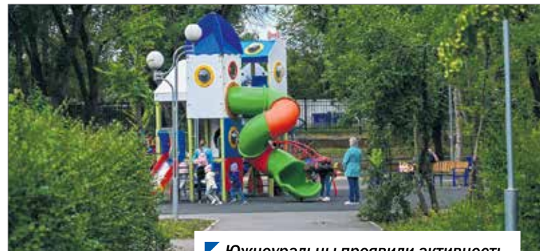
Южноуральцы проявили активность в инициативном бюджетировании.