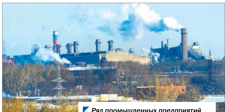
Ряд промышленных предприятий реализует природоохранные проекты.

Комитет по экологии и природопользованию обсудил реализацию в 2020 году региональной программы «Охрана окружающей среды Челябинской области». Депутаты обратили особое внимание на снижение уровня загрязнения воздуха в период НМУ в крупных промышленных центрах.