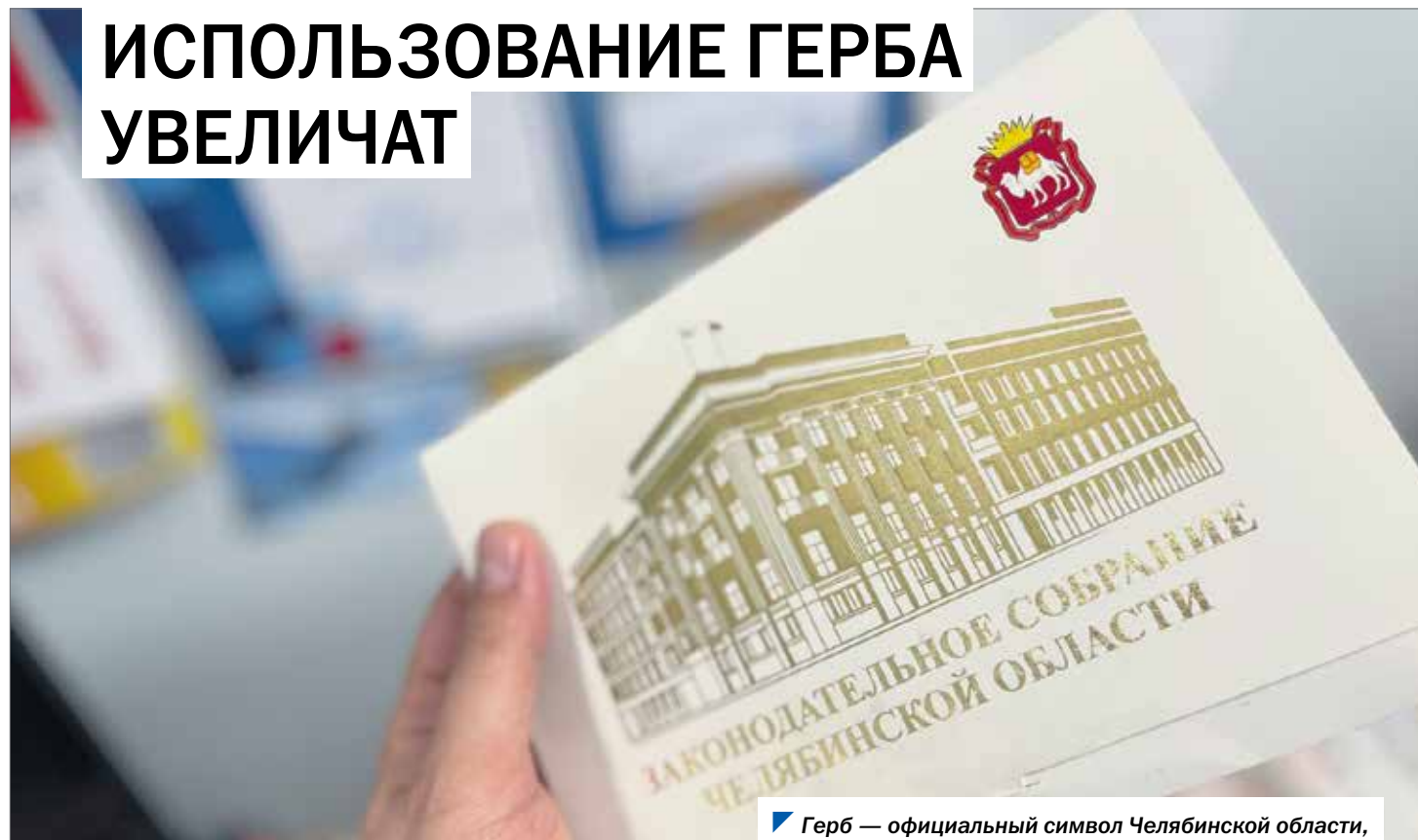
Герб — официальный символ Челябинской области, использование которого определено законом.