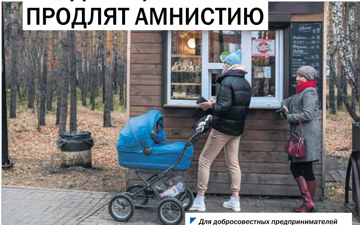
Для добросовестных предпринимателей в регионе создаются благоприятные условия.