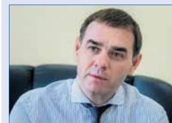
Александр ЛАЗАРЕВ, первый заместитель председателя Законодательного Собрания, председатель комитета по бюджету и налогам (фракция «Единая Россия»)

обязательство освоить новые технологии для производства промышленной продукции, должен составить 13,5%.