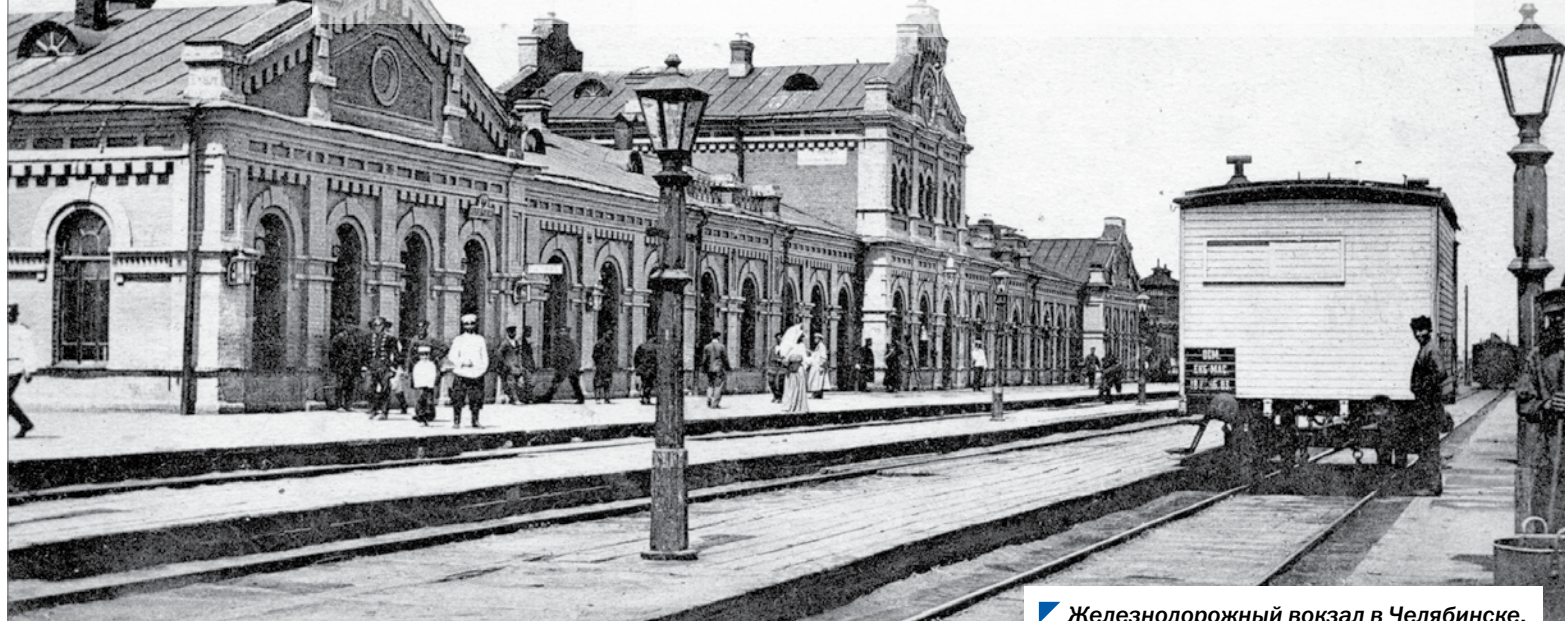
Железнодорожный вокзал в Челябинске. Открытие начала 20 века.

Константин Яковлевич Михайловский — первый почетный гражданин города Челябинска. Это звание ему было присвоено императором 4 апреля 1896 года. Обширные разносторонние знания, полученные в Михайловской артиллерийской академии, Институте корпуса путей сообщения, недюжинный организаторский талант, воплотились в Транссибе — величайшем достижении инженерно-технической мысли России и всего мира.