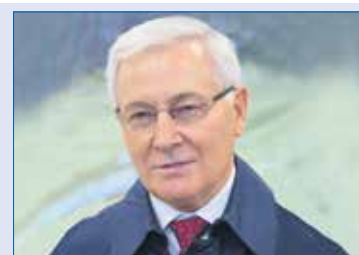
Юрий КАРЛИКАНОВ, заместитель председателя Законодательного Собрания (фракция «Единая Россия»):

ма жильцы освобождаются от взносов на капитальный ремонт. А то, что было уплачено до этого, идет в общий фонд на реализацию решения по комплексному развитию территории. На месте ветхих и аварийных объектов будут возводиться не только многоквартирные дома, но и культурные, спортивные объекты, скверы.