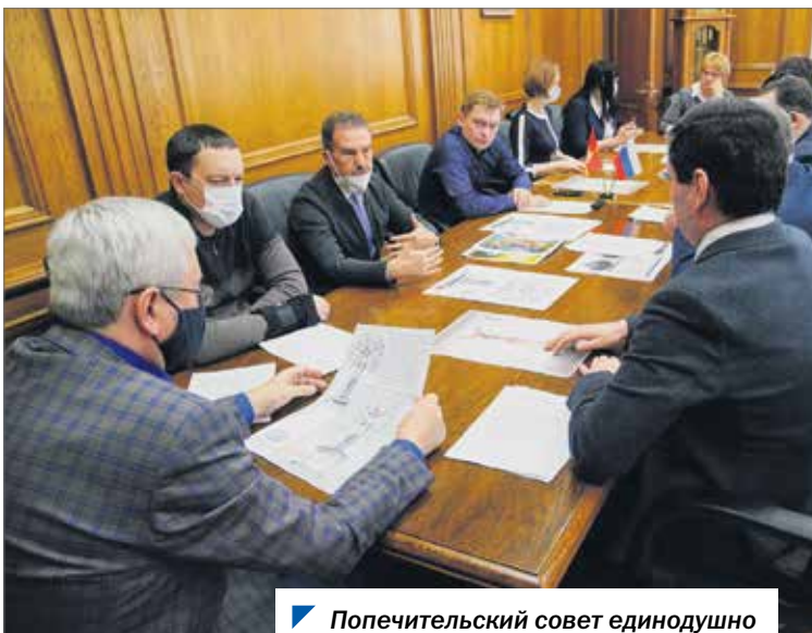
Попечительский совет единодушно выбрал лучший проект конкурса.