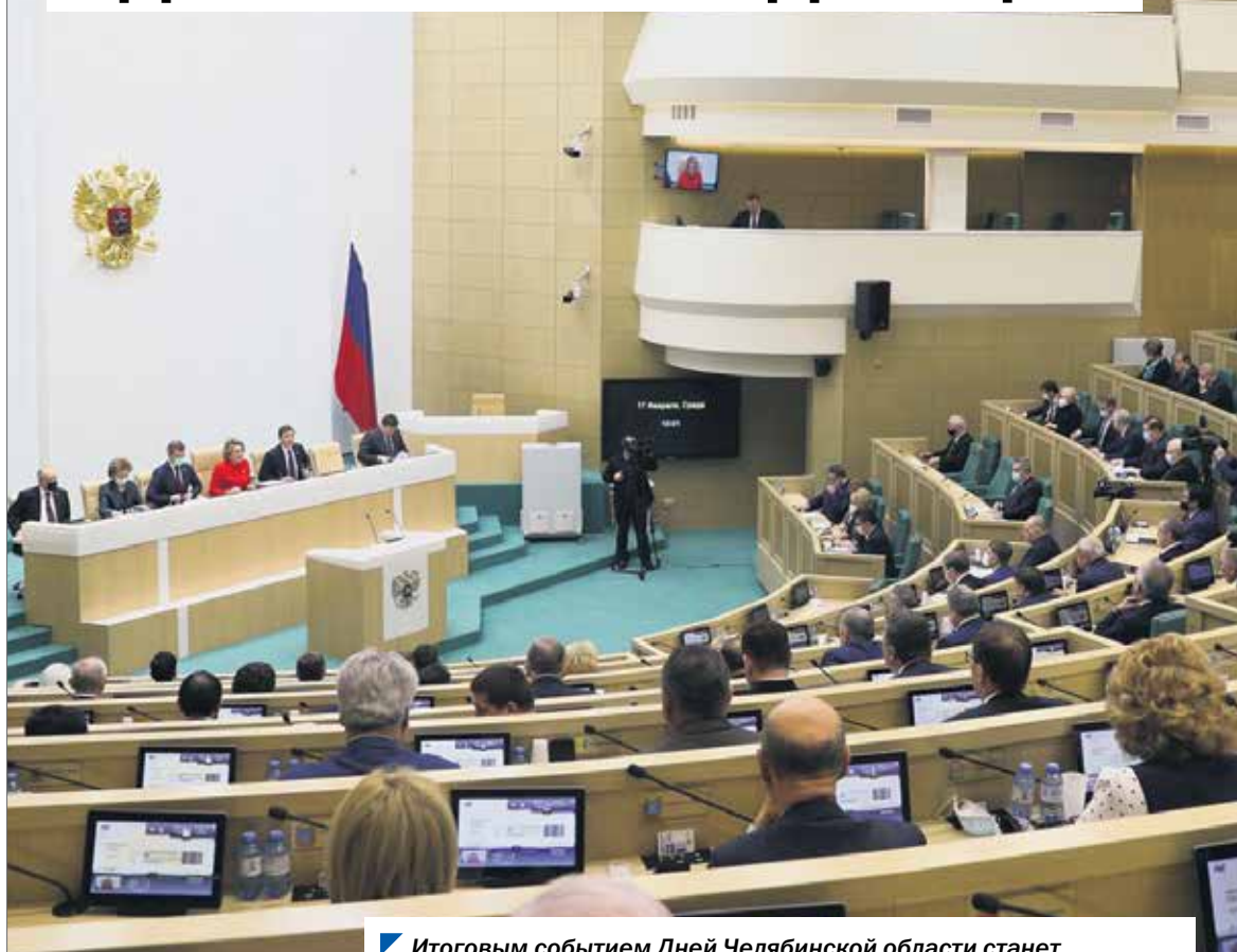
Итоговим событием Дней Челябинской области станет «Час субъекта» в рамках пленарного заседания Совета Федерации.