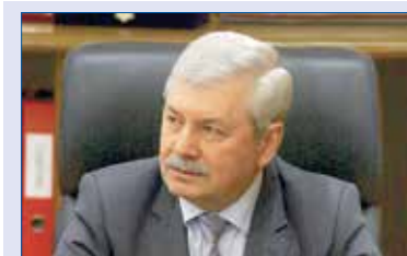
Владимир МЯКУШ, председатель Законодательного Собрании Челябинской области (фракция «Единая Россия»):

Депутаты также приняли важные поправки в областной закон о нестационарных торговых объектах, срок действия так называемой амнистии для этой категории