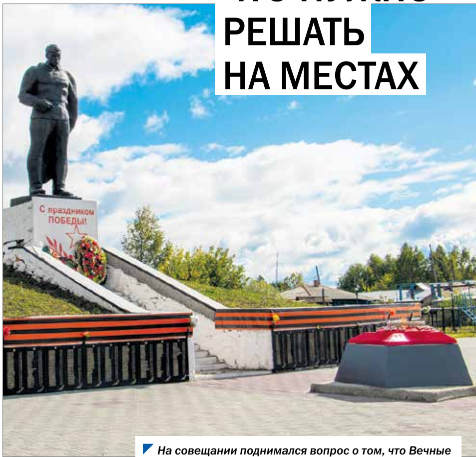
На совещании поднимался вопрос о том, что Вечные огни в муниципалитетах должны гореть постоянно.

Вопросы, актуальные для муниципалитетов, обсудило накануне руководство Законодательного Собрания с председателями представительных органов городских округов и районов. В частности, речь шла о реализации на местах программы комплексного развития территорий.