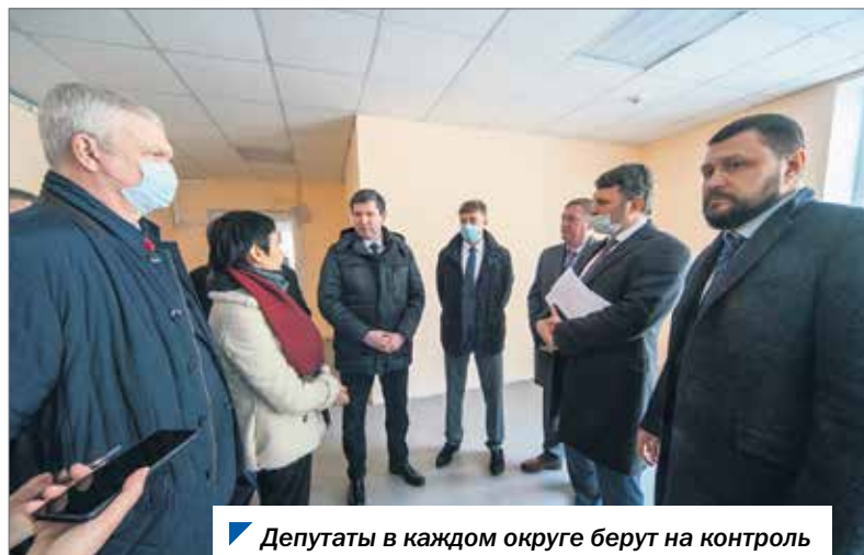
Депутаты в каждом округе берут на контроль вопросы первичного звена медицины.

Кстати, некоторые населенные пункты района признаны удаленными, а значит, специалисты, пожелавшие там работать, могут получить повышенные подъемные в рамках программ «Земский доктор» и «Земский фельдшер».