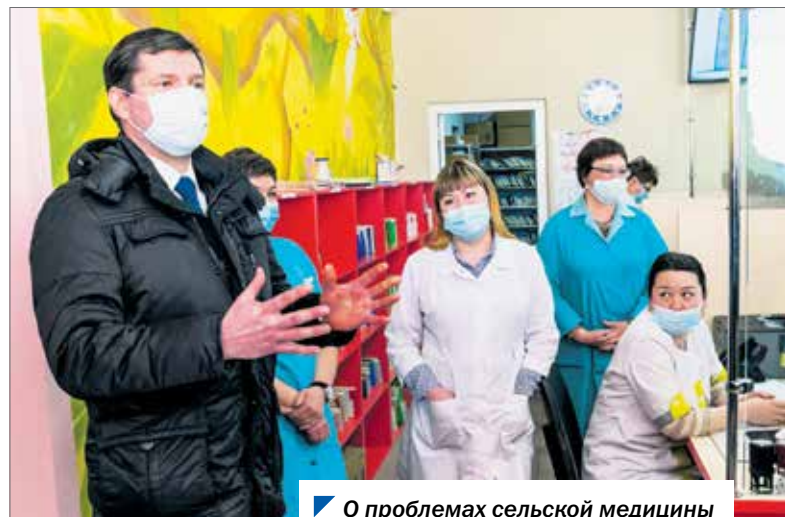
О проблемах сельской медицины важно слышать из первых уст.

/// Мы довольны нашим фельдшером. Это хороший специалист, ответственный человек. Часто к ней обращаемся. А если она в отпуске, мы едем в Кузнецкое, там помощь получаем. Конечно, нашему поселку нужен новый ФАП. ///