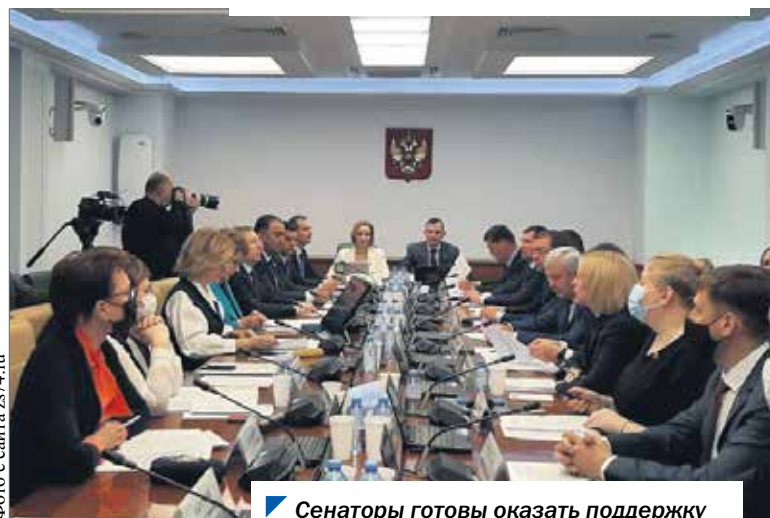
Сенаторы готовы оказать поддержку законодательным инициативам региона.