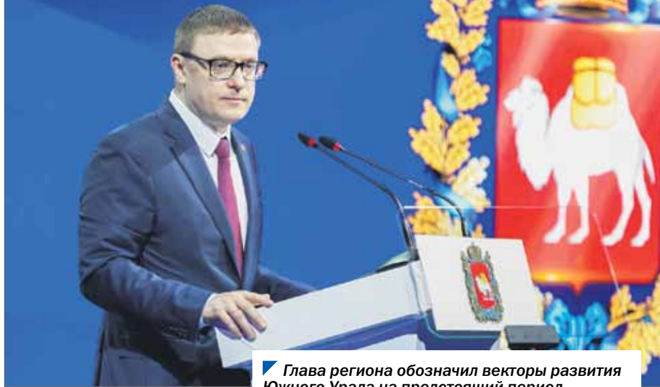
Глава региона обозначил векторы развития Южного Урала на предстоящий период.

25 мая в рамках заседания Законодательного Собрания глава региона Алексей Текслер выступил с отчетом о деятельности областного правительства за 2020 год. Это третье по счету его обращение к депутатскому корпусу Южного Урала. Первое состоялось в 2019 году, когда Алексей Текслер был в должности временно исполняющего обязанности губернатора Челябинской области. Прошлогодний доклад в связи с пандемией был оглашен в онлайн-формате. Сегодняшняя ситуация позволила обратиться к парламентариям очно.