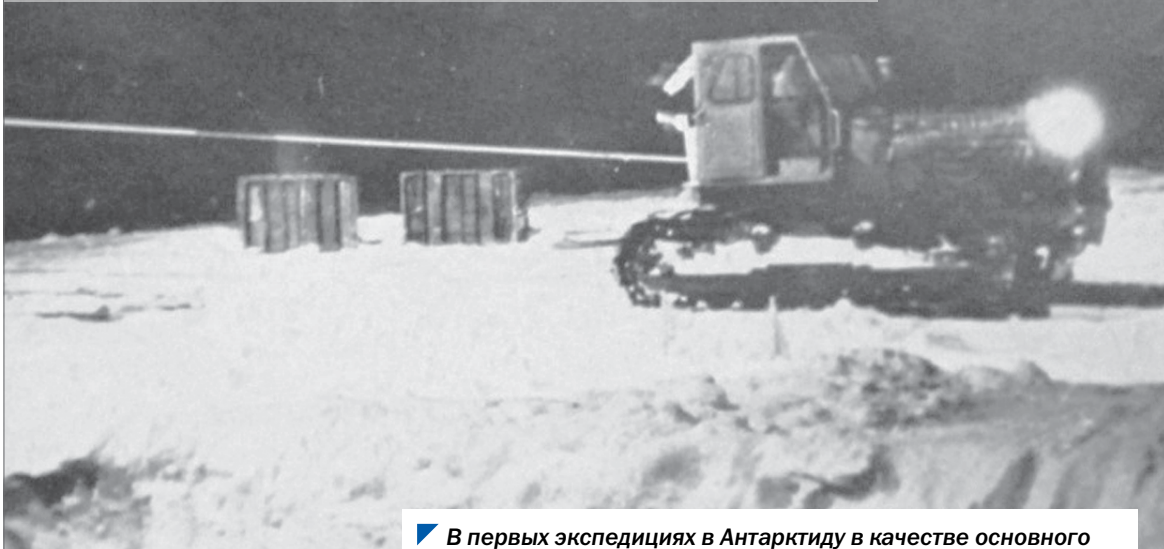
В первых экспедициях в Антарктиду в качестве основного наземного транспорта использовались челябинские тракторы.

Если бы 200 лет назад первооткрыватели Антарктиды российские мореплаватели Фаддей Беллинсгаузен и Михаил Лазарев имели мощные тракторы ЧТЗ, Россия уже тогда продвинулась бы вглубь материка и основала там свои станции. Но это случилось лишь в начале 1956 года, когда первая советская экспедиция под руководством ученого-океанолога и опытного полярного исследователя Михаила Сомова прибыла на Южный полюс.