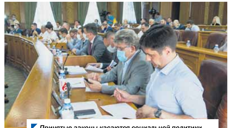
Принятые законы касаются социальной политики, поддержки промышленности, самозанятых и не только.

— Инициатива исключает компенсационный характер выплаты на установку внутридомового газового оборудования, — отметил председатель комитета по социальной по-