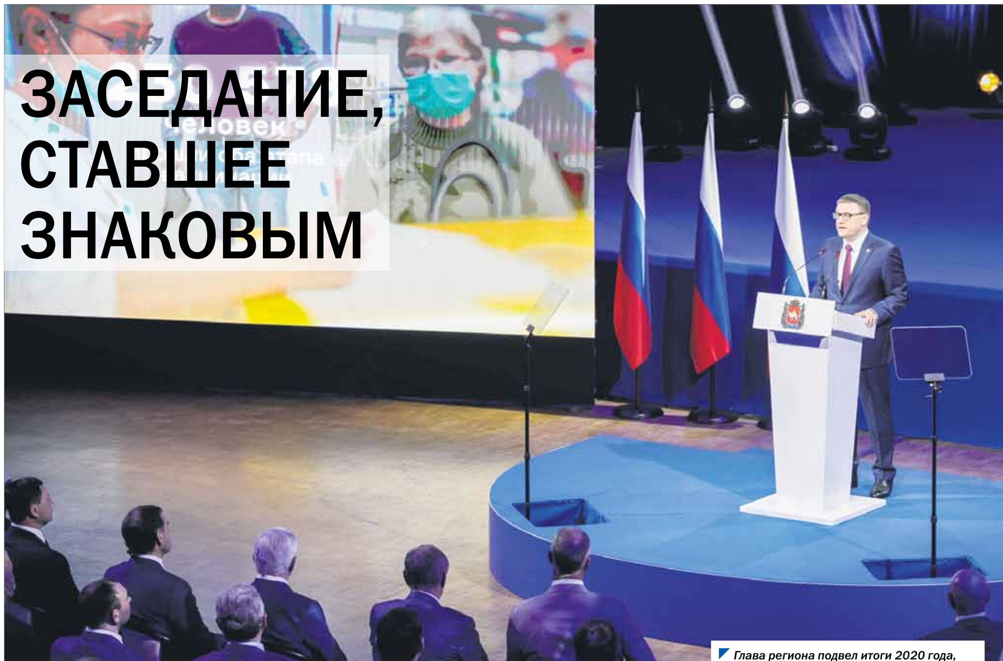
Глава региона подвел итоги 2020 года, оказавшегося непростым для Южного Урала.

Одиннадцатое заседание Законодательного Собрания, прошедшее 25 мая, можно считать одним из знаковых в седьмом созыве. Ежегодный отчет губернатора о результатах деятельности областного правительства стал первым для обновленного депутатского корпуса. По завершении доклада, прозвучавшего в Центре международной торговли, остальные вопросы повестки депутаты рассмотрели в зале заседаний Законодательного Собрания.