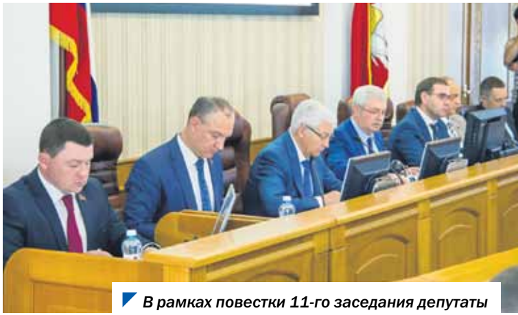
В рамках повестки 11-го заседания депутаты рассмотрели ряд важных законопроектов.

Резиденты и управляющие компании индустриальных парков освобождены от уплаты транспортного налога на пять лет.