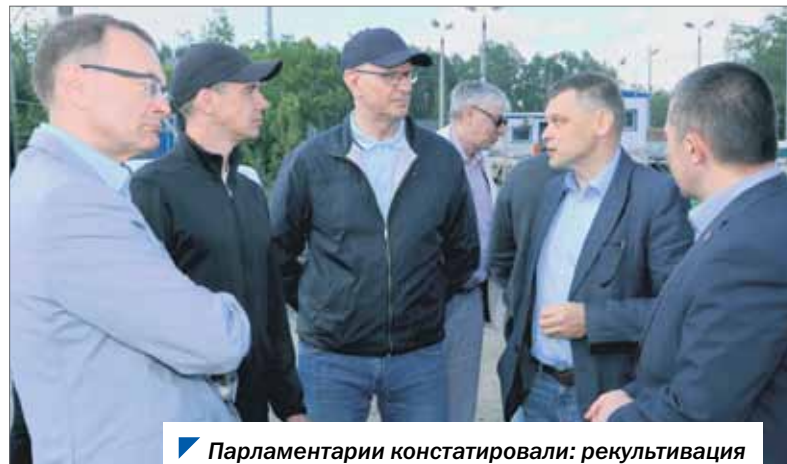
Парламентарии констатировали: рекультивация Челябинской свалки ведется должным образом.

Добавим, в отчете областному парламенту губернатор Алексей Текслер заявил, что по завершении рекультивации Челябинской свалки на очереди — объекты Магнитогорска, Златоуста, Миасса, Троицка.