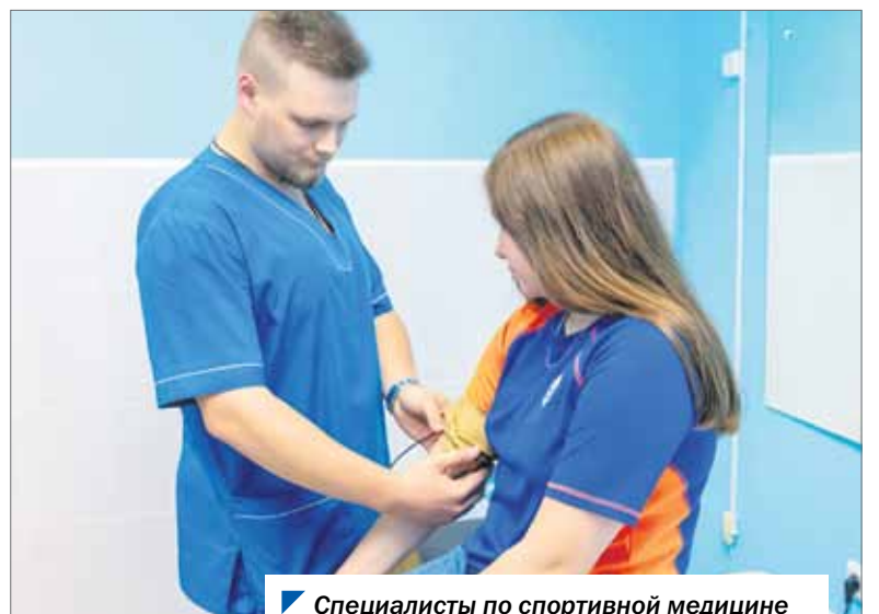
Специалисты по спортивной медицине всегда могут обратиться к своему депутату.

В каждой территории округа — свои насущные проблемы. В Златоусте вопрос медицинского обслуживания населения — один из приоритетных. Считаю, что система здравоохранения города заслуживает быть в числе передовых.