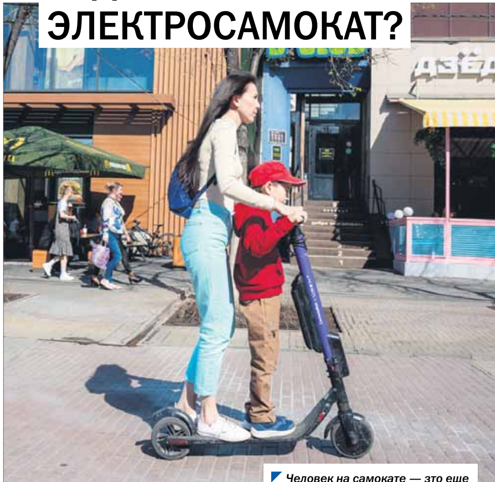
Человек на самокате — это еще не водитель, но уже не пешеход.

Все чаще на улицах крупных городов нашего региона можно встретить людей на электросамокатах. И если еще недавно это была исключительно частная история, то сегодня, с приходом в тот же Челябинск услуги по их прокату, явление встало, что называется, на поток. К слову сказать, пока не вполне регулируемый.