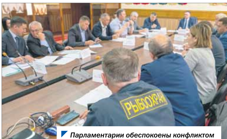
Парламентарии обеспокоены конфликтом между рыбаками и рыболовами.

В южноуральском парламенте за одним столом собрались депутаты Законодательного Собрания, представители исполнительной власти, контролирующих органов, предприниматели и рыбаки.