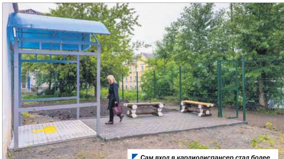
Сам вход в кардиодиспансер стал более удобным, что очень важно для пациентов.