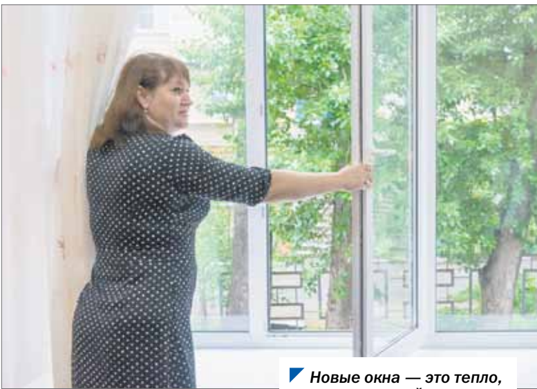
Новые окна — это тепло, уют и эстетичный вид.

Сегодня новые входные двери установлены — современные, надежные, отвечающие всем требованиям безопасности, в том числе и антитеррористической.