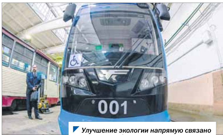
Улучшение экологии напрямую связано с развитием общественного транспорта.