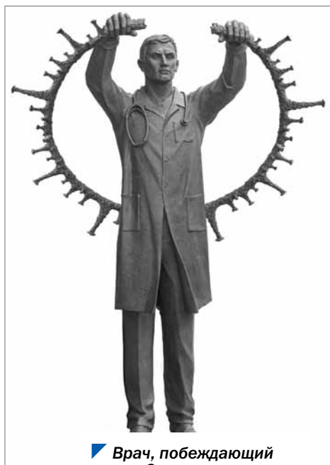
Врач, побеждающий вирус. Эскиз памятника.