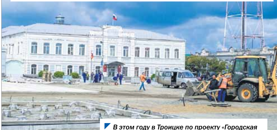
В этом году в Троицке по проекту «Городская среда» обустраивают парк культуры им. Н.Д. Томина.

В 2021 году в Челябинской области благоустроят 119 дворовых и 128 общественных территорий, реализуют проект «Родной берег. Концепция развития и благоустройства набережной города Нязепетровска» и обустраивают парк культуры им. Н.Д. Томина в Троицке.