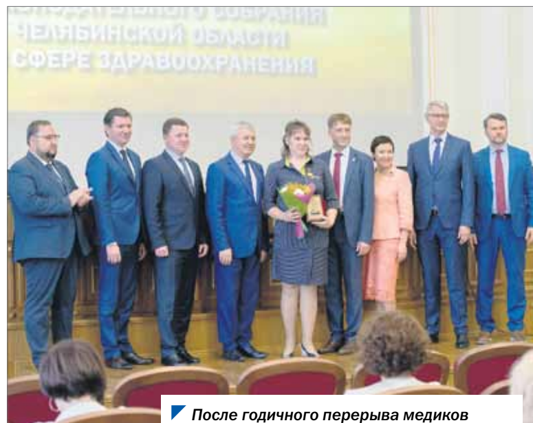
После годичного перерыва медиков снова чествовали в областном парламенте.

— Не выгорать, не терять интереса к медицине, уважать не только пациентов, но и друг друга. Всем — больше позитива, больше отдыха в свободные от дежурств часы, больше проводить времени с семьей.