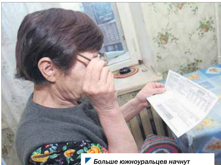
Больше южноуральцев начнут получать компенсацию за услуги ЖКХ.

При этом меры поддержки не будут распространяться на тех, кто стал инвалидом в результате их противоправных действий.