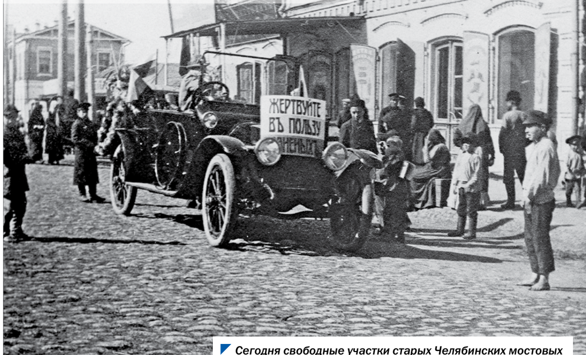
Сегодня свободные участки старых Челябинских мостовых сами по себе являются памятником истории и культуры.

Недавно при прокладке электрического кабеля на площади Ярославского в Челябинске рабочие наткнулись на фрагмент старинной мостовой. Это место находится в историческом центре города, сама площадь именовалась Соборной, в честь Христорождественского собора — первого каменного храма в городе, заложенного еще в 1748 году, а спустя два века снесенного.