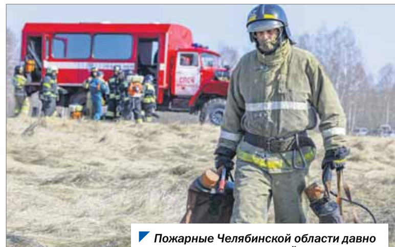
Пожарные Челябинской области давно заслуживают региональной награды.