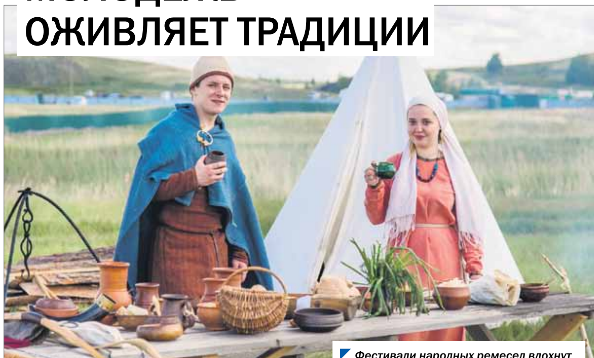
Фестивали народных ремесел вдохнут новую жизнь в сельские территории.