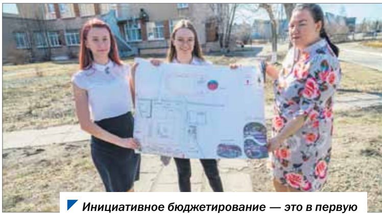
Инициативное бюджетирование — это в первую очередь реализация проектов самих жителей.