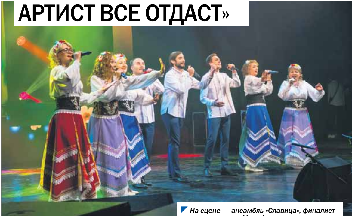
На сцене — ансамбль «Славица», финалист восьмого сезона «Марафона талантов».

В финале восьмого сезона областного народного конкурса «Марафон талантов», прошедшего накануне в Челябинске, участвовали 27 коллективов из 15 муниципалитетов нашего региона. Перед членами жюри стояла непростая задача — выявить лучших из лучших, и они с ней, безусловно, справились. Начиная с этого номера, мы будем представлять читателям одного из победителей в той или иной номинации конкурса. Как говорится, знай наших!