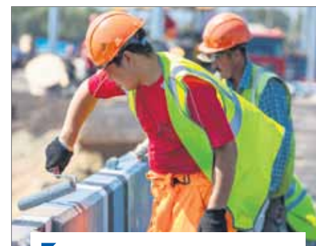
В Челябинске реконструируют Ленинградский мост.

По мнению депутатов, в регионе ведется большая работа по приведению дорог к транспортно-эксплуатационным показателям.