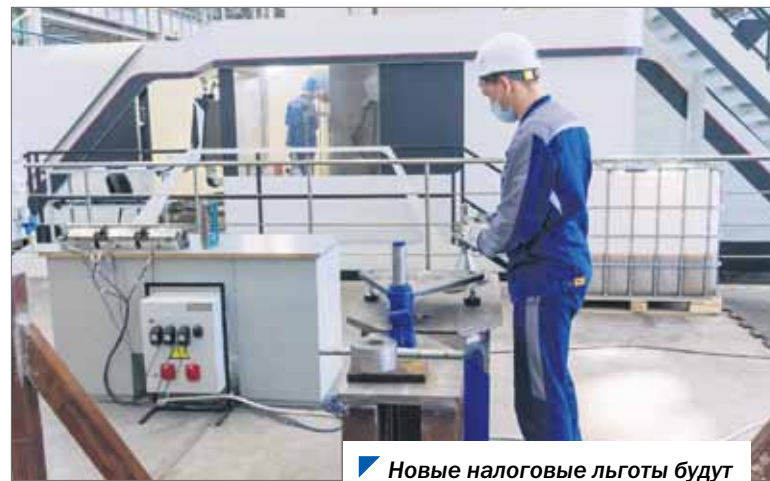
Новые налоговые льготы будут востребованы технопарками.

Отметим, особая экономическая зона как территория с льготным налоговым и таможенным режимом является одним из инструментов повы-