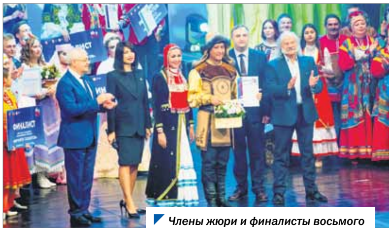
Члены жюри и финалисты восьмого сезона конкурса «Марафон талантов».