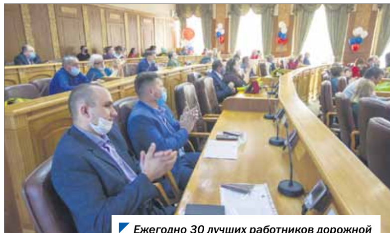
Ежегодно 30 лучших работников дорожной отрасли получают звание лауреата.

На развитие дорожного хозяйства в области в этом году направлено более 20 млрд рублей. На выделенные средства будет построено и отремонтировано порядка 800 км дорог.