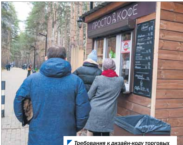
Требования к дизайн-коду торговых киосков продолжают совершенствовать.

Вопрос размещения в муниципалитетах нестационарных торговых объектов обсуждался на совещании в Законодательном Собрании Челябинской области.