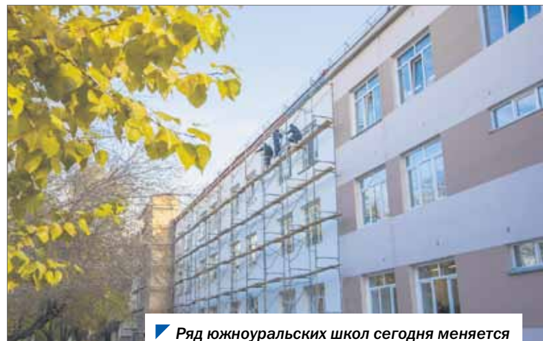
Ряд южноуральских школ сегодня меняется благодаря инициативному бюджетированию.

— Я учился в этой школе, жил неподалеку, иными словами, здесь прошла моя юность, — признался парламентарий. — Безусловно, жаль, что в последнее время школьный стадион не обновлялся. У нас есть интересные проекты по преобразованию школьных спортивных площадок в Южноуральске, в Челябинске, других городах. Вдохновляет на эти работы и столичный опыт — в Москве запущена широкомасштабная программа благоустройства школьных спортивных площадок. Эти объекты посещают и взрослые, и дети. Необходимо перени-