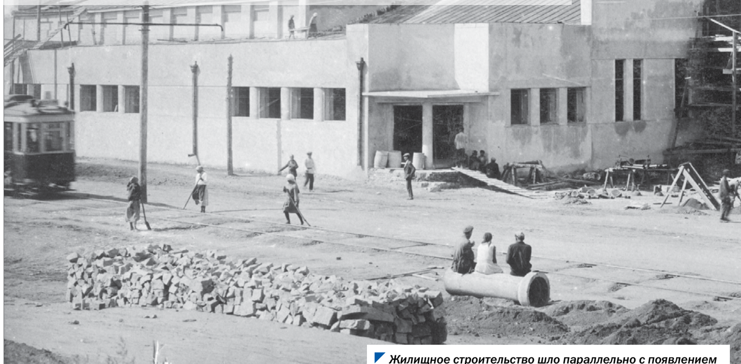
Жилищное строительство шло параллельно с появлением Челябинского металлургического комбината, 1933 год.

В годы первых пятилеток в Челябинске велось строительство нескольких металлургических предприятий. В 1930 году абразивный, ферросплавный и электродный заводы были объединены в Челябинский электротермический комбинат, спустя год это объединение переименовали в Челябинский электрометаллургический комбинат. 90 лет назад 25 июля 1931 года первым из предприятий комбината приступил к работе Челябинский ферросплавный завод.