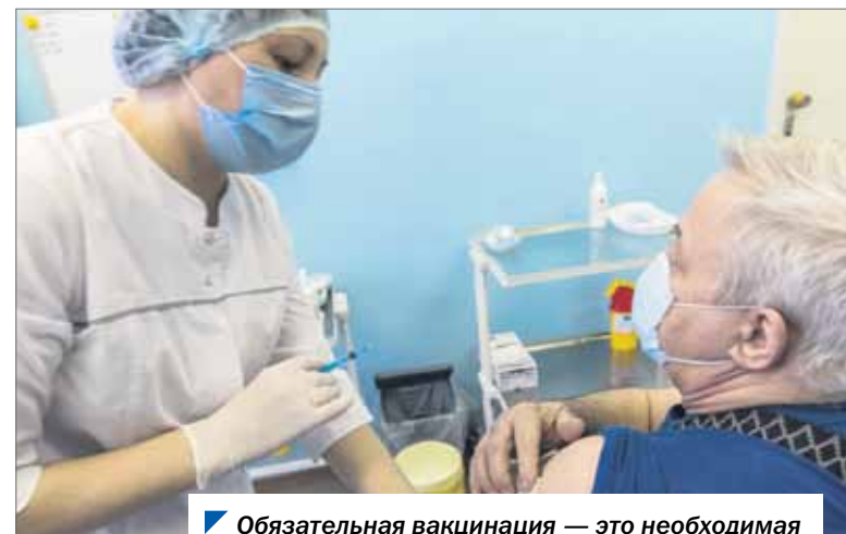
Обязательная вакцинация — это необходимая мера для победы над коронавирусом.

Ранее региональные власти информировали, что с 18 октября доступ на массовые мероприятия будет открыт только при наличии QR-кода, подтверждающего прохождение вакцинации от коронавируса. QR-код — особый код, который могут считывать мобильные устройства — находится в сертификате о прививке, перенесенном заболеванием или сделанном ПЦР-тесте. К слову, даже если у человека есть противопоказания к вакцинации, для посещения любых массовых мероприятий QR-код все равно понадобится (получить можно, сдав ПЦР-тест).