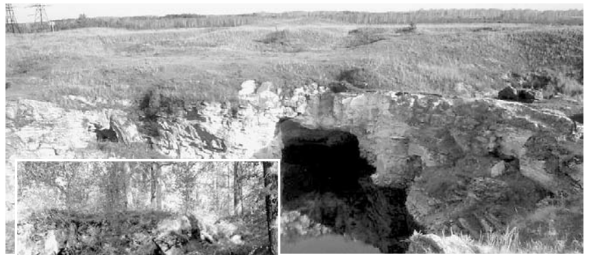
Андреевский каменный карьер.