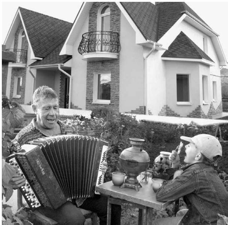
Уютный загородный дом — мечта любого челябинца.

— Во-первых, это не принцип. Глупо мыслить категорией «нравится — не нравится». Если повару не нравится готовить борщ, может, он зря стал поваром? А во-вторых, изменился сам