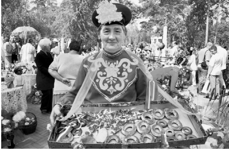
Продолжение. Начало на стр. 1

Проект постановления о принятии Концепции реализации государственной национальной политики в Челябинской области на 2011 – 2015 годы члены комитета приняли единогласно. Кроме того, парламентарии рекомендовали областному правительству принять программу реализации национальной политики в Челябинской области.