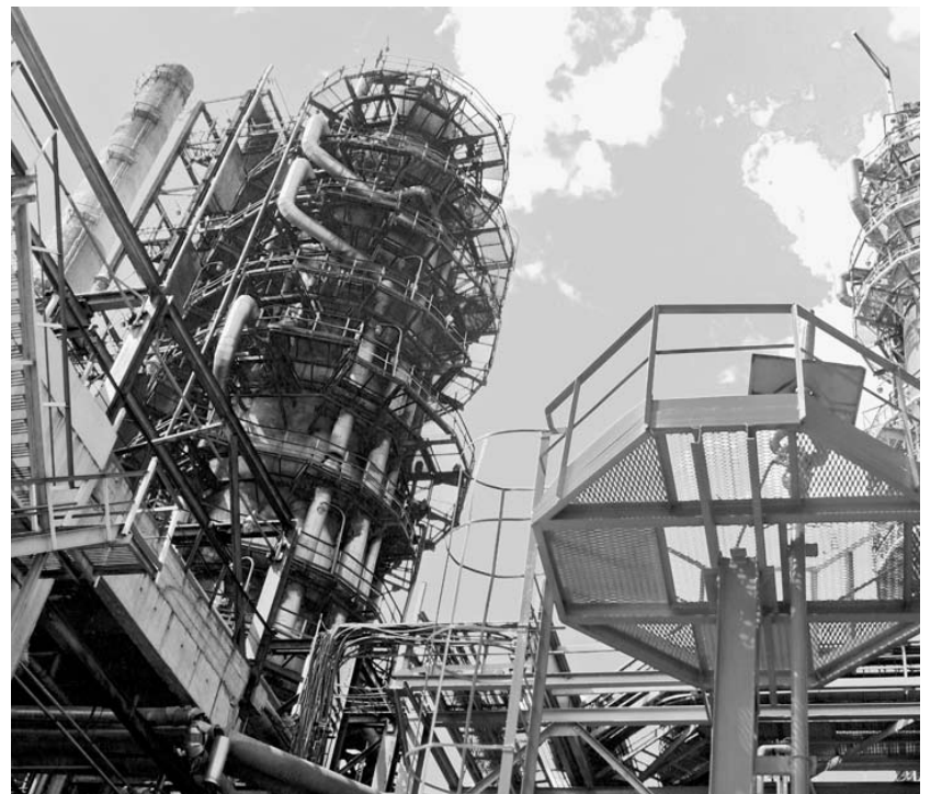
Задача региональных властей — не дать закрыться ни одному предприятию.