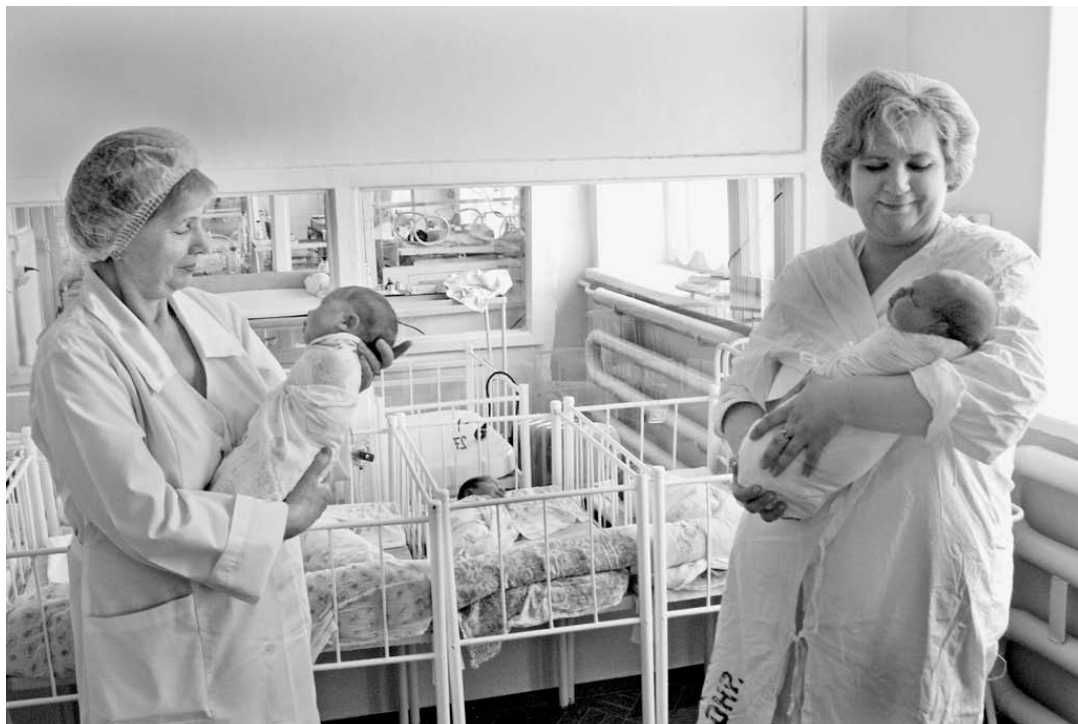
На протяжении последних лет на Южном Урале наблюдается настоящий бэби-бум.

— Их достаточно много. Например, как и прежде, будут четко и в полном объеме исполняться социальные проекты бюджета: помощь ветеранам, инвалидам, многодетным и малоимущим семьям. В Челябинской области система социальной поддержки, считаю, одна из самых отлаженных. Было бы глупостью отказываться от наработанных программ поддержки массового спорта, культуры, творческой талантливой молодежи. В области сформировано вполне эффективное информационное пространство, в том числе в сети Интернет. При всей критике большинство южноуральских событий все же имеют позитивный настрой. Это хороший признак, что область развивается, движется вперед, пытается поднять качество жизни людей. Такое не происходит по мановению волшебной палочки. Но у нас есть голова, руки и желание сделать нашу область лучше.