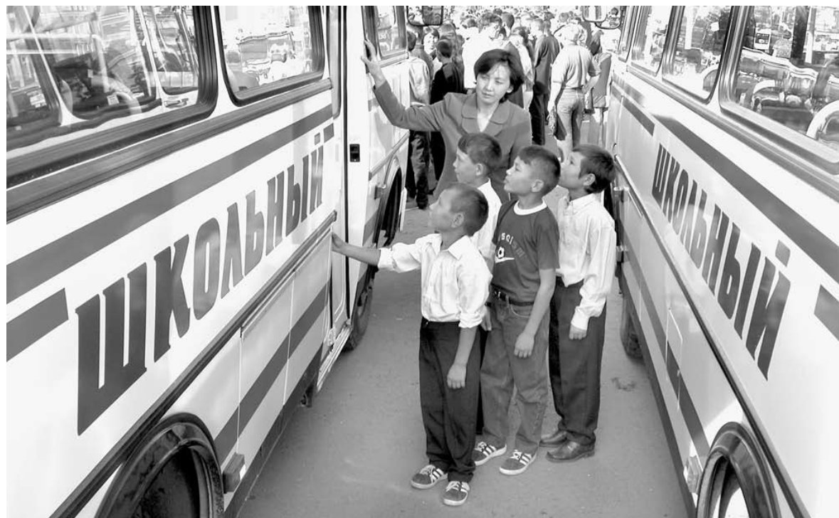
Для школ региона власти закупят не только оборудование, но и новые автобусы.