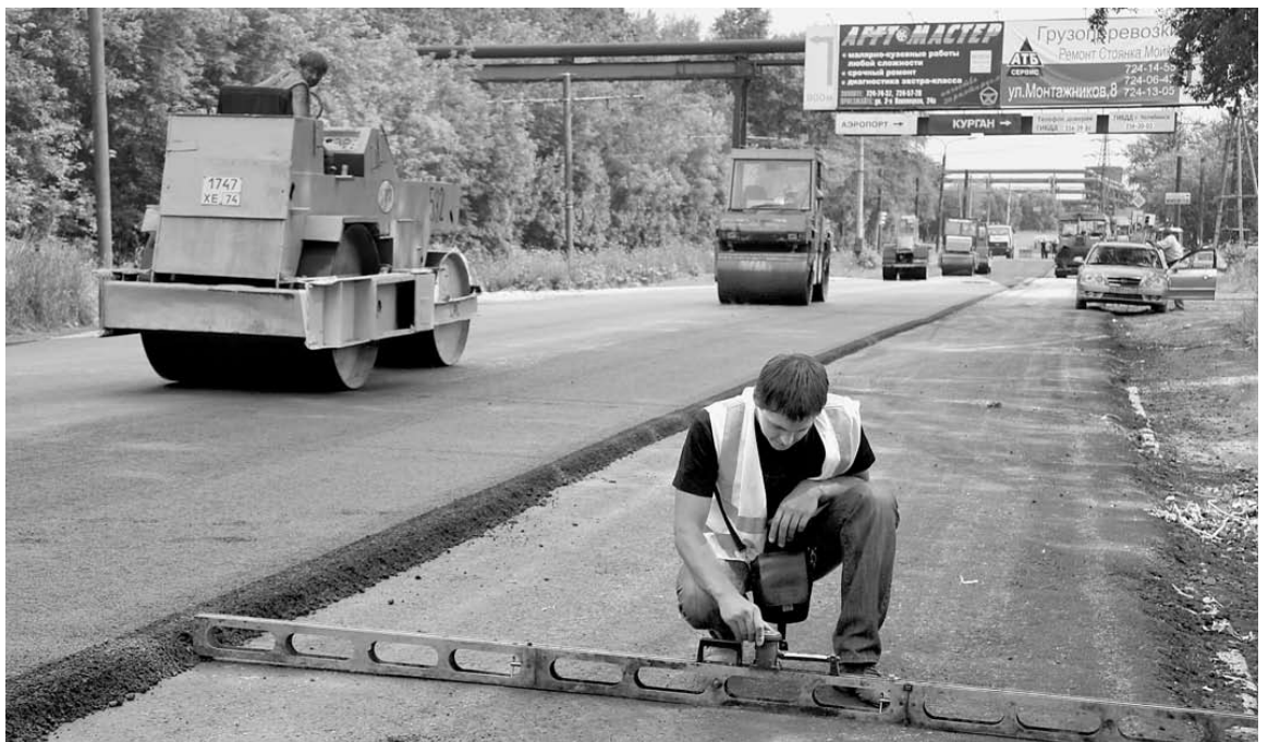
Дорожная революция из Челябинска перешла на всю область.

— Нагрузка на муниципалитеты всегда была значительной. По качеству