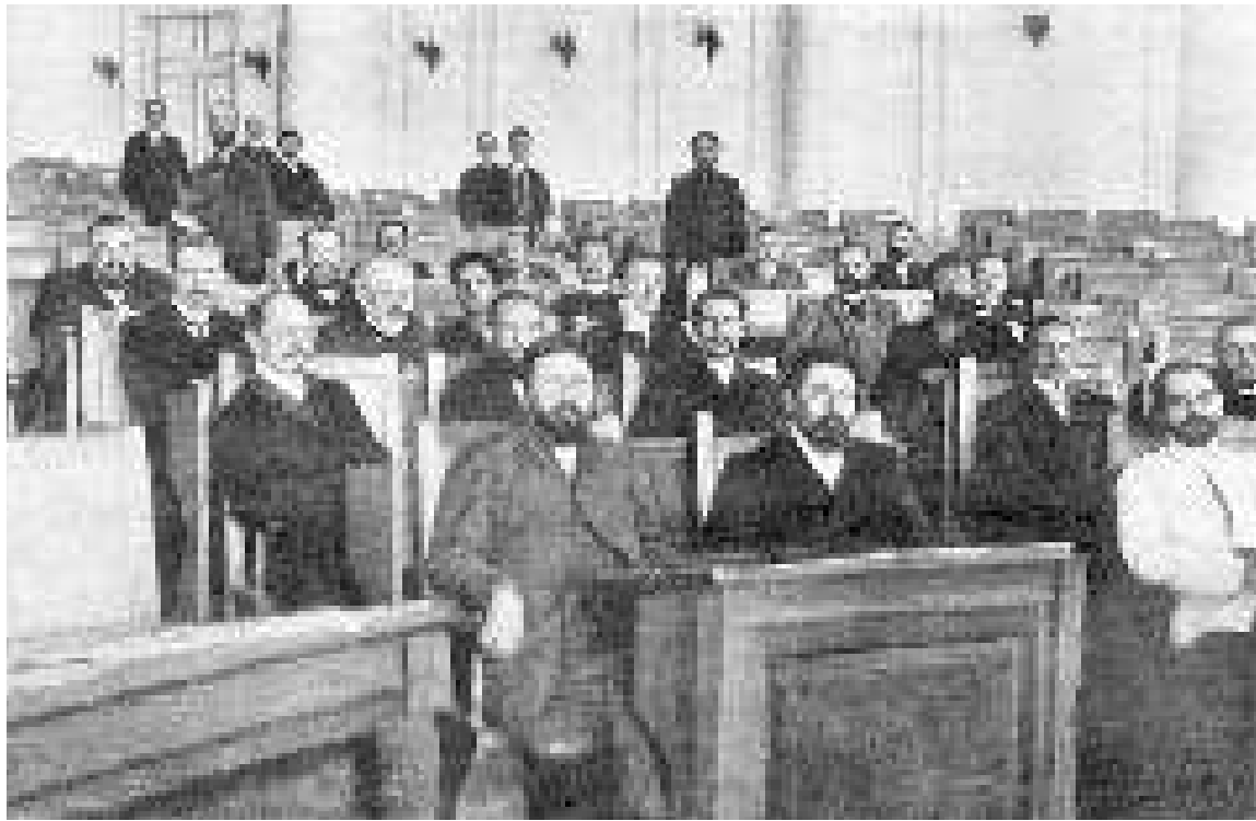
Депутаты в зале заседаний. Таврический дворец. Санкт-Петербург, 1906 год.