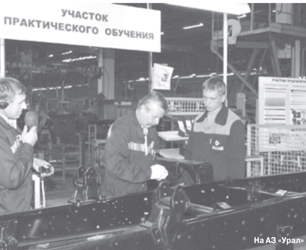
На АЗ «Урал»