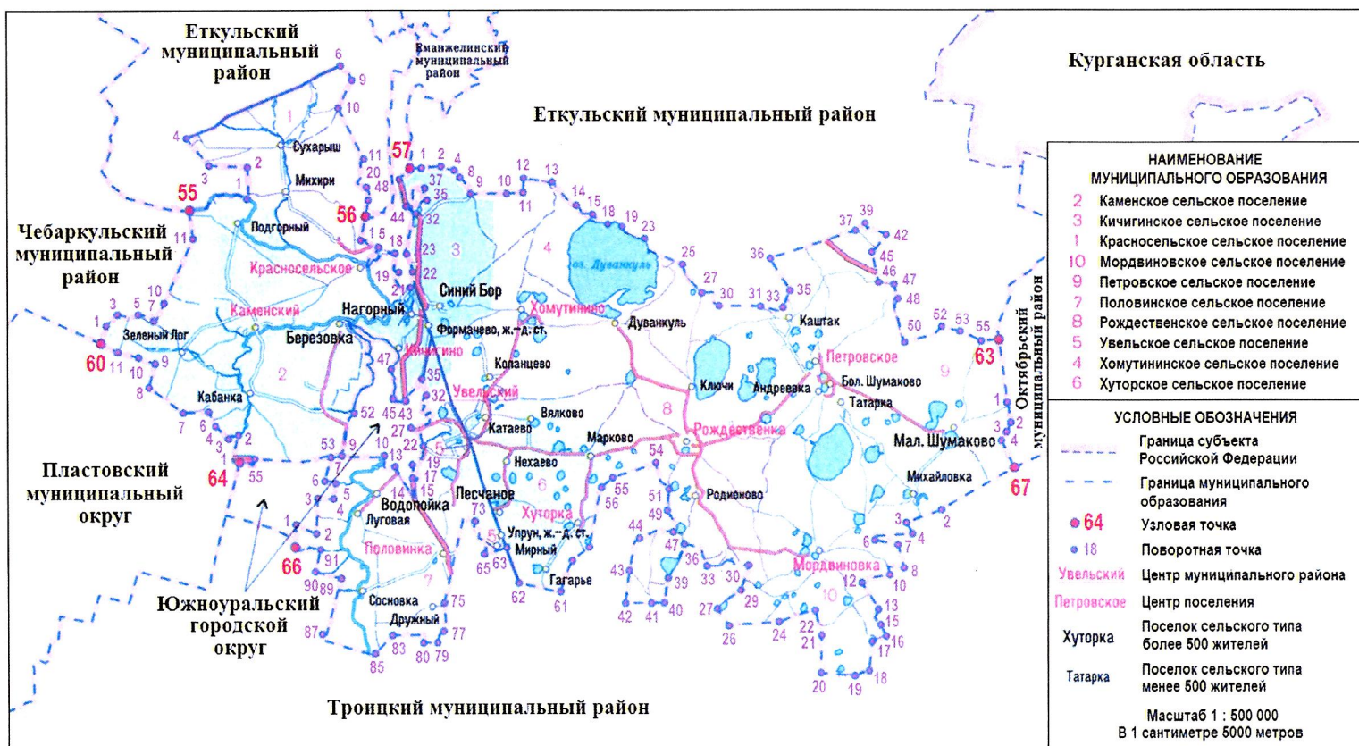
СХЕМА ГРАНИЦ Увельского муниципального района

«Приложение 2 к Закону Челябинской области «О статусе и границах Увельского муниципального района и сельских поселений в его составе»