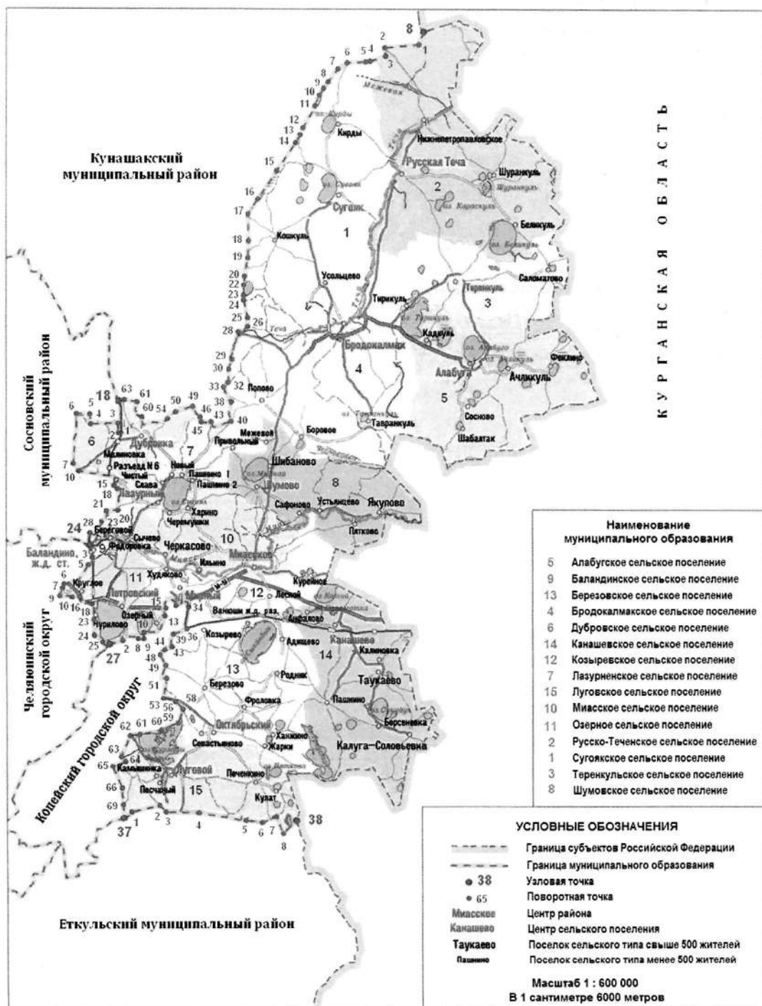
СХЕМА ГРАНИЦ Красноармейского муниципального района