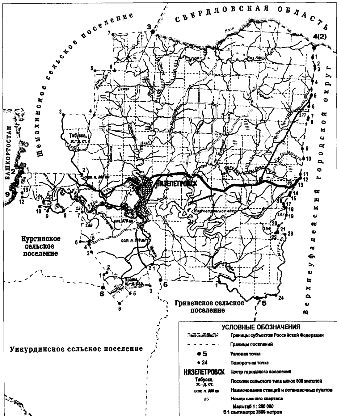
СХЕМА ГРАНИЦ Нязепетровского городского поселения

«Приложение 8 к Закону Челябинской области «О статусе и границах Нязепетровского муниципального района, городского и сельских поселений в его составе»