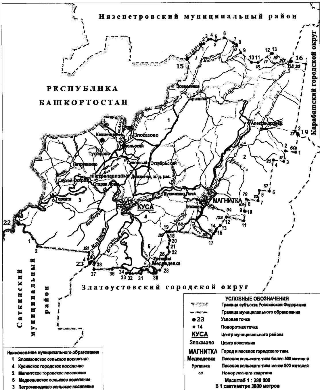
СХЕМА ГРАНИЦ Кусинского муниципального района

«Приложение 2 к Закону Челябинской области «О статусе и границах Кусинского муниципального района, городских и сельских поселений в его составе»