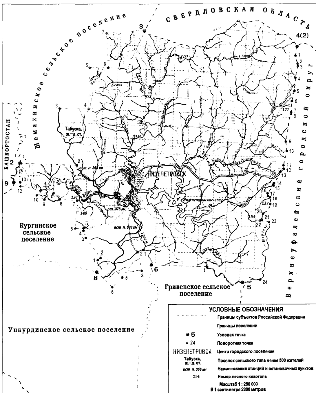
СХЕМА ГРАНИЦ Нязепетровского городского поселения

«Приложение 8 к Закону Челябинской области «О статусе и границах Нязепетровского муниципального района, городского и сельских поселений в его составе»