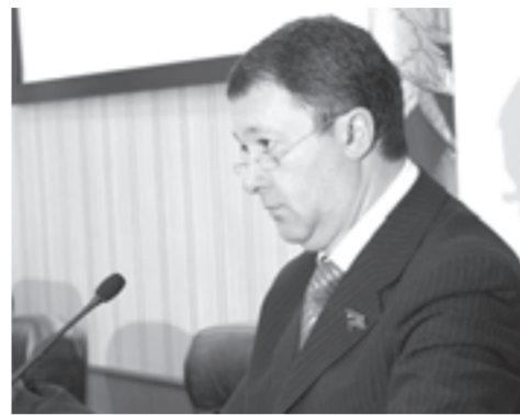
развития муниципального образования»; смотр-конкурс молодёжных парламентских формирований муниципальных образований Челябинской области, который

Также в план мероприятий по проведению Года молодёжи вошли: проведение выездного заседания Молодёжного регионального Собрания депутатов в городе Магнитогорске по теме «Молодёжная политика – основа инновационного