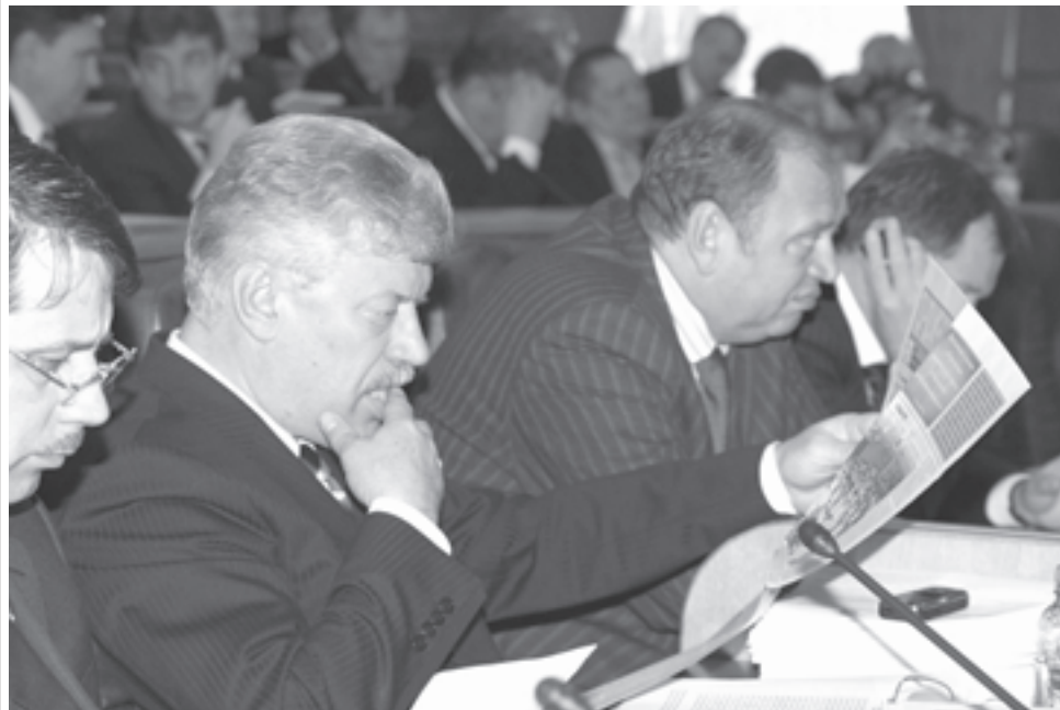
муниципальным районом и Коркинским городским поселением».