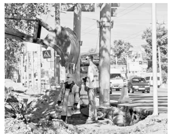
Депутат Михаил Видгоф уделяет особое внимание безопасности школьников на дорогах. Переход через дорогу у школы будет безопасным — синхронизированы все светофоры, перенесен остановочный комплекс, установлено дополнительное ограничение скорости для машин.