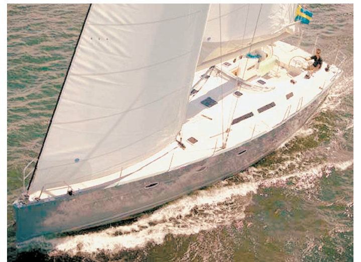
Парусная яхта HANSE 545 «Челябинск» пронесет знамя Южного Урала через весь мир.