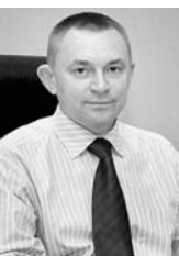
Александр ПУТИН, руководитель УФНС России по Челябинской области:

7. Руководителям организаций, индивидуальным предпринимателям и физическим лицам, являющимся налогоплательщиками на территории Челябинской области, обеспечивать своевременное и полное перечисление текущих платежей, а также погашение имеющейся задолженности по платежам в бюджетную систему Российской Федерации.