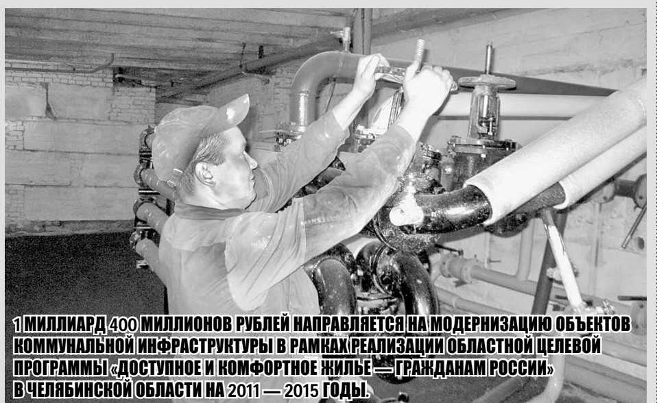
1 МИЛЛАРД 400 МИЛЛИОНОВ РУБЛЕЙ НАПРАВЛЯЕТСЯ НА МОДЕРНИЗАЦИЮ ОБЪЕКТОВ КОММУНАЛЬНОЙ ИНФРАСТРУКТУРЫ В РАМКАХ РЕАЛИЗАЦИИ ОБЛАСТНОЙ ЦЕЛЕВОЙ ПРОГРАММЫ «ДОСТУПНОЕ И КОМФОРТНОЕ ЖИЛЬЕ — ГРАЖДАНАМ РОССИИ» В ЧЕЛЯБИНСКОЙ ОБЛАСТИ НА 2011 — 2015 ГОДЫ.

Не останутся без государственной поддержки сельскохозяйственные производители. На условиях софинансирования с феде-