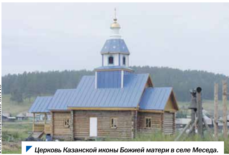
Церковь Казанской иконы Божией матери в селе Меседа.

Если и вы сумеете добраться до этой чудесной поляны в Уральских горах, поклонитесь могилам людей, несгибаемых под ударами судьбы, упорных в своей вере.