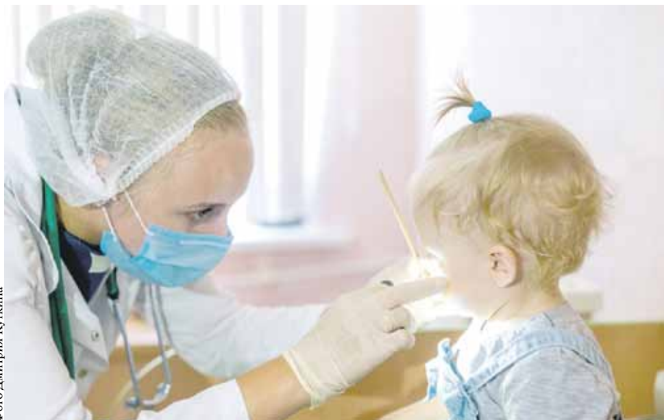
Фото Дмитрия Куткина

Для получения повышенной единовременной региональной выплаты есть несколько обязательных условий: