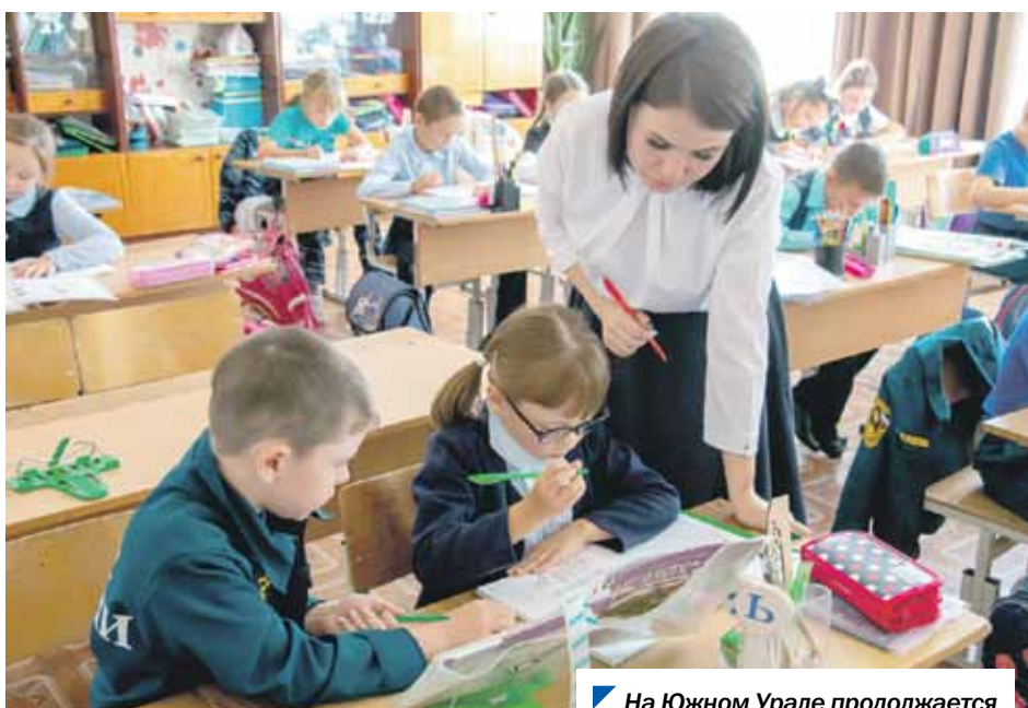
На Южном Урале продолжается строительство новых школ.

на производство и реализацию зерна — 68,8 млн рублей; на оказание мер соцподдержки херсонцам, вынужденно покинувшим место постоянного проживания и прибывшим в Челябинскую область, — 38,8 млн рублей; на мероприятия по предупреждению и борьбе с инфекционными заболеваниями — 13,8 млн рублей; на организацию профессионального обучения и дополнительного профобразования работников промышленных предприятий — 7,7 млн рублей.