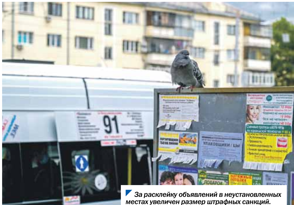
За расклейку объявлений в неустановленных местах увеличен размер штрафных санкций.