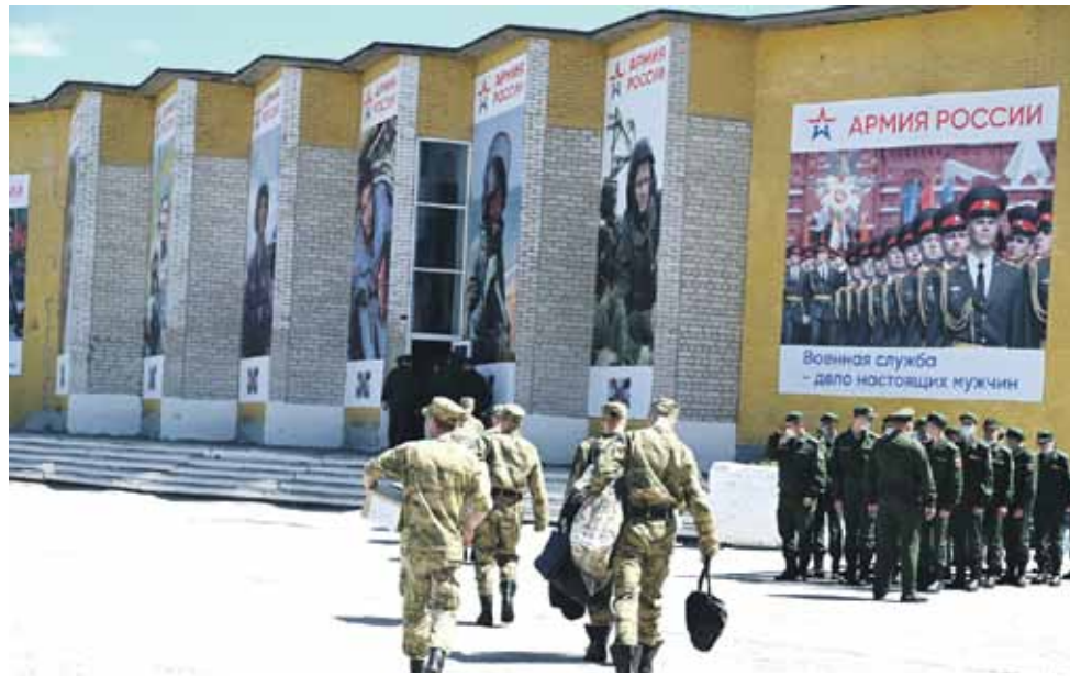
Российские солдаты должны быть уверены в нашей поддержке.

Ранее региональные единовременные выплаты в размере 50 000 рублей в связи с участием в специальной военной операции и 20 000 рублей на каждого ребенка до 18 лет были установлены для мобилизованных граждан, а также для южноуральцев, заключивших контракт с Минобороны РФ.