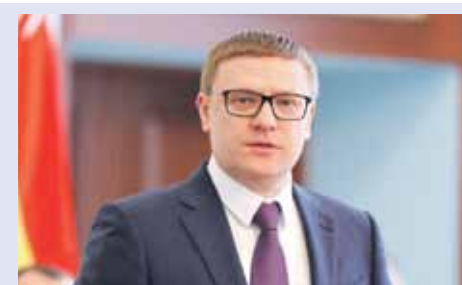
Алексей ТЕКСЛЕР, губернатор Челябинской области:

В первом чтении депутатский корпус региона рассмотрит законопроект 30 ноября.