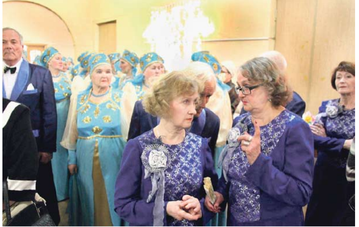
Именно им будет доверено представлять муниципальное образование

Добавим, что по результатам первого этапа в каждой территории планируется отобрать трех участни-