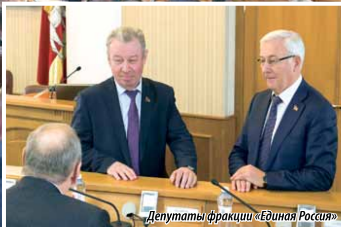
Депутаты фракции «Единая Россия»

НА ПРОШЛОЙ НЕДЕЛЕ СОСТОЯЛОСЬ Сорок четвертое заседание Законодательного собрания Челябинской области. Несмотря на то что вопросов в повестке было относительно немного, все они касались социально значимых тем