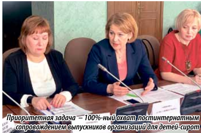
Приоритетная задача – 100%-ный охват постинтернатным сопровождением выпускников организаций для детей-сирот

Сегодня мы много видим различных реалити-шоу, так или иначе постановочных, но ни на федеральных каналах, ни на региональном телевидении нет примера передачи, посвященной маме. Телепроект «Мама» рассказывает о реальной жизни семей, о тяжелом материнском труде. В нем уже участвуют десять мам, десять семей из разных городов Челябинской области, в том числе многодетные мамы, матери-одиночки, матери с приемными детьми.