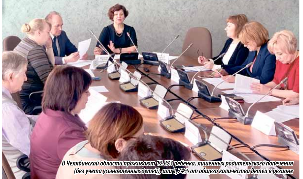
В Челябинской области проживают 12 873 ребенка, лишенных родительского попечения (без учета усыновленных детей), или 1,74% от общего количества детей в регионе

ЗАСЕДАНИЕ ОБЩЕСТВЕННОГО СОВЕТА ПО РЕАЛИЗАЦИИ В ЧЕЛЯБИНСКОЙ ОБЛАСТИ ПРОЕКТА «КРЕПКАЯ СЕМЬЯ» ПАРТИИ «ЕДИНАЯ РОССИЯ» СОСТОЯЛОСЬ В МИНУВШИЙ ЧЕТВЕРГ В ЗАКОНОДАТЕЛЬНОМ СОБРАНИИ. УЧАСТНИКИ ВСТРЕЧИ ДАЛИ ОЦЕНКУ РАБОТЕ, КОТОРАЯ ВЕДЕТСЯ В РЕГИОНЕ ПО УСТРОЙСТВУ В СЕМЬИ ДЕТЕЙ-СИРОТ И ДЕТЕЙ, ОСТАВИХСЯ БЕЗ ПОПЕЧЕНИЯ РОДИТЕЛЕЙ; ОБСУДИЛИ ОРГАНИЗАЦИЮ ПОСТИНТЕРНАТНОГО СОПРОВОЖДЕНИЯ, А ТАКЖЕ ВЗЯЛИ ПОД ЭГИДУ ПАРТИЙНОГО ПРОЕКТА ДВЕ ИНИЦИАТИВЫ, ПРЕДЛОЖЕННЫЕ ОБЩЕСТВЕННОСТЬЮ: ПРОЕКТ «12 НЕВЕСТ», ГДЕ В ФОКУСЕ – ИНСТИТУТ БРАКА, И ТЕЛЕПРОЕКТ «МАМА», НАЗВАНИЕ КОТОРОГО ГОВОРИТ САМО ЗА СЕБЯ.