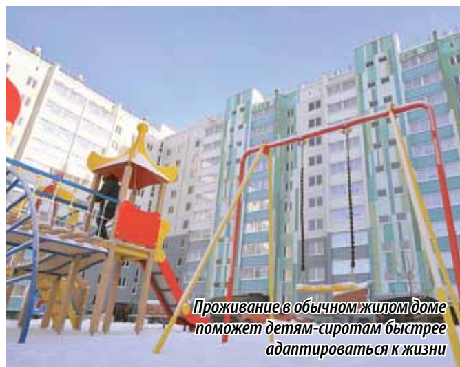
Проживание в обычном жилом доме поможет детям-сиротам быстрее адаптироваться к жизни