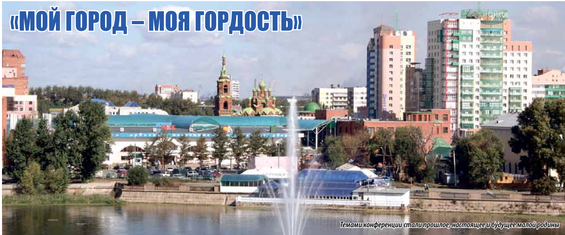
Темами конференции стали прошлое, настоящее и будущее малой родины

НА ПРОШЛОЙ НЕДЕЛЕ ЗАЛ ЗАСЕДАНИЙ ЮЖНОУРАЛЬСКОГО ПАРЛАМЕНТА СТАЛ ПЛОЩАДКОЙ ДЛЯ КОНФЕРЕНЦИИ «МОЙ ГОРОД – МОЯ ГОРДОСТЬ», ГЛАВНЫМИ ДЕЙСТВУЮЩИМИ ЛИЦАМИ КОТОРОЙ СТАЛИ СТУДЕНТЫ И МОЛОДЫЕ УЧЕНЫЕ. ПОДИСКУТИРОВАТЬ НА ЗАЯВЛЕННУЮ ТЕМУ ПРИШЛИ ДЕПУТАТЫ ЗАКОНОДАТЕЛЬНОГО СОБРАНИЯ, РУКОВОДИТЕЛИ ОБРАЗОВАТЕЛЬНЫХ УЧРЕЖДЕНИЙ, ШКОЛ, ОБЩЕСТВЕННЫЕ ДЕЯТЕЛИ, ПРЕДСТАВИТЕЛИ ДУХОВЕНСТВА, ПОЧЕТНЫЕ ГРАЖДАНЕ ЧЕЛЯБИНСКА.