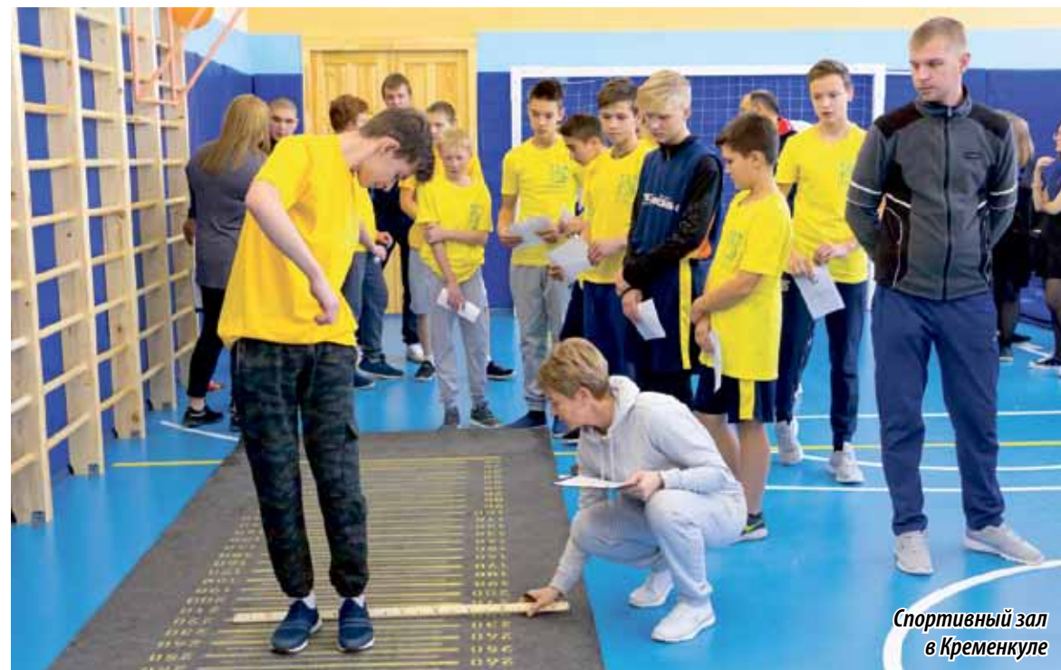
Спортивный зал в Кременкуле