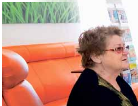
С 2014 года Челябинский центр НИИ неврологии и педиатрии принял

— Инвалидность дочке поставили, когда ей был год и два месяца, — рассказала мама девочки о беде руководителю депутатского корпуса. — С тех пор мы делаем все, чтобы максимально адаптировать дочь к жизни. Поражения у дочки минимальные, и если сейчас в лечение и реабилитацию ребенка вложиться по максимуму, то в будущем она сможет стать полноценным членом общества. Два раза в год министерство здравоохранения Челябинской области выделяет для нашей семьи квоту для лечения в Московском научном центре здоровья детей. После — проходим интенсивный курс реабилитации. В Челябинске необходимая для нас реабилитационная программа есть в одном из коммерческих медицинских центров. Благодаря специалистам центра есть положительные результаты. Но дело в том, что курс