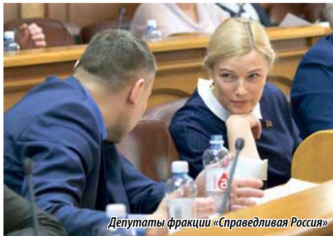
Депутаты фракции «Справедливая Россия»