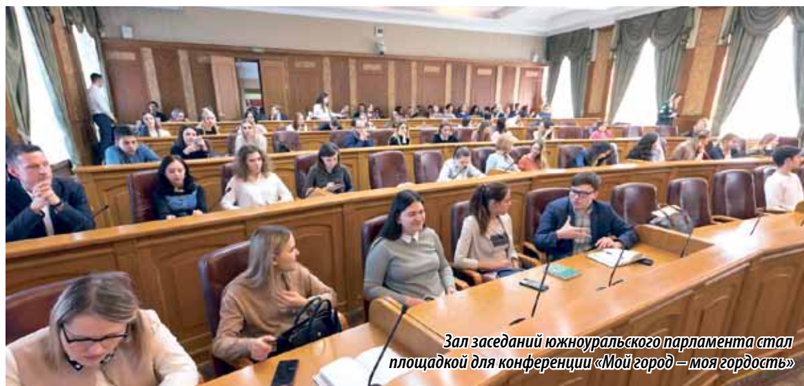
Зал заседаний южноуральского парламента стал площадкой для конференции «Мой город – моя гордость»

« Давно меня интересует молодая научная элита и вообще молодое поколение. Сегодня мы постарались собрать ребят, которые однажды придут нам на смену, и поговорить с ними о построении жизненного пути и профессиональном выборе, поделиться опытом, что получилось или не получилось, почему я остался в родном городе, где родился и вырос. Для молодых людей, которые сейчас стоят на пороге поступления в вуз, мне кажется, это интересно. Все равно им самим выбирать главную дорогу своей жизни, но показать возможные развилки и пути решения проблем – это и есть цель нашей конференции. »