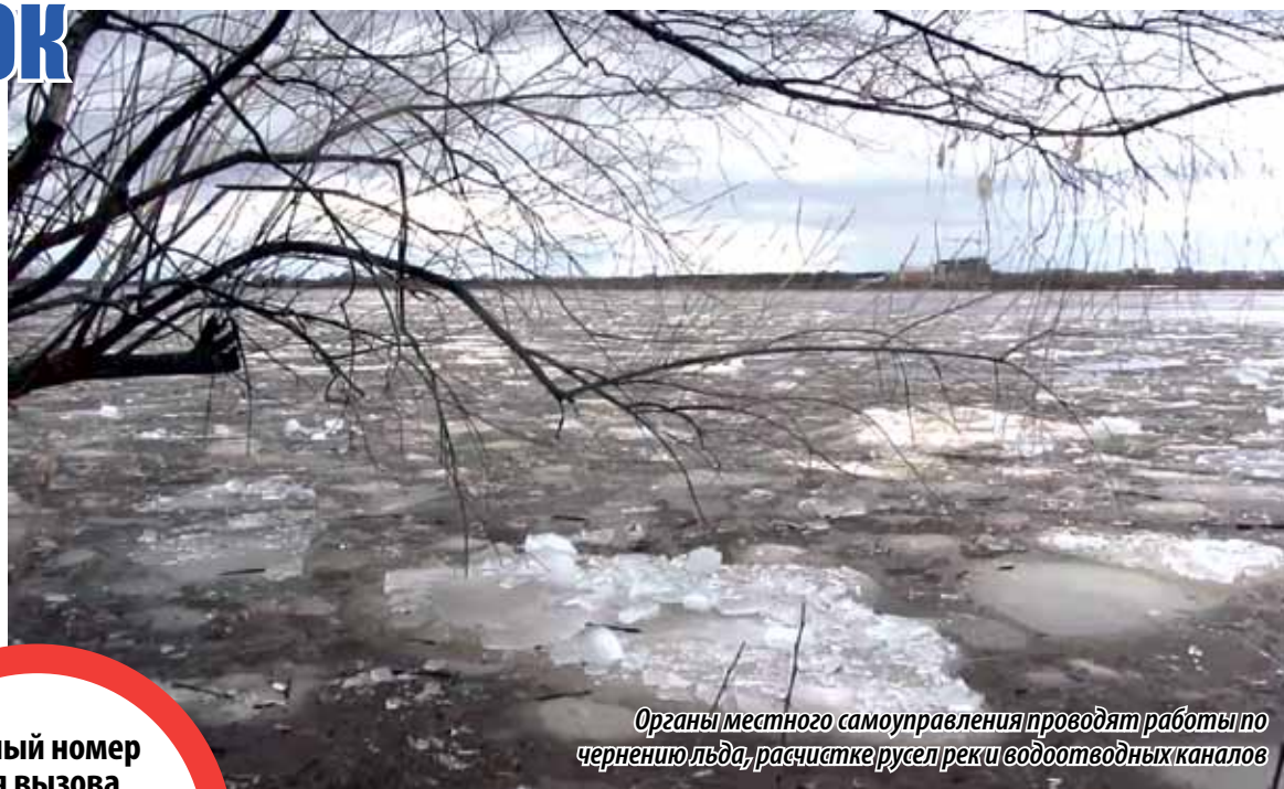
Органы местного самоуправления проводят работы по чернению льда, расчистке русел реки водоотводных каналов

— Кроме сирен оповещения работает система громкоговорителей, правда, сегодня она не покрывает полностью территории населенных пунктов, в части населенных пунктов функционирует СМС-