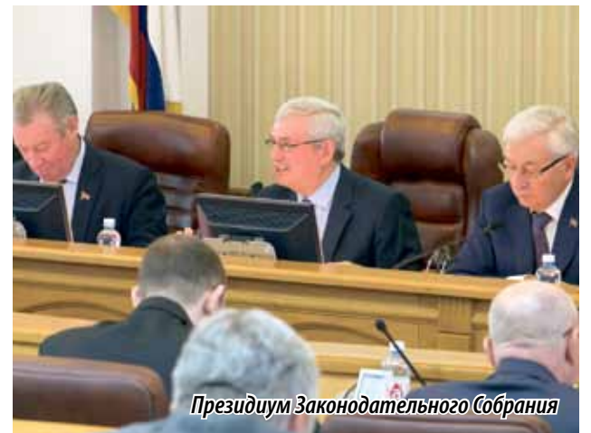
Президиум Законодательного Собрания