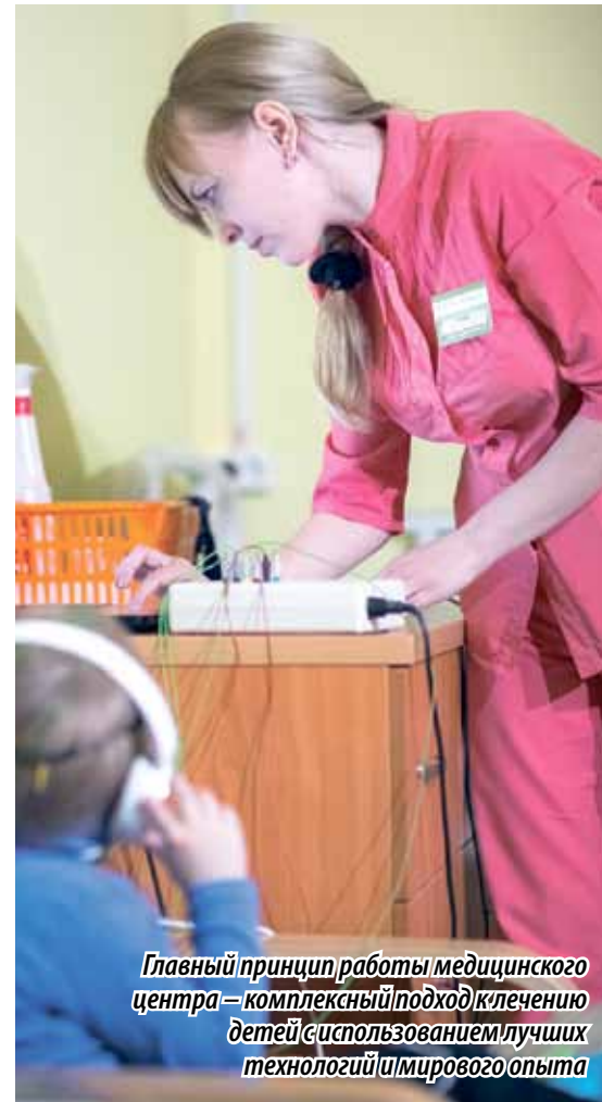
Главный принцип работы медицинского центра — комплексный подход к лечению детей с использованием лучших технологий и мирового опыта

Главный принцип работы медицинского центра — комплексный подход к лечению детей с использованием лучших технологий и мирового опыта. В клинической практике применяются и авторские методики НИИ.