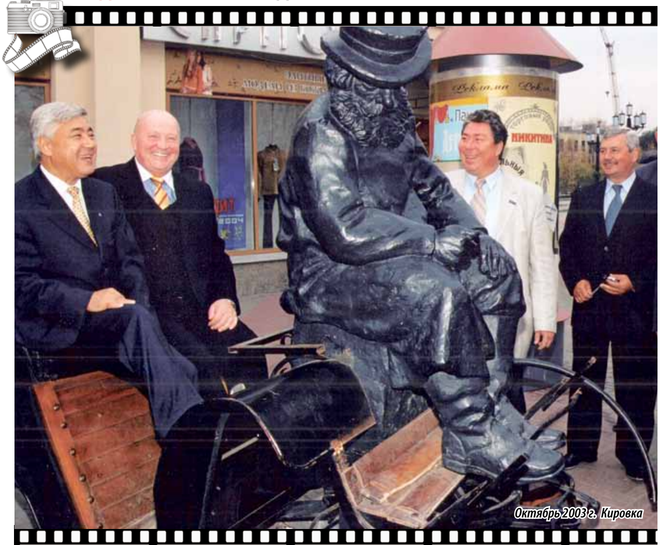
Октябрь 2003г. Кировка