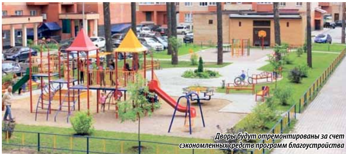
Дворы будут отремонтированы за счет сэкономленных средств программ благоустройства