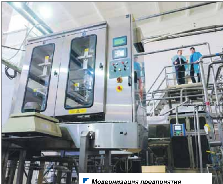
Модернизация предприятия по переработке молока продолжается.

АЛЕКСАНДР ПАТРИТЕЕВ.