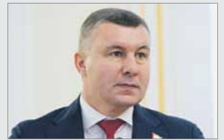
Евгений ИЛЛЕЕ родился 14 апреля.

Единый избирательный округ, председатель комитета Законодательного Собрания по экономической политике и предпринимательству, входит в состав комитета Законодательного Собрания по Регламенту и депутатской этике.