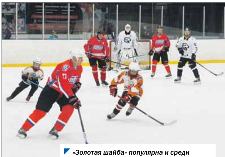
«Золотая шайба» популярна и среди дворовых команд, и среди профессионалов.

В Тракторозаводском районе Челябинска подвели итоги очередного сезона хоккейного турнира «Золотая шайба».