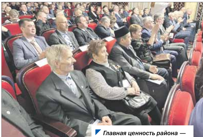
Главная ценность района — его неравнодушные жители.