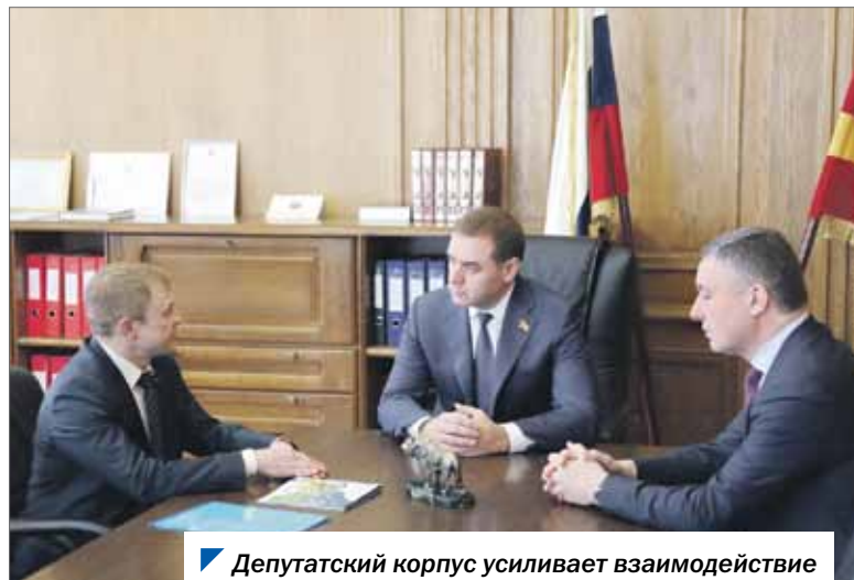
Депутатский корпус усиливает взаимодействие с предпринимательским сообществом.