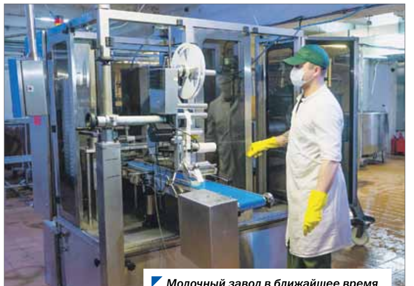
Молочный завод в ближайшее время может увеличить число рабочих мест.

Депутаты Законодательного Собрания продолжат встречи с региональными товаропроизводителями, представителями продовольственных и аптечных торговых сетей в рамках проекта «Народный контроль». Возможные меры поддержки предпринимателей и граждан, основанные на полученной в ходе мониторинга информации, обсуждаются на заседаниях профильных рабочих групп. В случае необходимости «народные контролеры» направляют информацию о завышении цен, отсутствии в продаже социально значимых продуктов и товаров надзорным ведомствам и контролирующим органам.