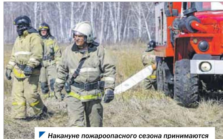
Накануне пожароопасного сезона принимаются в том числе и законодательные меры.

отдыха и оздоровления детей планируется включить в перечень.