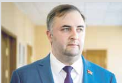
Олег ГЕРБЕР, председатель Законодательного Собрания Челябинской области:

— Одним из главных вопросов августовского заседания стало внесение изменений в закон об областном бюджете. С федерального уровня поступило более 241 миллиона рублей. Кроме того, за счет перераспределения ранее зарезервированных средств бюджета дополнительные деньги пойдут на увеличение фонда оплаты труда работников бюджетной сферы — это более двух миллиардов рублей. Расходы на социальную сферу составляют 70% бюджета. Повестка заседания регионального парламента тоже состояла на 70% из социальных законопроектов.