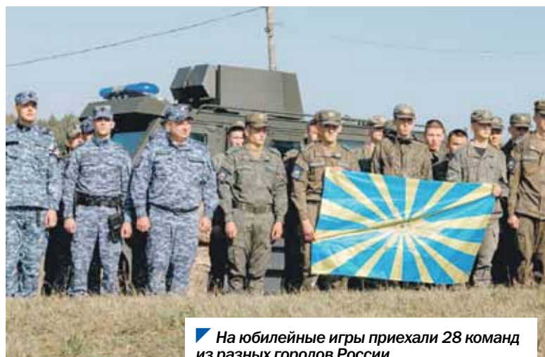
На юбилейные игры приехали 28 команд из разных городов России.

В командном зачете победили и заняли все призовые места (в том числе завоевали и переходящий кубок специальных подразделений Росгвардии) курсанты Челябинского высшего военного авиационного краснознаменного училища штурманов (ЧВВАКУШ).