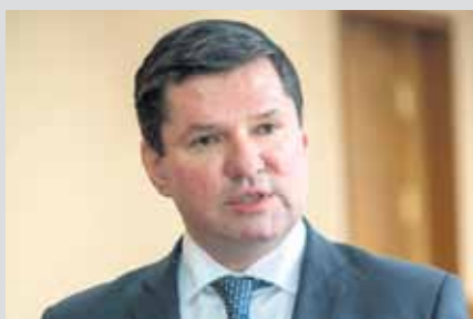
Сергей БУЯКОВ, председатель комитета Законодательного Собрания по социальной политике:

— Одним из главных вопросов августовского заседания стало внесение изменений в закон об областном бюджете. С федерального уровня поступило более 241 миллиона рублей. Кроме того, за счет перераспределения ранее зарезервированных средств бюджета дополнительные деньги пойдут на увеличение фонда оплаты труда работников бюджетной сферы — это более двух миллиардов рублей. Расходы на социальную сферу составляют 70% бюджета. Повестка заседания регионального парламента тоже состояла на 70% из социальных законопроектов.