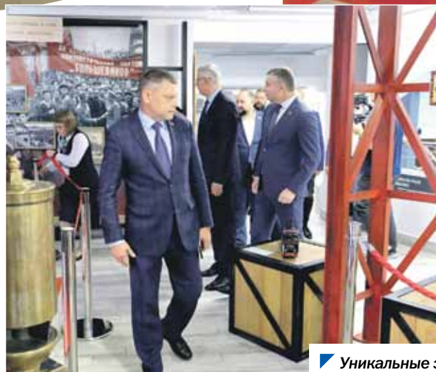
Уникальные экспонаты Центра исторического наследия.