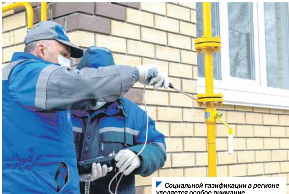
Социальной газификации в регионе уделяется особое внимание.

Депутатский корпус одобрил инициативу главы региона Алексея Текслера об увеличении размера социальной выплаты на приобретение и установку внутридомового газового оборудования до 150 000 рублей. Ранее предельный размер льготы для большинства категорий составлял 100 000 рублей.