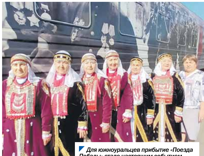
Для южноуральцев прибытие «Поезда Победы» стало настоящим событием.

Передвижная выставка-музей, посвященная Великой Отечественной войне, посещает Челябинскую область не впервые, но всякий раз встречает неподдельный интерес жителей.