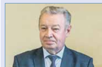
Анатолий БРАГИН, председатель комитета по законодательству, государственному строительству и местному самоуправлению:

Стоит отметить, что ранее на территории Челябинской области размер административного штрафа за безбилетный проезд в общественном транспорте варьировался от 500 до 1500 рублей.