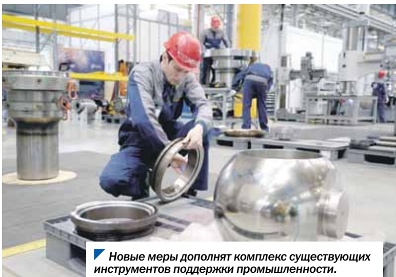
Новые меры дополняют комплекс существующих инструментов поддержки промышленности.