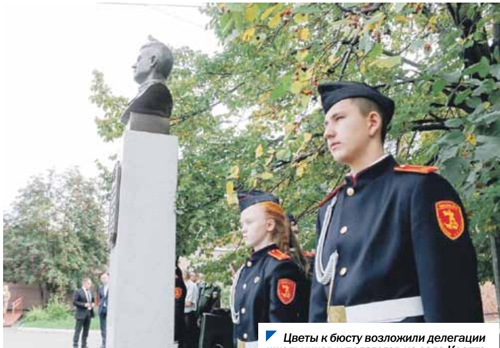
Цветы к бюсту возложили делегации школьников и педагогов из села Коелга.

администрации Тракторозаводского района, различных патриотических организаций, было много детей, родителей и представителей старшего поколения.