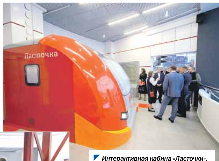
Интерактивная кабина «Ласточки».