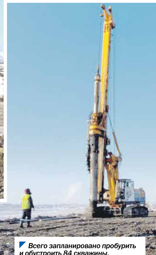
Всего запланировано пробурить и обустроить 84 скважины.

Магнитогорская городская свалка — одна из крупнейших и старейших в Челябинской области. Она активно использовалась с 1957 по 2022 год. За это время отходы накопились на площади более 37,5 гектаров