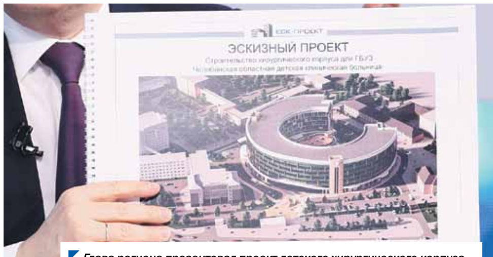
Глава региона презентовал проект детского хирургического корпуса.

Таким образом, мы стали участниками процесса решения вопроса даже до того, как он прозвучал в эфире. Об этом говорил губернатор, завершая прямую линию: проблемные вопросы эффективнее решаются благодаря командной слаженной работе.