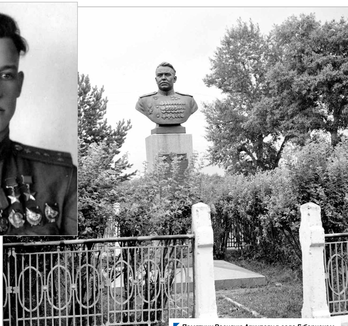
Памятник Василию Архипову в селе Губернском.

«Парламентской недели» и Объединенного государственного архива Челябинской области.