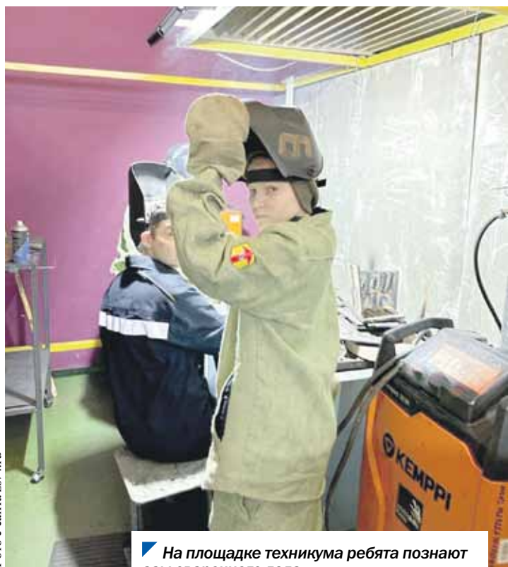
На площадке техникума ребята познают азы сварочного дела.

После встречи со школьниками депутат пригласил их на экскурсию по заводу компании «СМАРТ». Учащиеся и их педагоги познакомились со всеми этапами технологического процесса.