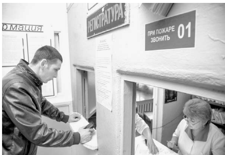
По итогам осмотра лечебных учреждений Кизильского района депутатами дано поручение устранить очереди в поликлиниках.

Активно в районе поддерживают молодых врачей. Для этого здесь разработана целевая программа «Поддержка молодых специалистов здравоохранения Кизильского муниципального района». В прошлом году в район приехали двое молодых врачей — хирург и педиатр. Но районное здравоохранение по-прежнему остро нуждается в терапевте, стоматологе, эндокринологе, педиатре, фтизиатре, онкологе и многих других специалистах.