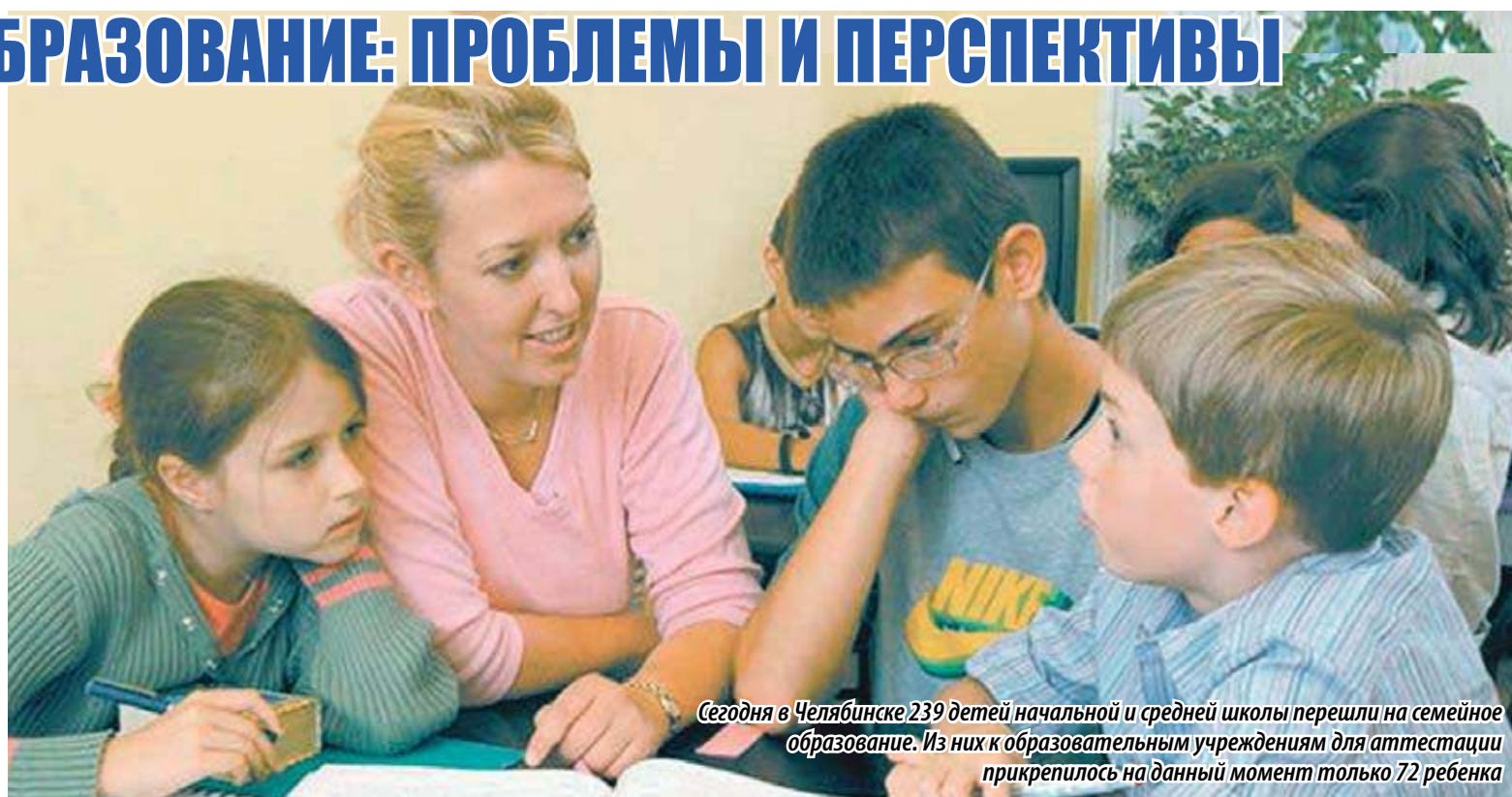
Сегодня в Челябинске 239 детей начальной и средней школы перешли на семейное образование. Из них к образовательным учреждениям для аттестации прикрепилось на данный момент только 72 ребенка

Как сказала уполномоченный по правам человека в Челябинской области Маргарита Павлова, в аппарате уполномоченного сделали свой запрос в регионы и получили 30 ответов. Важно, что многие разделяют идею компенсации. А меру социальной поддержки уже ввели в Свердловской,