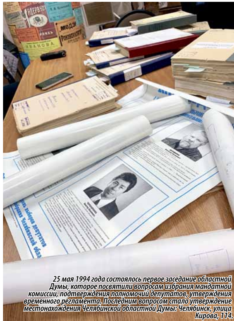
25 мая 1994 года состоялось первое заседание областной Думы, которое посвятили вопросам избрания мандатной комиссии, подтверждения полномочий депутатов, утверждения временного регламента. Последним вопросом стало утверждение местонахождения Челябинской областной Думы: Челябинск, улица Кирова, 114.