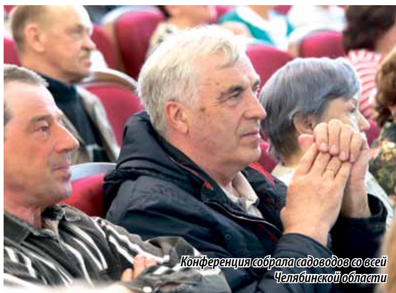
Конференция собрала садоводов со всей Челябинской области

Нет проблем и с транспортной доступностью. До нашего садового товарищества курсирует несколько автобусных маршрутов. »