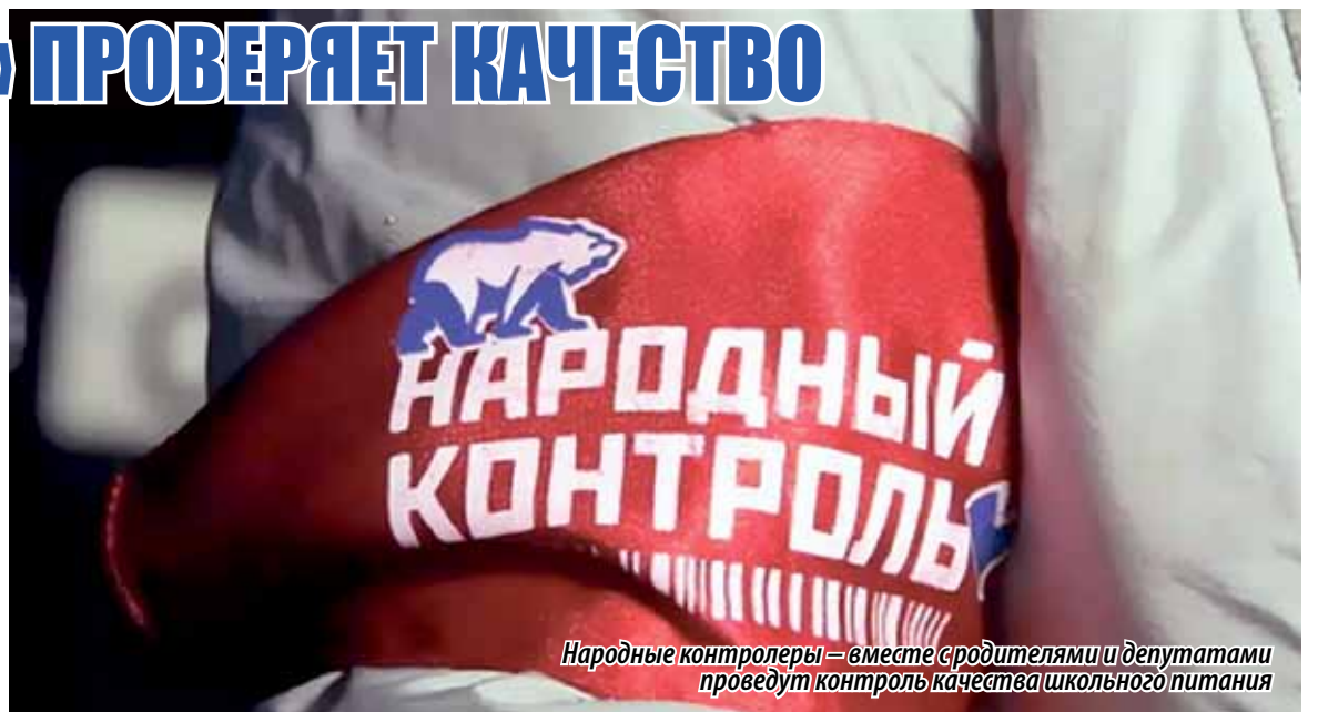
Народные контролеры – вместе с родителями и депутатами проведут контроль качества школьного питания

что им не нравится школьное питание отметили, что невкусно готовят (18%), однообразное питание (14%), готовят нелюбимую пищу (32%), холодная еда (19%), маленькие порции (6%).