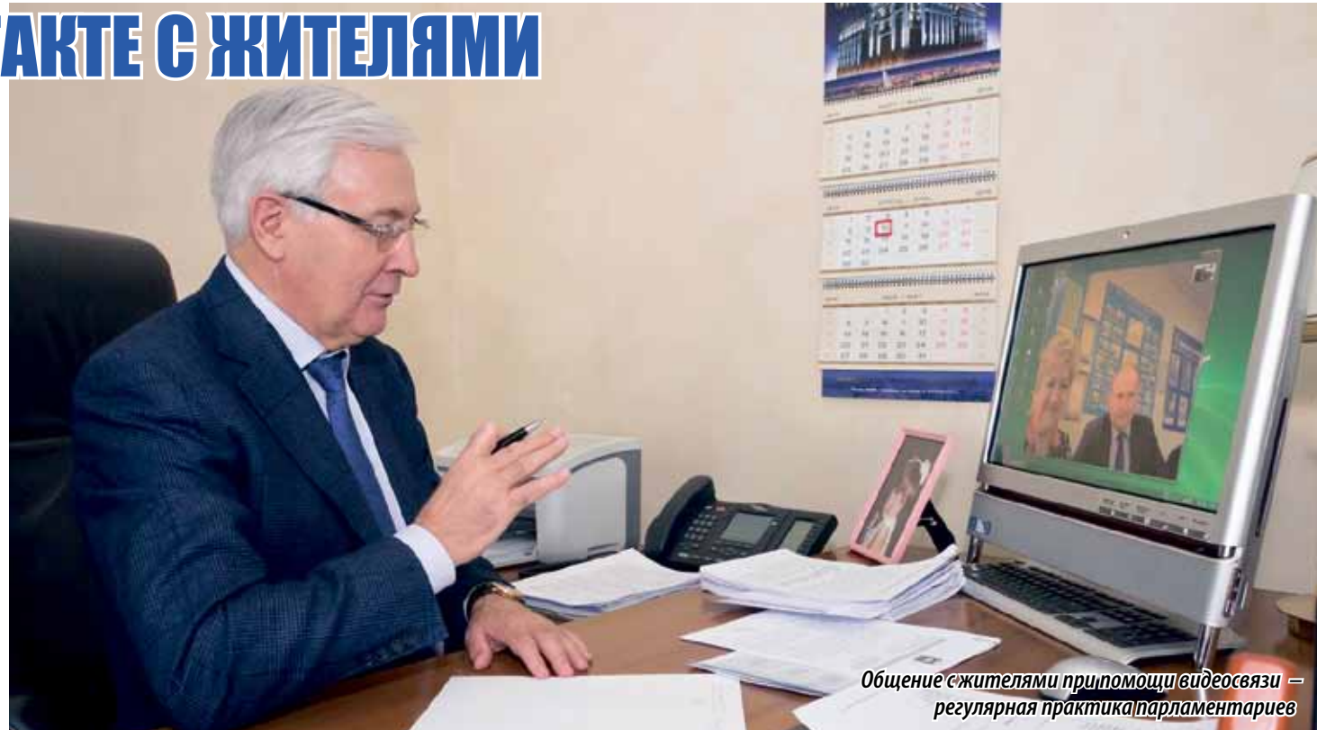
Общение с жителями при помощи видеосвязи – регулярная практика парламентариев

Уточнив, готова ли проектно-сметная документация и есть ли госэкспертиза, первый заме-