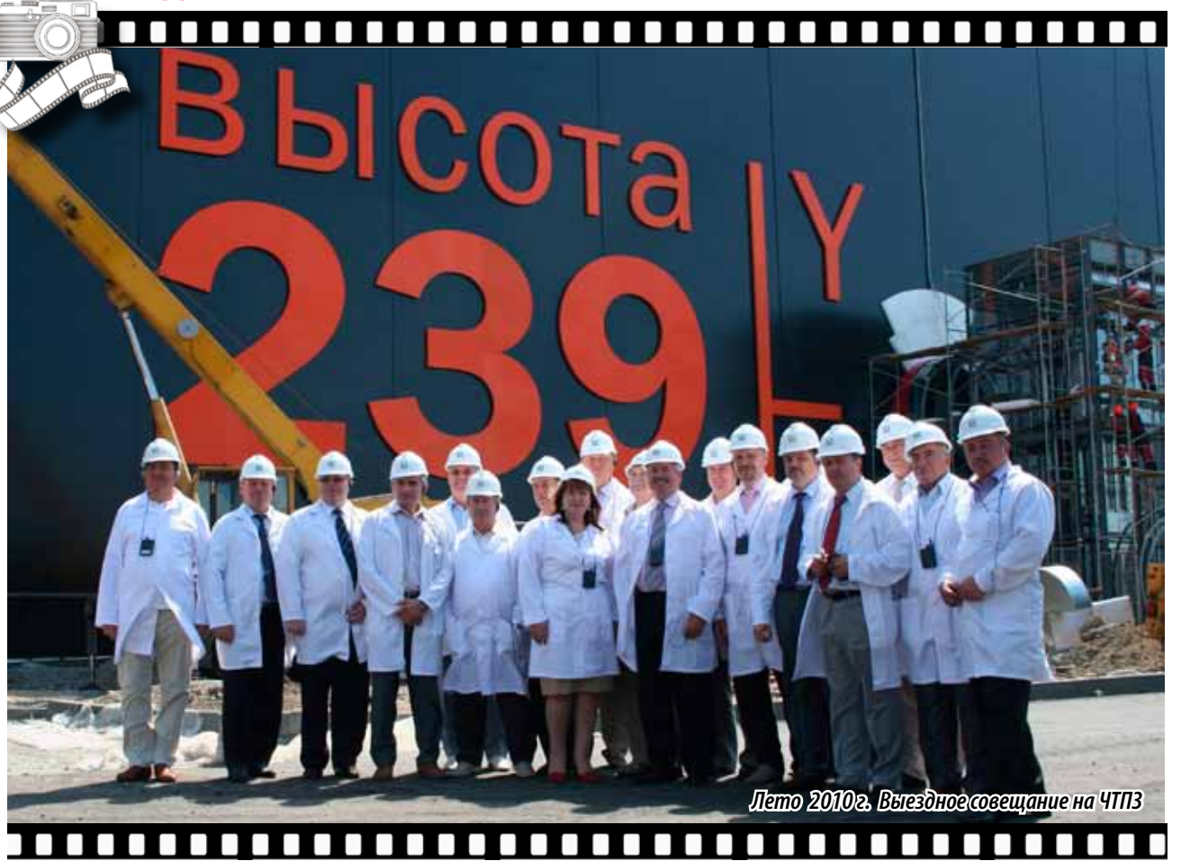
Лето 2010г. Выездное совещание на ЧТПЗ

конодательного Собрания на фото стоят в белых халатах, оставшихся таковыми и после посещения производственной площадки.