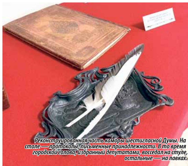
Реконструированная часть каморы шестигласной Думы. На столе — протоколы, письменные принадлежности. В то время городской голова, избранный депутатами, восседал на стуле, остальные — на лавках.