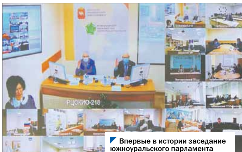
Впервые в истории заседание южноуральского парламента прошло дистанционно.

В рамках ежедневного брифинга губернатор Челябинской области Алексей Текслер анонсировал дополнительные меры социальной поддержки для южноуральцев. В прямом взаимодействии с депутатским корпусом предстояло закрепить инициативы на законодательном уровне. Поэтому, несмотря на режим обязательной самоизоляции, но с соблюдением всех мер предосторожности, было оперативно назначено внеочередное заседание областного парламента. Впервые за всю историю существования Законодательного Собрания Челябинской области оно прошло в формате видеоконференции, организованной на площадке регионального центра оценки качества и информатизации образования. Спикер парламента Владимир Мякуш (фракция «Единая Россия») и его заместители находились в студии центра, депутаты — в удаленных студиях в муниципалитетах.