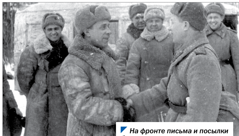
На фронте письма и посылки были долгожданными.

Челябинская делегация привезла с фронта благодарности командования в адрес обкома партии, предприятий, колхозов, письма родным и близким от бойцов и командиров, даже стихи рабочим.