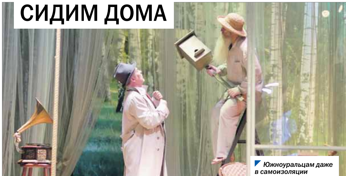
Южноуральцам даже в самоизоляции не дадут заскучать.

Российские театры не оставили своих зрителей в самоизоляции, транслируя в режиме онлайн любимые и новые спектакли. Поддержали проект и театры Челябинской области. Теперь на официальном сайте Областного телевидения 1obl.tv в разделе «Online-театр» можно увидеть лучшие южноуральские постановки абсолютно бесплатно.