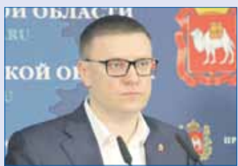
Алексей ТЕКСЛЕР, губернатор Челябинской области:

/// Пик эпидемии еще не пройден, поэтому президент продлил нерабочие дни до 30 апреля. Этот срок может быть сокращен, но это зависит только от нас с вами. Это трудное время, но мы пройдем эту ситуацию вместе, рука об руку. Мы поддержим наше старшее поколение, поддержим мам, которые самостоятельно воспитывают детей, поддержим тех, кто в силу обстоятельств оказался в непростой жизненной ситуации, без гарантированного дохода. Мы справимся с коронавирусом, а затем и с его последствиями. ///