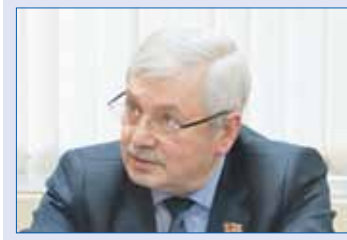
Владимир МЯКУШ, председатель Законодательного Собрания Челябинской области (фракция «Единая Россия»):

/// На внеочередном заседании Собрания, которое впервые мы провели в дистанционном формате, мы рассмотрели антикризисный пакет законопроектов, направленных на поддержку населения и предпринимательства в нашем регионе, которые были разработаны областным правительством во главе с губернатором Алексеем Текслером. В частности, приняли закон по новому виду поддержки — инвестиционному налоговому кредиту. Это еще один финансовый рычаг помощи организациям и индивидуальным предпринимателям в столь непростой ситуации. За счет возможности уплатить налог в более поздний срок предприниматели смогут направить деньги на поддержку своего бизнеса. ///