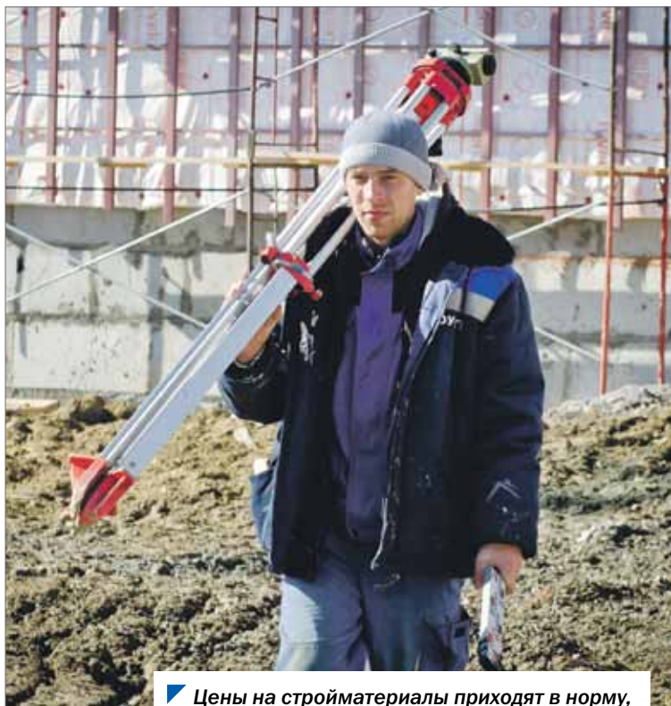
Цены на стройматериалы приходят в норму, но отрасль по-прежнему требует внимания.