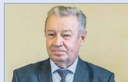
Анатолий БРАГИН, председатель комитета Законодательного Собрания по законодательству, государственному строительству и местному самоуправлению:

С 1 июня 2022 года все депутаты Законодательного Собрания будут замещать государственные должности в Челябинской области. Этим определяется статусное положение депутатов. Но это же влечет за собой и определенные обязанности.