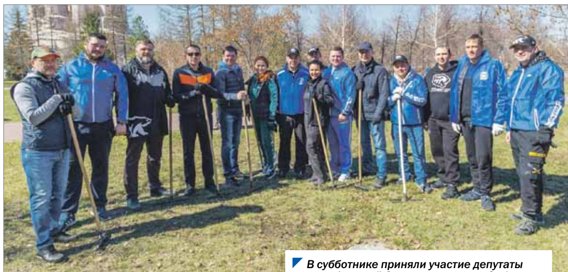
В субботнике приняли участие депутаты разных фракций Законодательного Собрания.

Субботник на Алом поле — это: более 1500 кв. м территории; свыше 100 участников; порядка 250 единиц инвентаря; более 200 мешков для мусора.