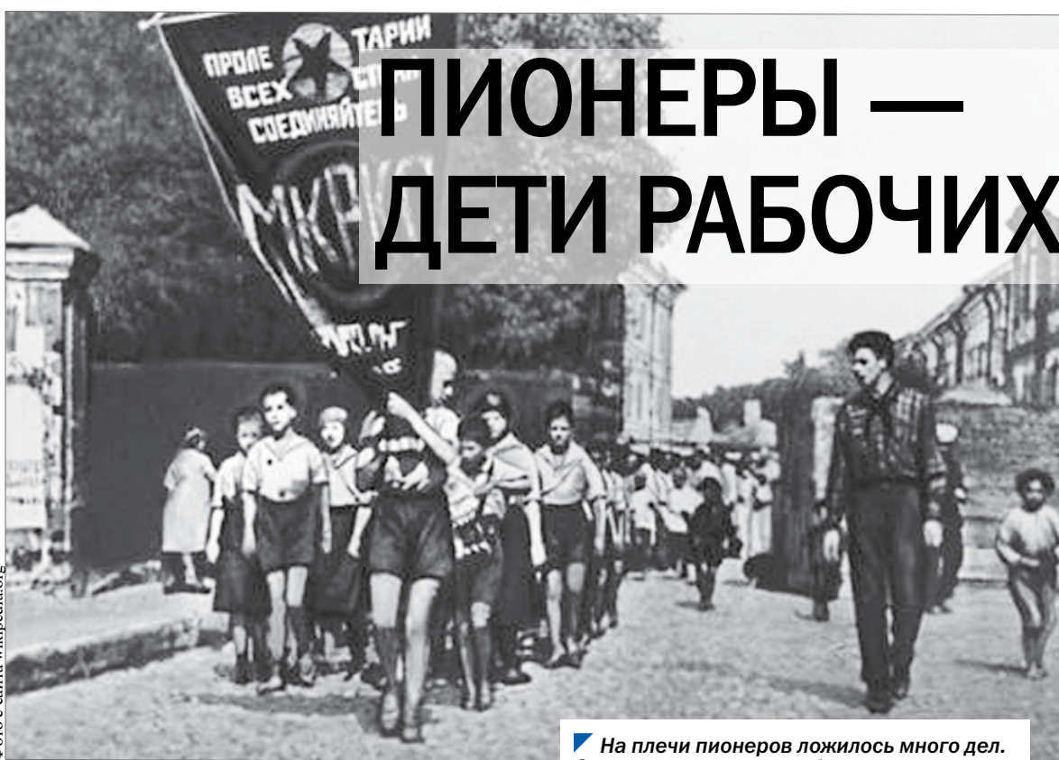
На плечи пионеров ложилось много дел. Одно из них — помощь беспризорникам.

В Петропавловске пионеры побывали на экскурсии на консервном комбинате. Рабочие встретили их как своих