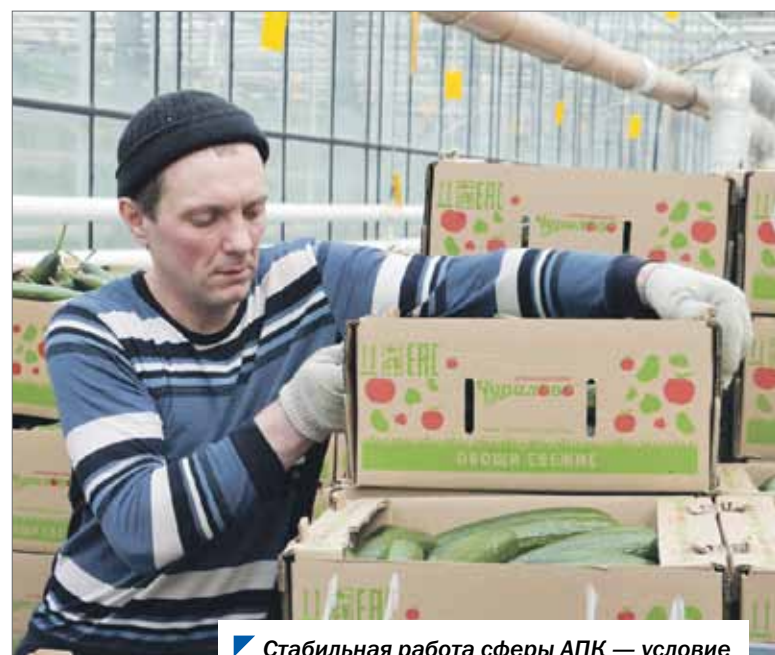
Стабильная работа сферы АПК — условие продовольственной безопасности региона.

Меры поддержки сельхозтоваропроизводителей, столкнувшихся с трудностями из-за антироссийских санкций, обсудили на комитете по аграрной политике. Депутаты выяснили, получают ли предприятия АПК достаточную помощь в сложившейся ситуации.