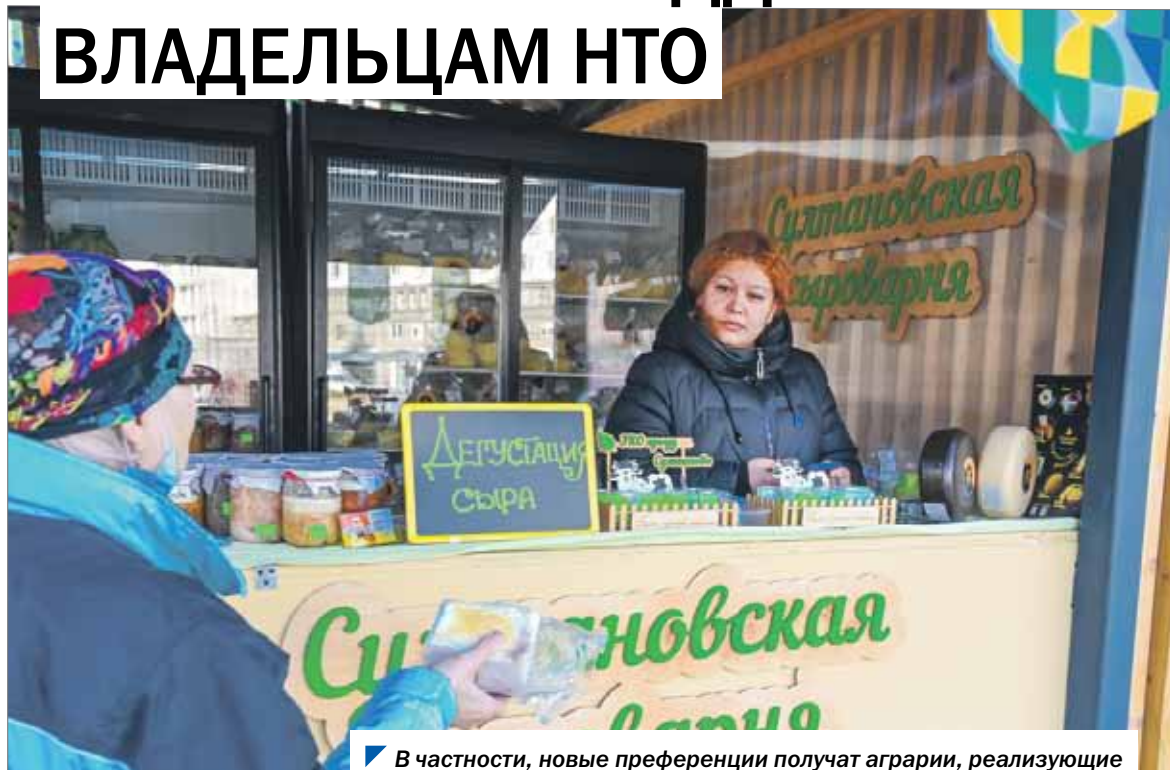
В частности, новые преференции получают аграрии, реализующие свою продукцию через нестационарные торговые объекты.