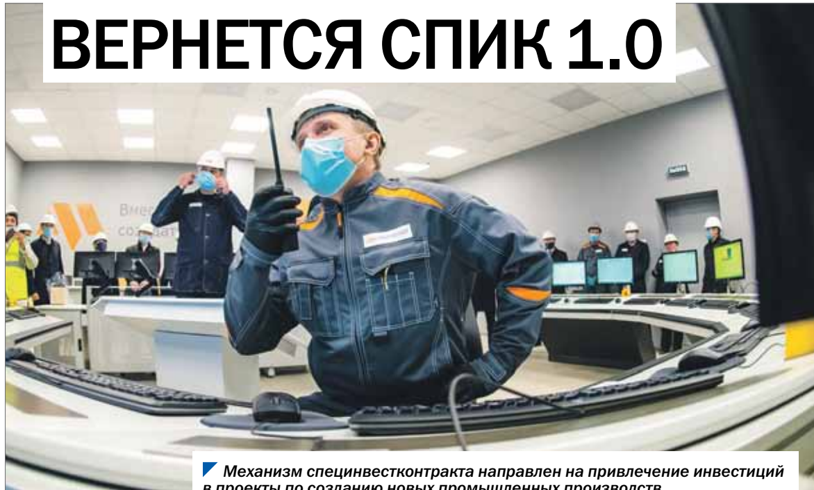
Механизм специнвестконтракта направлен на привлечение инвестиций в проекты по созданию новых промышленных производств.

В ближайшее время в Челябинской области вернут в действие механизм, при котором специальные инвестиционные контракты, направленные на создание или модернизацию промышленных производств, заключаются только между двумя сторонами — инвестором и регионом без участия федерального центра.