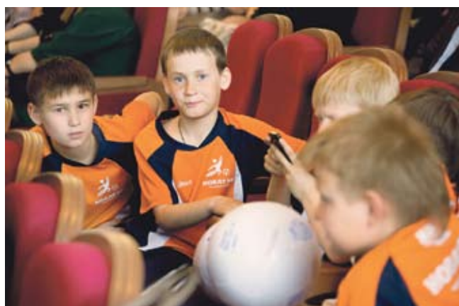
Конкурс «Меняющие мир» уже 12 лет поддерживает тех, кто оказывает благотворительную помощь детям.