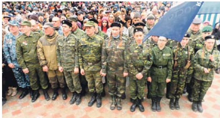
Юные челябинские поисковики готовы к новой экспедиции на войну.

Первые поисковые экспедиции по розыску без вести пропавших южноуральцев в годы Великой Отечественной войны в Челябинской области были организованы в 1989 году.