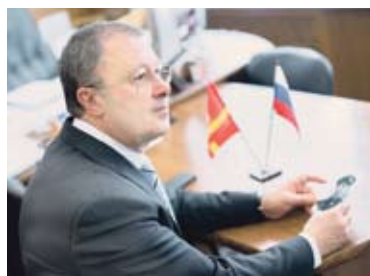
Семен Мительман, председатель комитета по законодательству, государственному строительству и местному самоуправлению Законодательного Собрания (фракция «Единая Россия»):

— Всего у бабушки (по маме) было четверо детей, двое из которых мальчики.