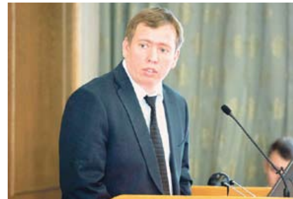
На очередном заседании депутатского корпуса омбудсмен доложил о своей деятельности за прошлый год.