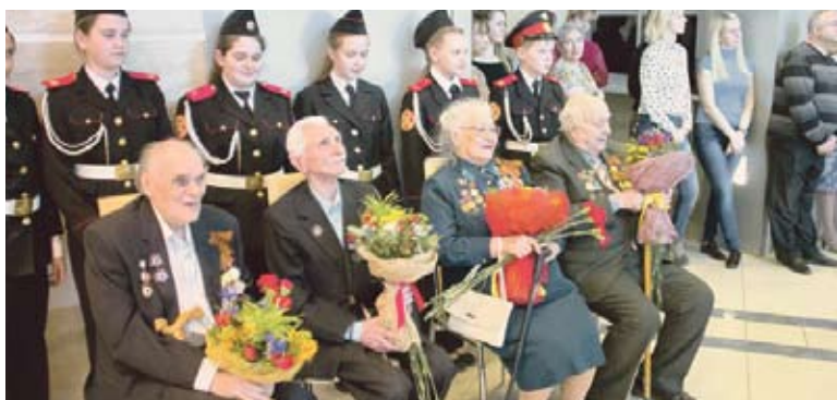
Гости выставки — ветераны Великой Отечественной.