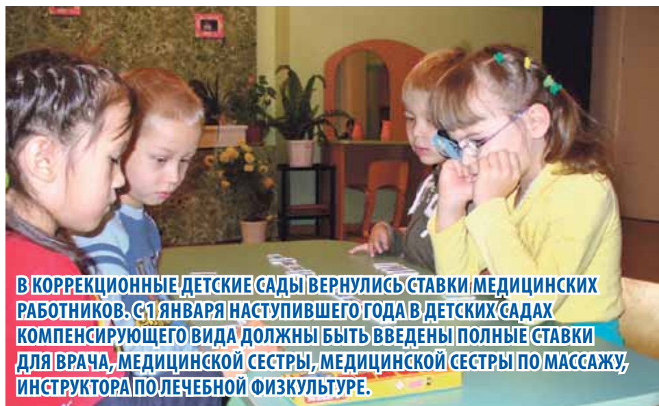
В КОРРЕКЦИОННЫЕ ДЕТСКИЕ САДЫ ВЕРНУЛИСЬ СТАВКИ МЕДИЦИНСКИХ РАБОТНИКОВ. С 1 ЯНВАРЯ НАСТУПИВШЕГО ГОДА В ДЕТСКИХ САДАХ КОМПЕНСИРУЮЩЕГО ВИДА ДОЛЖНЫ БЫТЬ ВВЕДЕНЫ ПОЛНЫЕ СТАВКИ ДЛЯ ВРАЧА, МЕДИЦИНСКОЙ СЕСТРЫ, МЕДИЦИНСКОЙ СЕСТРЫ ПО МАССАЖУ, ИНСТРУКТОРА ПО ЛЕЧЕБНОЙ ФИЗИКУЛЬТУРЕ.

С этого года в Челябинской области решено активно стимулировать развитие меценатской деятельности. Для этого учреждено звание «Почетный меценат Челябинской области». Оно будет присуждаться тем гражданам, которые оказали меценатскую поддержку на сумму не менее трех миллионов рублей в течение трех лет. Присвоение звания будет сопровождаться вручением нагрудного знака и удостоверения.