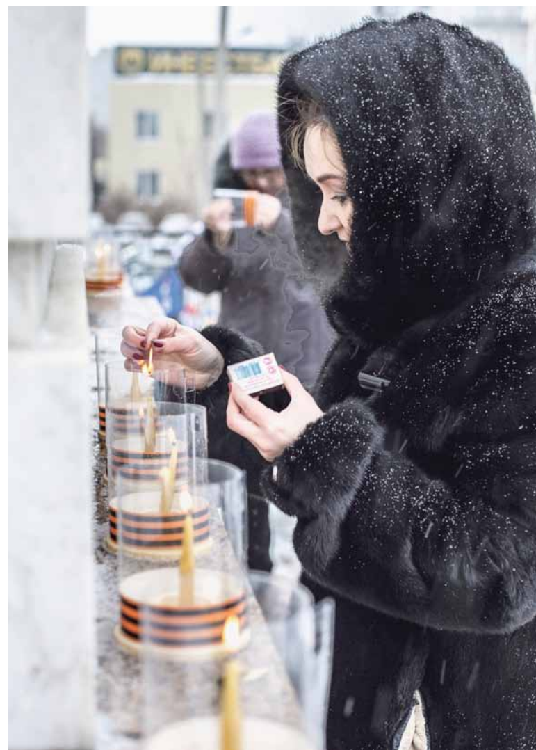
Собираются у памятника на Ленинградском мосту в Челябинске в День снятия блокады Ленинграда стало традицией

— Ремонт и модернизация муниципальных домов культуры будут продолжены и в наступившем году, —