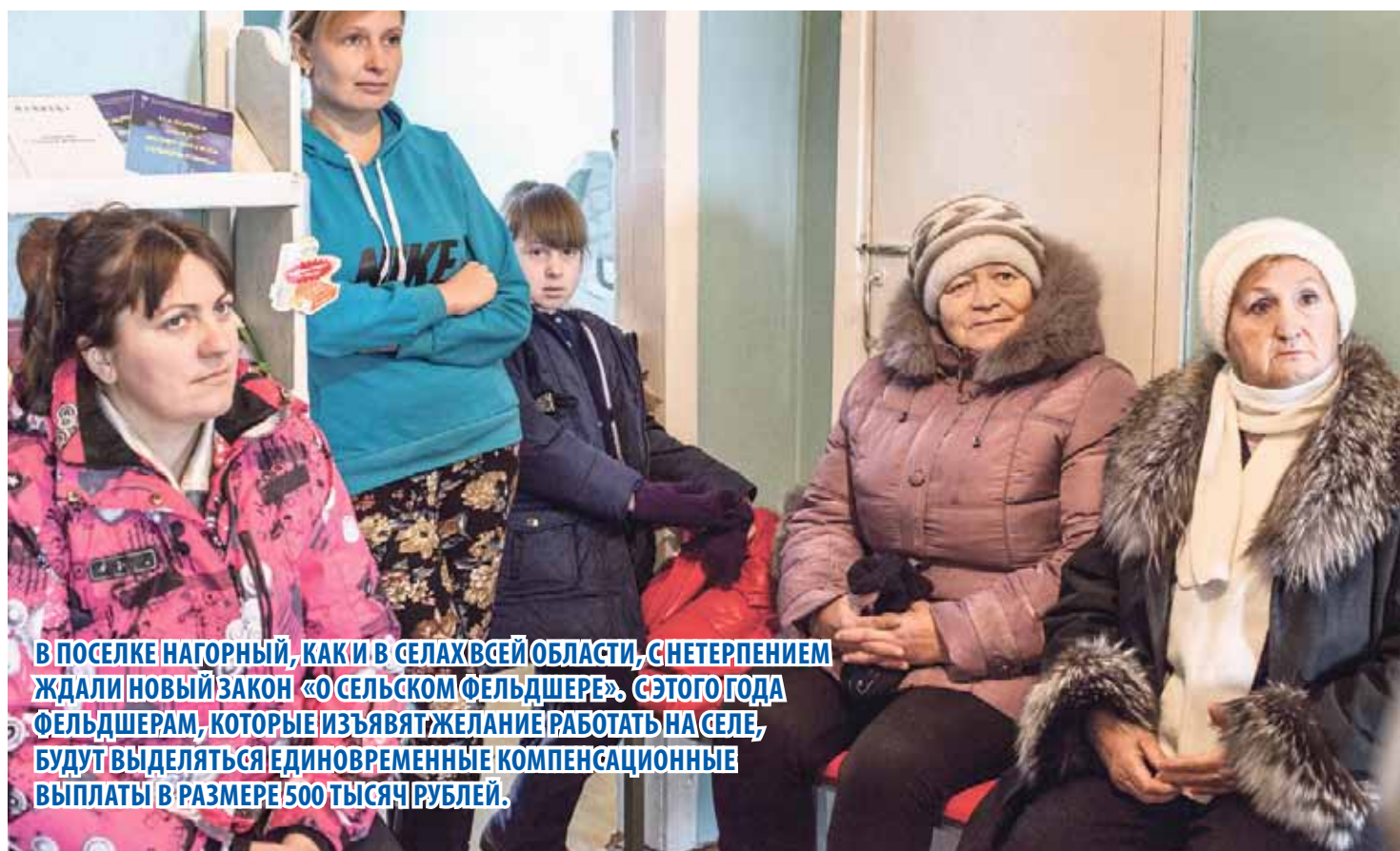
В ПОСЕЛКЕ НАГОРНЫЙ, КАК И В СЕЛАХ ВСЕЙ ОБЛАСТИ, С НЕТЕРПЕНИЕМ ЖДАЛИ НОВЫЙ ЗАКОН «О СЕЛЬСКОМ ФЕЛЬДШЕРЕ». С ЭТОГО ГОДА ФЕЛЬДШЕРАМ, КОТОРЫЕ ИЗЪЯВЛЯЮТ ЖЕЛАНИЕ РАБОТАТЬ НА СЕЛЕ, БУДУТ ВЫДЕЛЯТЬСЯ ЕДИНОВРЕМЕННЫЕ КОМПЕНСАЦИОННЫЕ ВЫПЛАТЫ В РАЗМЕРЕ 500 ТЫСЯЧ РУБЛЕЙ.