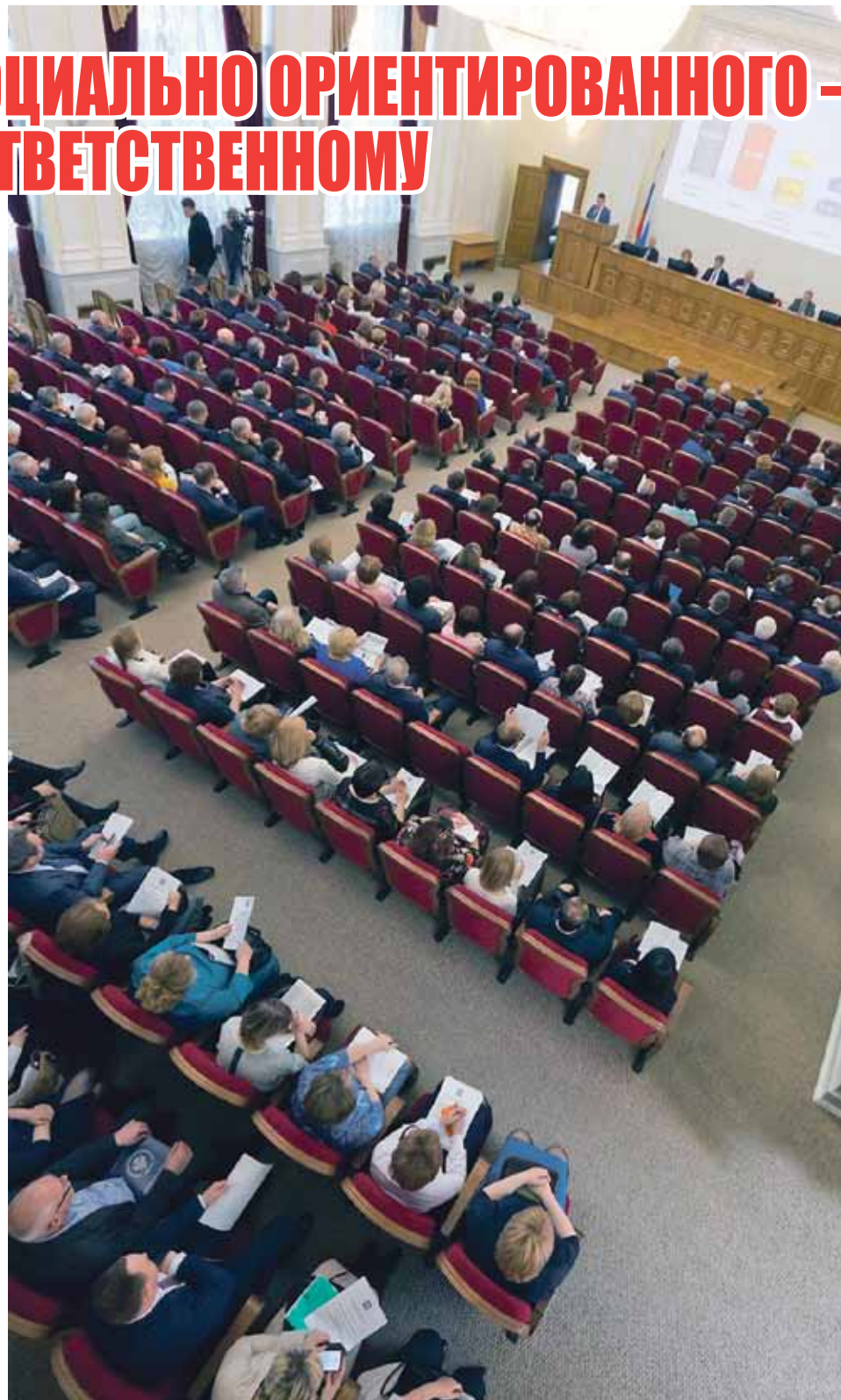
На публичных слушаниях: лучше один раз услышать, как исполнялся бюджет

Общий объем расходов бюджета Челябинской области в прошлом году составил 156 811,2 млн рублей (98,5% от плана).