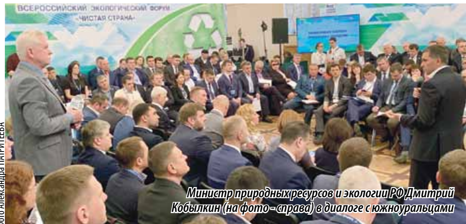
Министр природных ресурсов и экологии РФ Дмитрий Кобылкин (на фото – справа) в диалоге с южноуральцами

– Когда у регоператора по обращению с от-