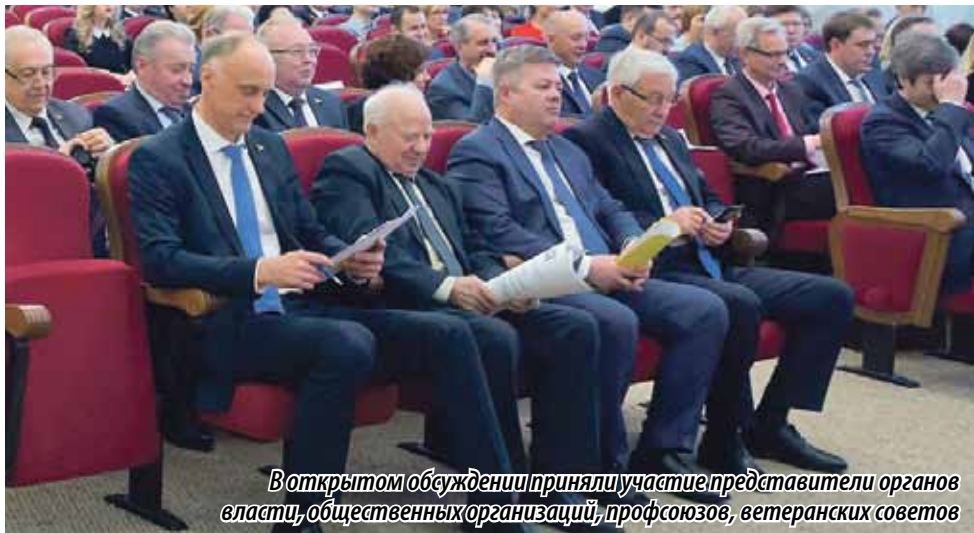
В открытом обсуждении приняли участие представители органов власти, общественных организаций, профсоюзов, ветеранских советов