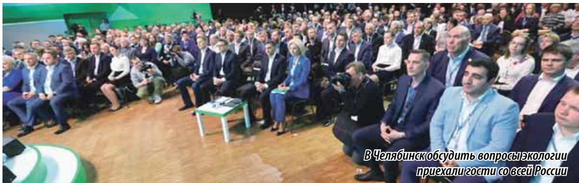
В Челябинске обсудить вопросы экологии приехали гости со всей России

«В ходе форума были озвучены самые разные вопросы, которые касались качества воды, выбросов в атмосферный воздух, обращения с отходами. Эти и другие проблемы волнуют всех жителей страны, но большинство проблем возникает из-за отсутствия коммуникации с людьми. Вся информация должна быть доступна гражданам, более того, нужна постоянная дискуссия, с людьми необходимо советоваться, а не принимать решения кулуарно. И этот форум направлен на обсуждение всех инициатив. Резолюция, которая принята по итогам нашей работы, будет представлена главе федерального правительства Дмитрию Медведеву. Уверен, что озвученные предложения станут основой поручений правительству.»