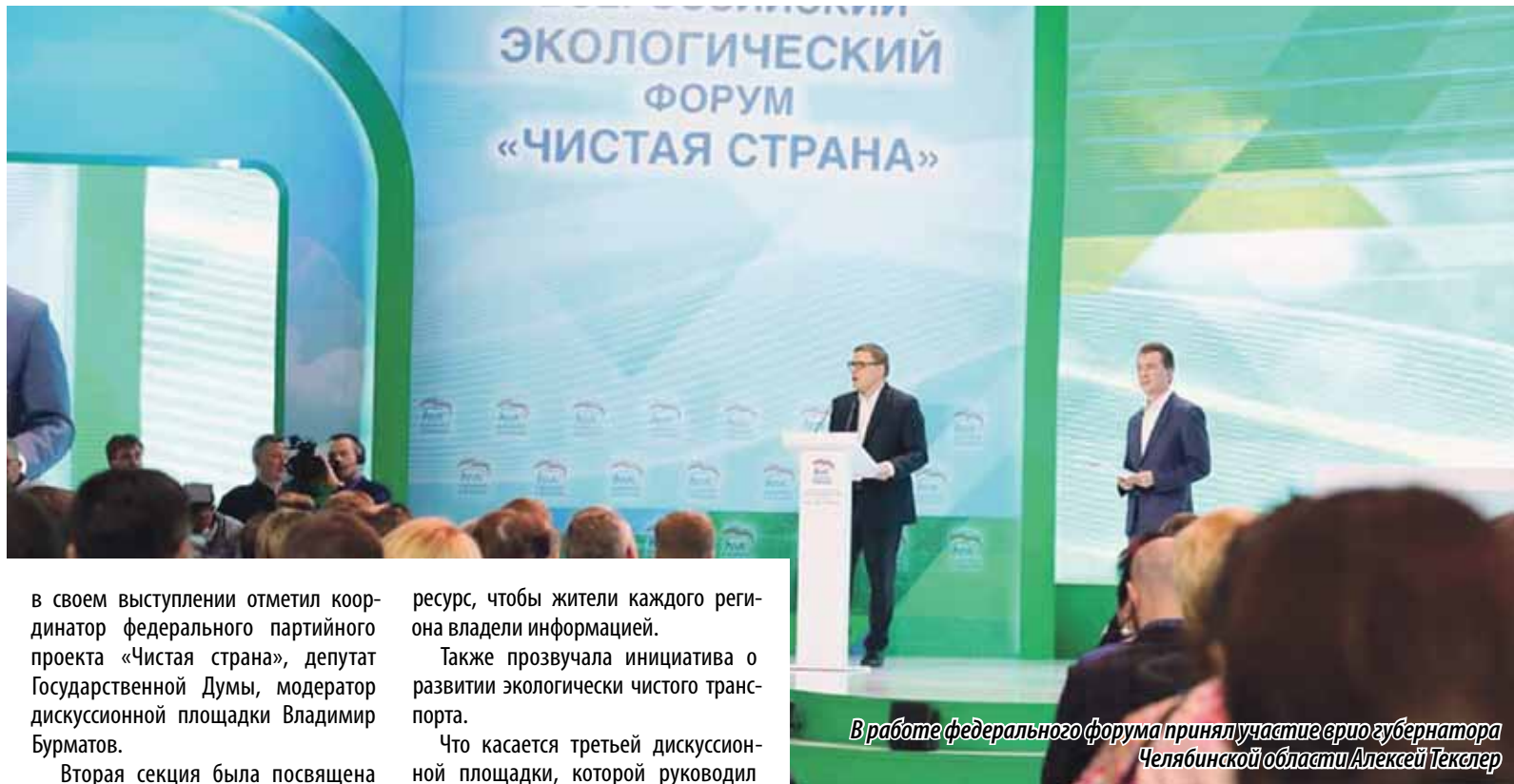
В работе федерального форума принимают участие врио губернатора Челябинской области Алексей Текслер

В КОНЦЕ ПРОШЛОЙ НЕДЕЛИ ЧЕЛЯБИНСК ПРИНИМАЛ ПЕРВЫЙ ВСЕРОССИЙСКИЙ ЭКОЛОГИЧЕСКИЙ ФОРУМ «ЧИСТАЯ СТРАНА». СО ВСЕЙ СТРАНЫ В СТОЛИЦУ ЮЖНОГО УРАЛА СЪЕХАЛИСЬ ПРЕДСТАВИТЕЛИ ФЕДЕРАЛЬНЫХ МИНИСТЕРСТВ, РЕГИОНОВ, ПРОМЫШЛЕННЫХ ПРЕДПРИЯТИЙ, ОБЩЕСТВЕННИКИ, ЭКОЛОГИ, ЭКСПЕРТЫ. В ХОДЕ МАСШТАБНОГО ОБСУЖДЕНИЯ ЭКОЛОГИЧЕСКИХ ПРОБЛЕМ СОСТОЯЛСЯ ОБМЕН МНЕНИЯМИ, ПРОЗВУЧАЛИ ПРЕДЛОЖЕНИЯ, РЕАЛИЗАЦИЯ КОТОРЫХ ПОЗВОЛИТ ИЗМЕНИТЬ СИТУАЦИЮ В ЛУЧШУЮ СТОРОНУ.