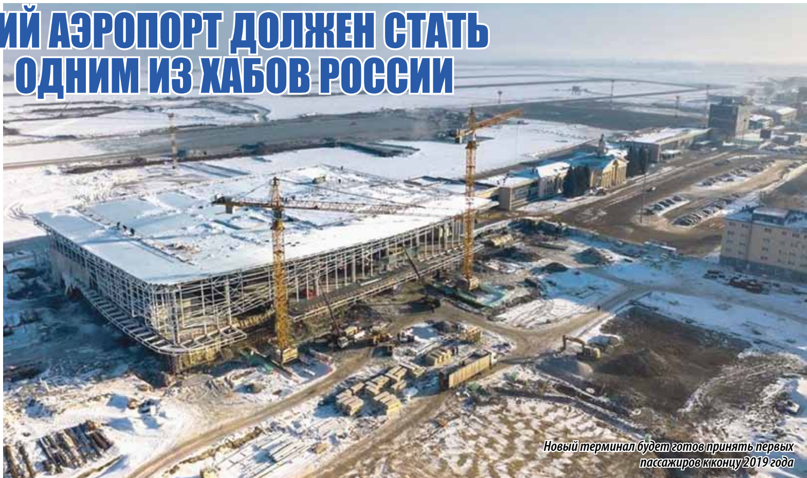
Новый терминал будет готов принять первых пассажиров к концу 2019 года

В 2018 году для возмещения затрат авиационным предприятиям, осуществляющим регулярные региональные и международные перевозки пассажиров, бюджетом Челябинской области были предусмотрены субсидии по ряду направлений. Кроме того, с октября прошлого года в качестве