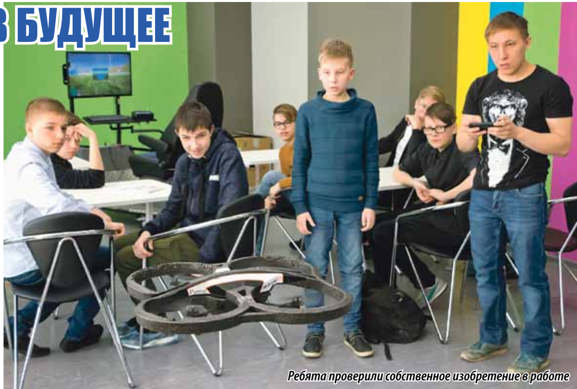
Ребята проверили собственное изобретение в работе

На сегодняшний день на Южном Урале в учреждениях допобразования занимаются 74,4 процента детей от 5 до 18 лет. К 2024 году этот показатель планируется довести до 80 процентов.