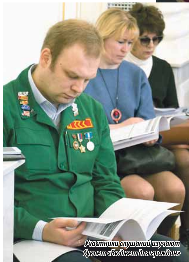
Участники слушаний изучают буклет «Бюджет для граждан»