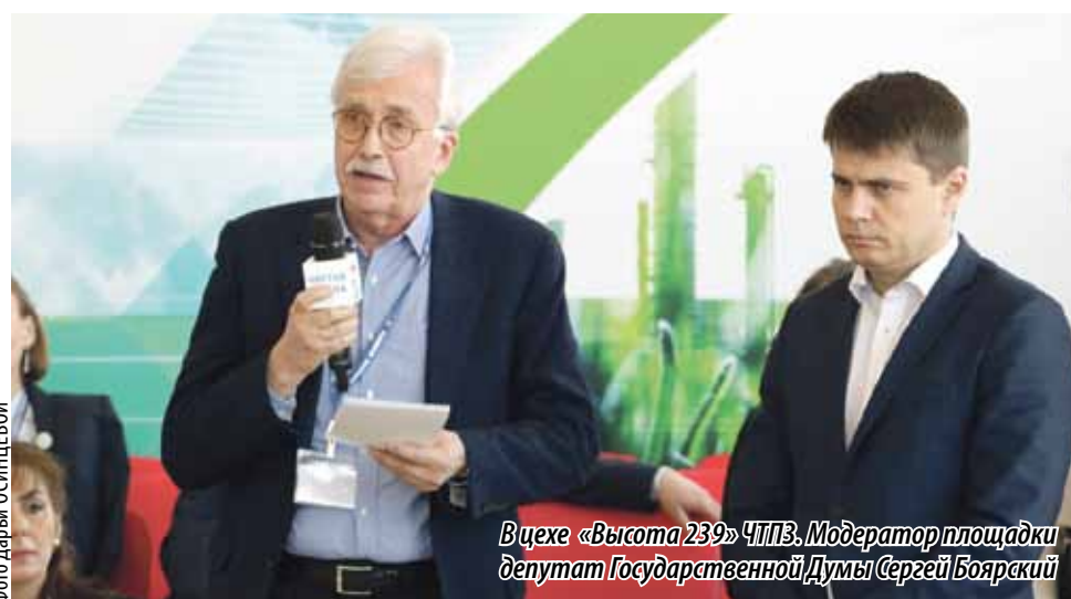
В цехе «Высота 239» ЧТПЗ. Модератор площадки депутат Государственной Думы Сергей Боярский

Добавим, что в ходе работы дискуссионной