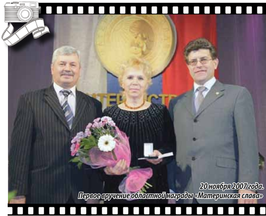
20 ноября 2007 года. Первое вручение областной награды «Материнская слава»

ные матери, имеющие пять и более детей. В 2007 году состоялось первое вручение высоких областных наград 40 многодетным матерям из разных городов и районов Южного Урала. На церемонию награждения их пригласили вместе со всеми своими детьми. Вскоре депутаты приняли еще один закон – «О знаке отличия Челябинской области «Семейная доблесть», в целях повышения общественного престижа родительского труда.