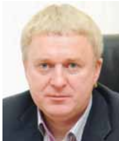
Олег ДУБРОВИН , председатель Общественной палаты Челябинской области:

Что касается сферы образования, в 2018 году в районе была капитально отремонтирована школа, преобразилось несколько детских садов. Жители видят, что, действительно, происходят качественные изменения во многих сферах. »