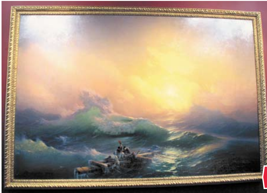
Председатель Законодательного Собрания Челябинской области Владимир Мякуш посетил открытие выставки из цикла «Шедевры Русского музея» в Сатке. На выставке представлена знаменитая картина Ивана Айвазовского «Девятый вал».