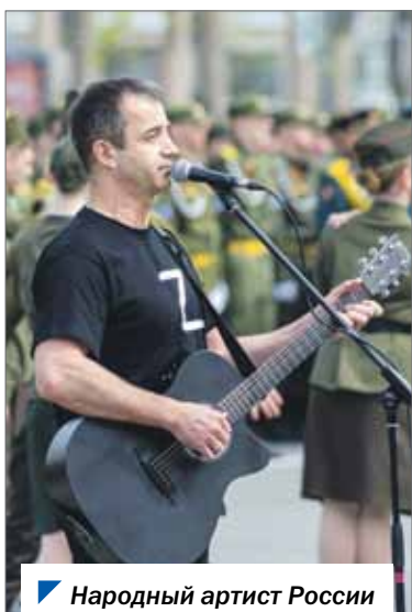
Народный артист России Дмитрий Певцов.