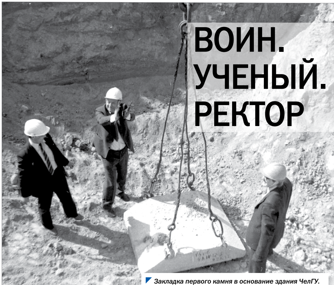
Закладка первого камня в основание здания ЧелГУ.

Сегодня доступны награжденные документы С.Е. Матушкина: «Работая за техника звена, относясь к своим обязанностям со всей серьезностью, возложенной