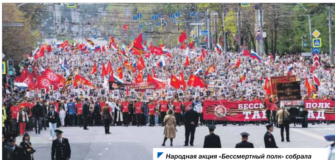
Народная акция «Бессмертный полк» собрала в этом году в Челябинске около 120 тысяч жителей.