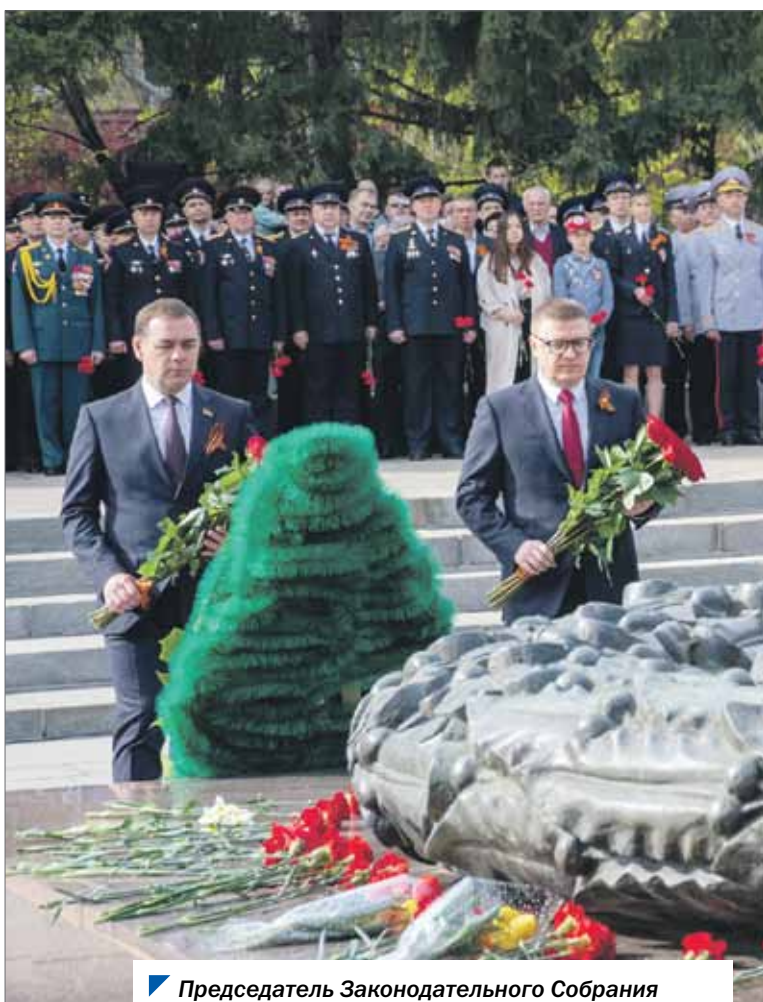
Председатель Законодательного Собрания Александр Лазарев и губернатор Алексей Текслер.