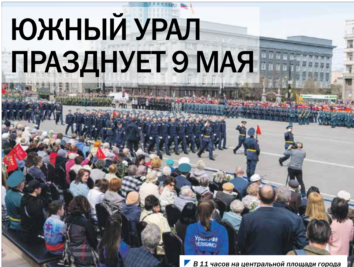
В 11 часов на центральной площади города началось торжественное построение.