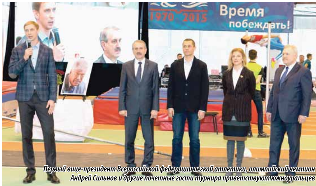
Первый вице-президент Всероссийской федерации легкой атлетики, олимпийский чемпион Андрей Сильнов и другие почетные гости турнира приветствуют южноуральцев