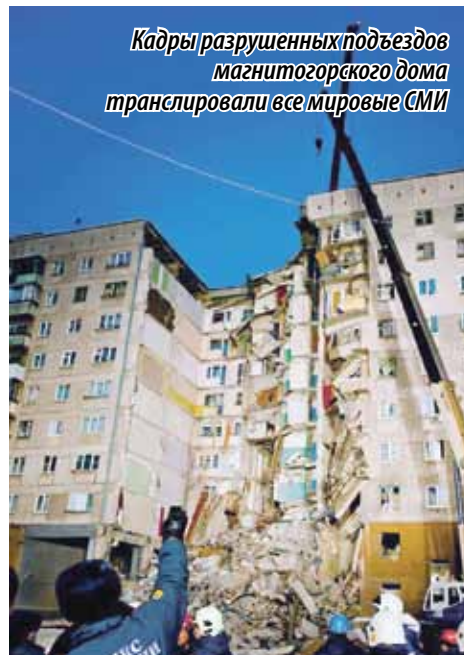
Кадры разрушенных подъездов магнитогорского дома транслировали все мировые СМИ

Все – от поваров полевых кухонь до первых лиц региона и страны – это испытание прошли. В первую очередь была организована работа оперативных штабов всех служб: управлений МЧС Челябинской и Свердловской областей, государственного аэромобильного отряда «Центроспас», центра по проведению спасательных операций особого риска «Лидер», специалистов психологической помощи МЧС России. По предварительным подсчетам, работало более 1300 спасателей и 228 единиц техники. Для пострадавших организовывали временное жилье. Судьба 68 человек в первые часы после происшествия оставалась неизвестной.