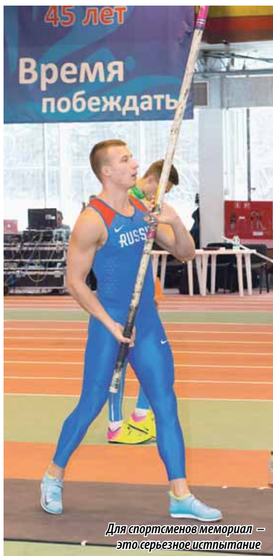
Для спортсменов мемориал – это серьезное испытание