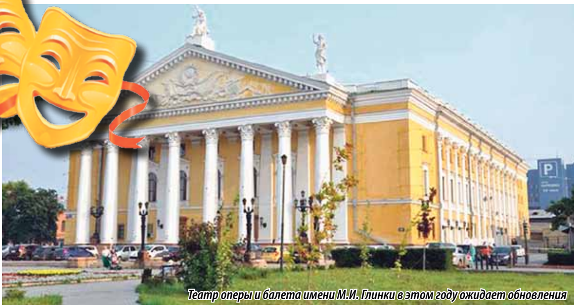
Театр оперы и балета имени М.И. Глинки в этом году ожидает обновления

самым доказывая высокий уровень профессионализма.