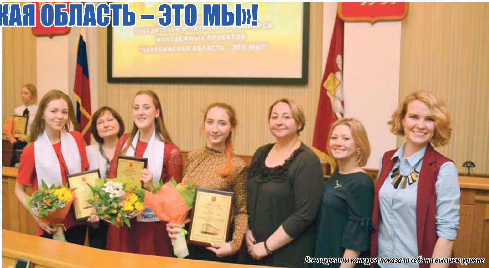
Все лауреаты конкурса показали себя на высшем уровне

Проект «Законодательное Собрание в словах и лицах», посвященный юбилею южноуральского парламента, представили на конкурс студентки