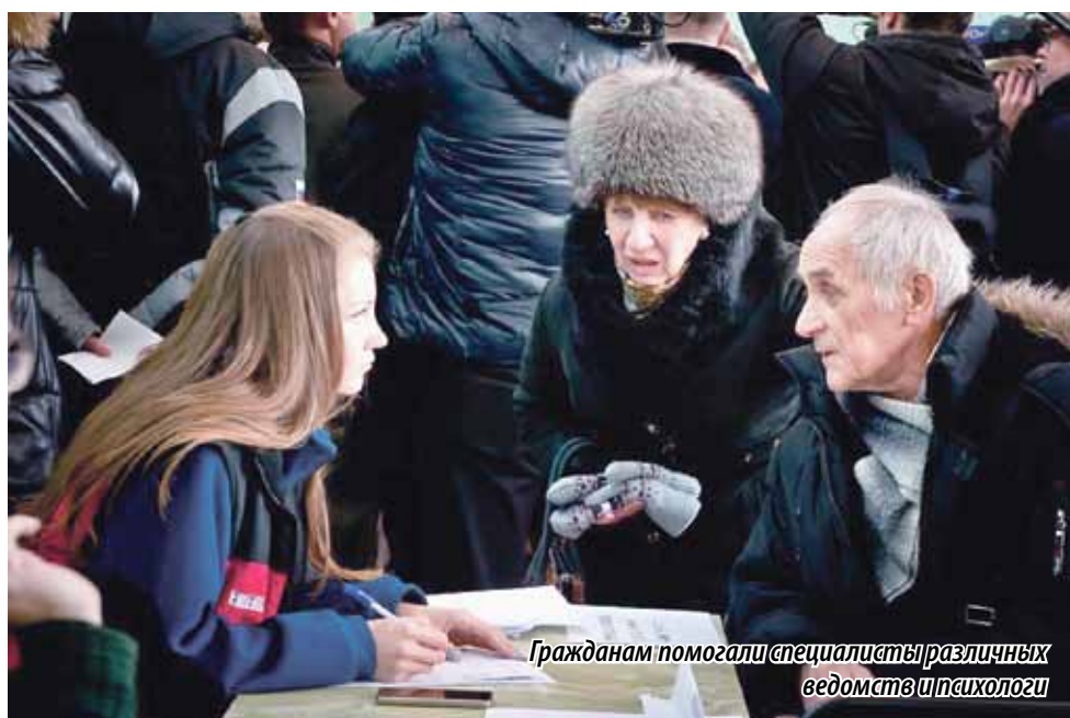
Гражданам помогли специалисты различных ведомств и психологи

УТРОМ 31 ДЕКАБРЯ В МАГНИТОГОРСКЕ, ПРЕДПОЛОЖИТЕЛЬНО ИЗ-ЗА ВЗРЫВА БЫТОВОГО ГАЗА, ОБРУШИЛСЯ ПОДЪЕЗД МНОГОЭТАЖНОГО ДОМА ПО ПРОСПЕКТУ КАРЛА МАРКСА, 164. ПОГИБЛИ ЛЮДИ. ТО, ЧТО ЭТО ПРОИЗОШЛО В САМЫЙ КАНУН НОВОГО ГОДА, СТАЛО ДОПОЛНИТЕЛЬНЫМ МОРАЛЬНЫМ ИСПЫТАНИЕМ, СЛОВНО ПРОВЕРЯВШИМ ЮЖНОУРАЛЬЦЕВ НА НЕРАВНОДУШИЕ, СПЛОЧЕННОСТЬ, ГОТОВНОСТЬ ПРИЙТИ НА ВЫРУЧКУ, РАЗДЕЛИТЬ БЕДУ.