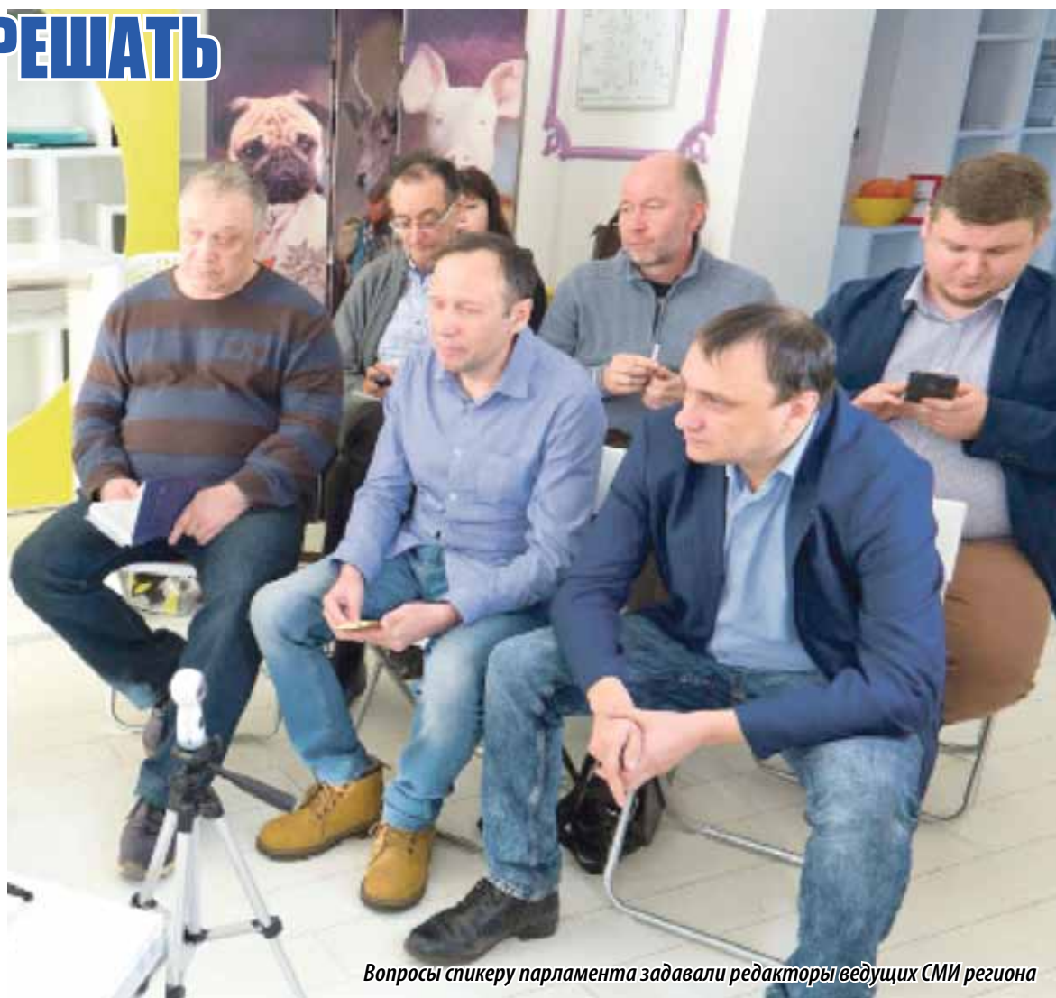
Вопросы спикеру парламента задавали редакторы ведущих СМИ региона

– Мы сегодня подводим итоги законодательной деятельности. За этот период мы приняли более 200 законов для области и более 500 постановлений ЗСО. Конечно, есть проекты законов, которые сегодня отражают необходимость принятия их в зависимости от ситуации. У нас принцип один: – принятие закона не должно навредить региону, его населению. Бывает, принимаем непопулярные законы. Например, закон об изменении пенсионного возраста. Мы дали льготы для людей предпенсионного возраста.