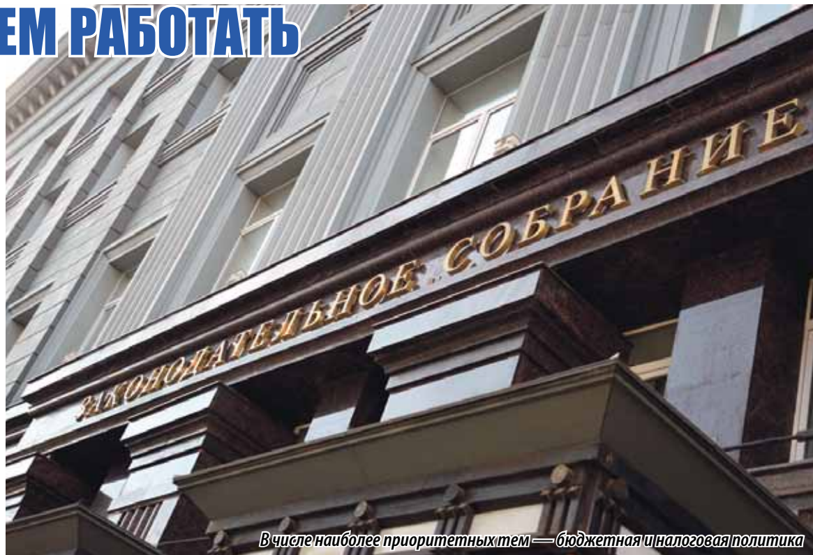
В числе наиболее приоритетных тем — бюджетная и налоговая политика

Как и прежде, в числе наиболее приоритетных тем – бюджетная и