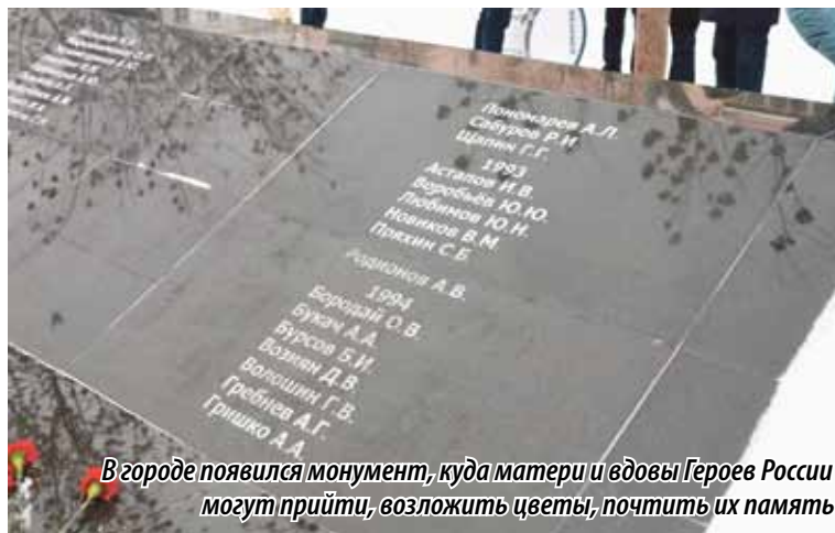
В городе появился монумент, куда матери и вдовы Героев России могут прийти, возложить цветы, почтить их память