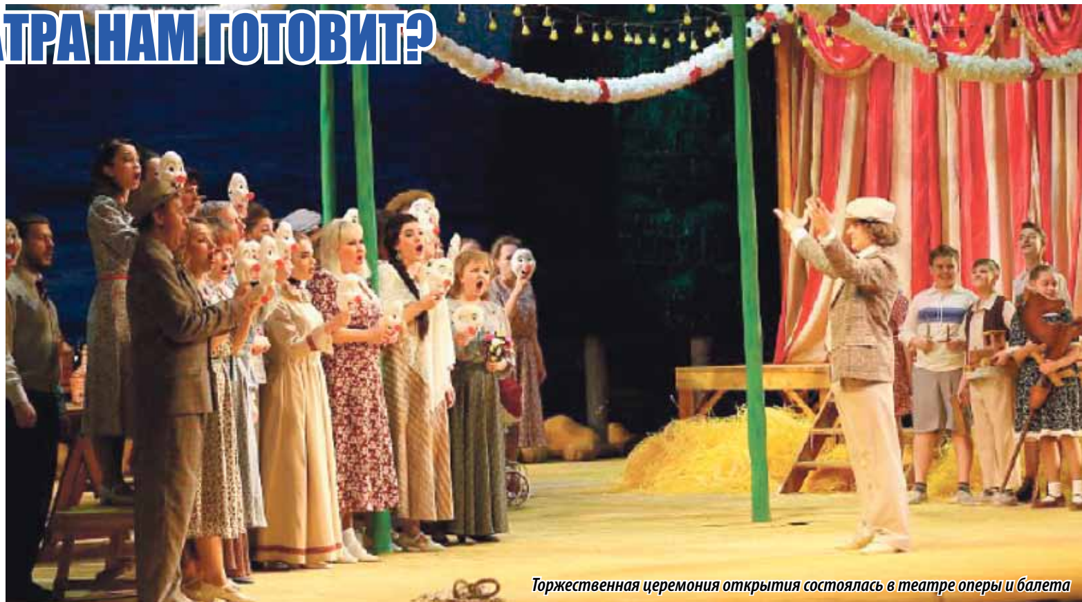
Торжественная церемония открытия состоялась в театре оперы и балета

В рамках фестиваля учреждено несколько номинаций. И стоит отметить, что Челябинский камерный театр ежегодно становится лауреатом конкурса в разных номинациях, тем