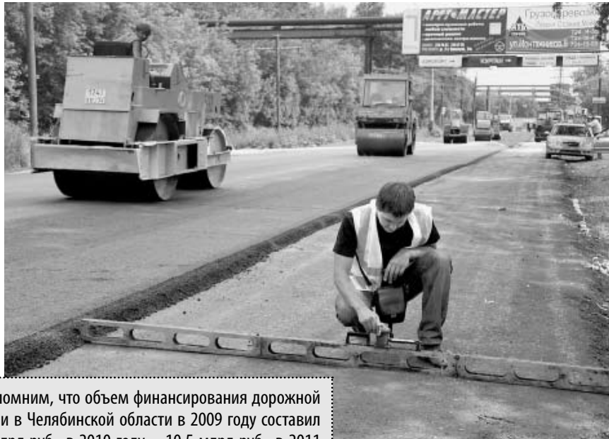
Напомним, что объем финансирования дорожной отрасли в Челябинской области в 2009 году составил 2,62 млрд руб., в 2010 году – 10,5 млрд руб., в 2011 году – 10,6 млрд рублей.

Пока предусмотренный законодательством базовый объем бюджетных ассигнований дорожного фонда области в три раза ниже финансового объема средств, выделенных на дорожную отрасль в 2011 году. Но перед рабочей группой поставлена задача по поиску дополнительных источников наполнения дорожного фонда,