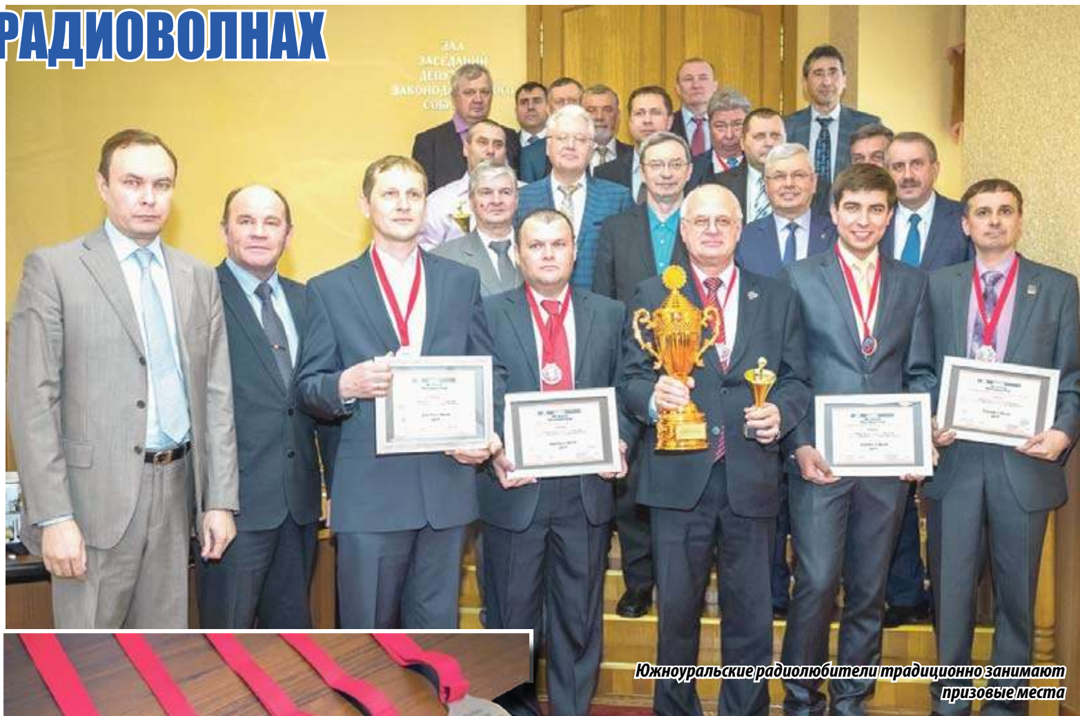
Южноуральские радиолюбители традиционно занимают призовые места

– Наши встречи давно стали доброй традицией, – обратился к радиолюбителям руководитель депутатского кор-