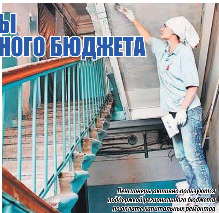
Пенсионеры активно пользуются поддержкой регионального бюджета по оплате капитальных ремонтов

На этот год объем запланированных бюджетных средств для предоставле-