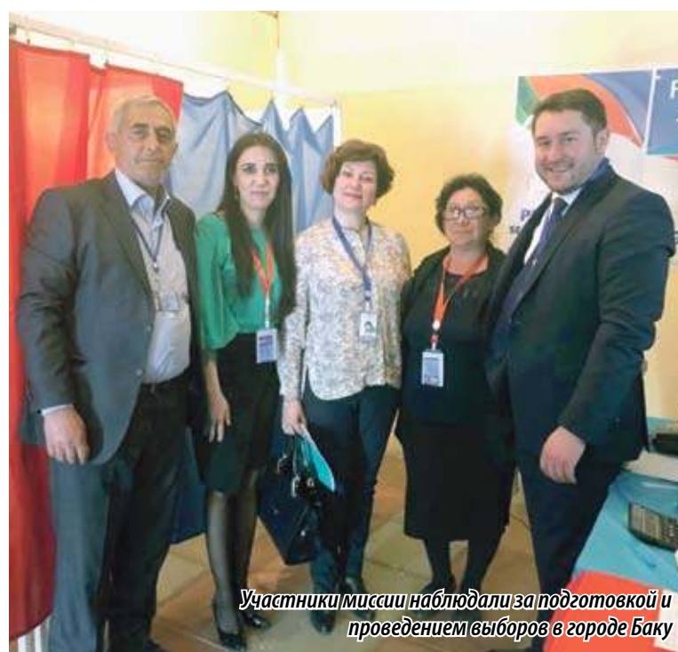
Участники миссии наблюдали за подготовкой и проведением выборов в городе Баку

По данным ЦИК, явка составила 74,30 процента. 86,03 процента жителей страны отдали свои голоса действующему президенту Азербайджана Ильхаму Алиеву. По словам международных наблюдателей и сотрудников местного ЦИКа, серьезных нарушений в ходе проведения избирательной кампании не было.