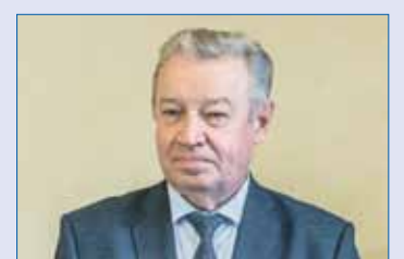
Анатолий БРАГИН, председатель комитета по законодательству, государственному строительству и местному самоуправлению:

/// Полномочиями по составлению протоколов о совершении административных правонарушений наделяются органы местного самоуправления. Рассматривать дела будут административные комиссии. ///