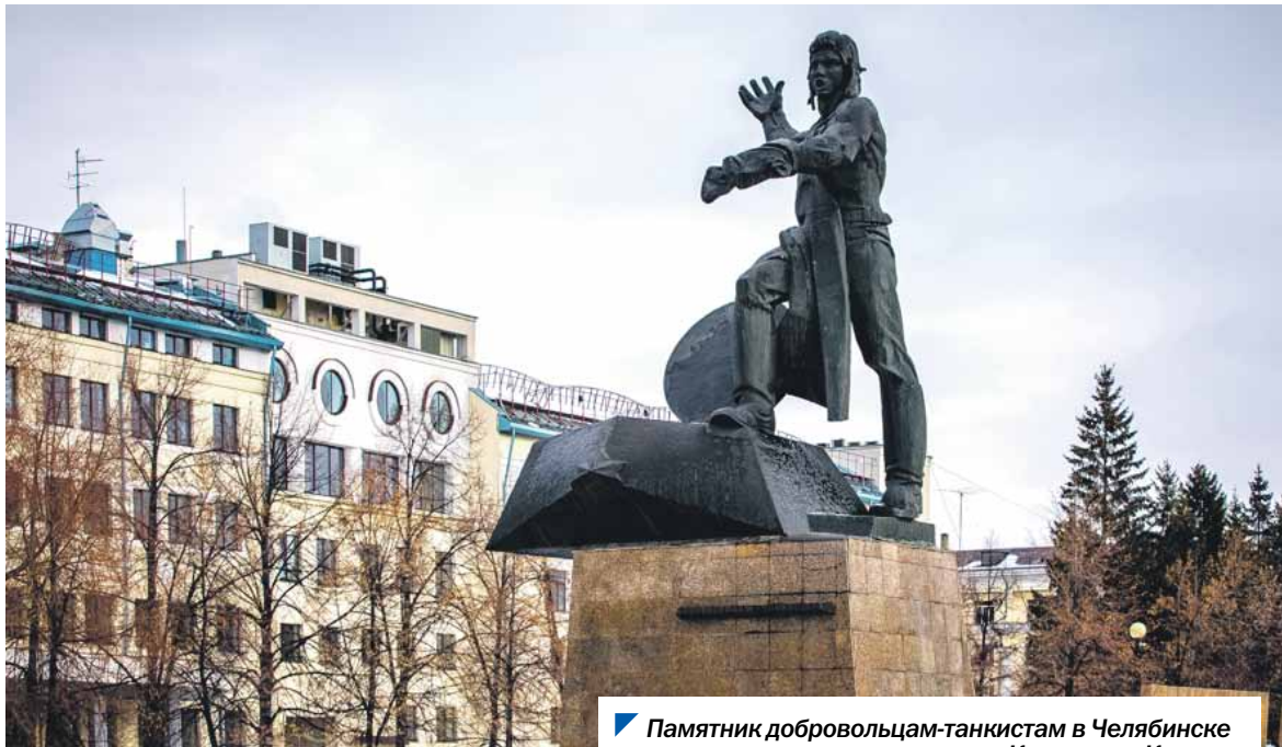
Памятник добровольцам-танкистам в Челябинске установлен на пересечении улиц Коммуны и Кирова.

На Южном Урале появилась новая памятная дата — День народного подвига по формированию Уральского добровольческого танкового корпуса в годы Великой Отечественной войны. Она будет отмечаться каждый год 11 марта.