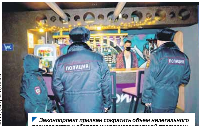
Законопроект призван сократить объем нелегального производства и оборота никотинсодержащей продукции.