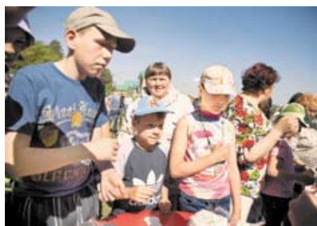
Ребята из Тюбука мечтали покатаются на аттракционах. Для них в этот день – карусели, качели и поездка на паровозике.