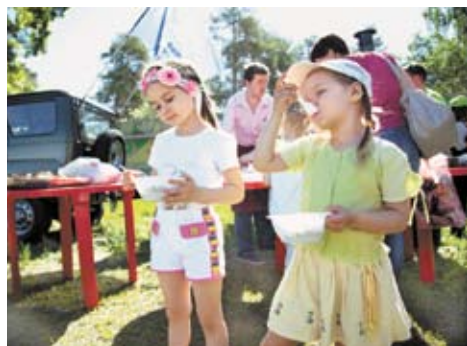
После долгой дороги – вкуснейшая гречневая каша. Для воспитанников детских домов и всех гостей праздника депутат организовал полевою кухню.