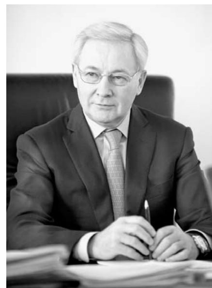
Юрий КАРЛИКАНОВ, первый заместитель председателя Законодательного Собрания Челябинской области, председатель комитета по строительной политике (фракция «Единая Россия»):

— Если сегодня мы не создадим систему капитальных ремонтов жилого фонда, то через 10 лет 45 процентов жилья перейдет в разряд аварийного. Данный закон дает возможность правительству Челябинской области разработать систему мер для того, чтобы не допустить этого. Согласно Жилищному кодексу Российской Федерации обязанность по содержанию общего имущества многоквартирных домов возлагается на собственников жилых помещений. Все граждане должны понимать, что с приобретением права собственности они приобретают и обязанности по содержанию имущества. Изменения, внесенные в Жилищный кодекс в декабре прошлого года, предоставляют всем собственникам возможность самостоятельно формировать фонд капитального ремонта своего многоквартирного дома и решать, на какие виды ремонта в каком объеме направить его средства, в какие сроки проводить работы. Каков будет размер минимального взноса на капитальный ремонт в расчете на один квадратный метр, определит правительство Челябинской области. Собственники жилых помещений на общем собрании будут вправе увеличить размер этого взноса.