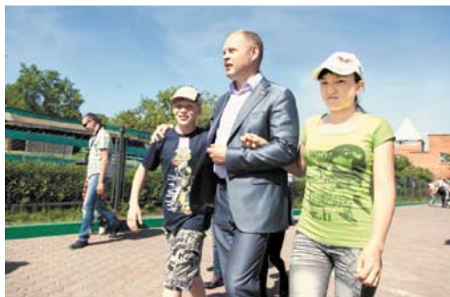
Депутат лично провел экскурсию по зоопарку. Оказалось, что ребята очень хорошо знают животных и птиц.