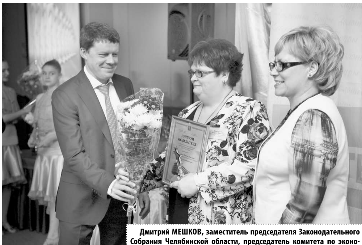
Дмитрий МЕШКОВ, заместитель председателя Законодательного Собрания Челябинской области, председатель комитета по экономической политике и предпринимательству (фракция «Единая Россия»):

Праздник получился ярким и зажигательным. Вместе с выступающими