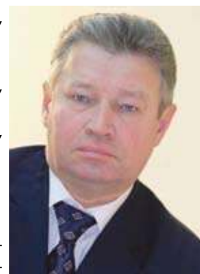
Анатолий БРАГИН , заместитель председателя Законодательного Собрания Челябинской области, председатель комитета по законодательству, государственному строительству и местному самоуправлению (фракция «Единая Россия»):

« Партия «Единая Россия» сейчас пытается ответить на те вопросы, которые сформировались в обществе. Именно для этого организована большая дискуссия с населением. Считаю, что подобный формат работы не должен носить разовый характер, его необходимо сделать постоянным. Те вопросы, которые обсуждались в рамках региональных дискуссий, — это лишь малая толика проблем, которые необходимо решить для повышения качества жизни российского населения. Начало работы оцениваю позитивно, а результативность будет зависеть от грамотного построения взаимодействия между муниципальным, региональным и федеральным уровнями власти. »