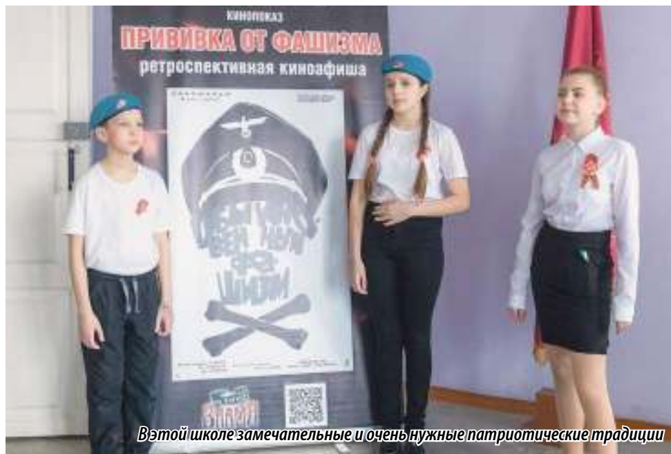
В этой школе замечательные и очень нужные патриотические традиции

«Уже на протяжении 16 лет лучшие ученики старших классов школы № 28 получают премию имени Героя России Сергея Молодова. И эта награда — важный элемент военно-патриотического воспитания. В этой школе вообще уделяется большое внимание воспитанию в детях патриотизма, уважения к истории нашей страны и старшему поколению, любви к Родине. Всегда с большим удовольствием участвую в школьных мероприятиях и каждый раз, общаясь с ребятами этой школы, вижу их неравнодушие к родному краю, к стране. Важно это качество не просто сохранить, но и приумножить.»