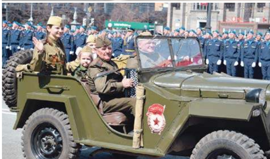
Все поколения южноуральцев объединяет гордость за героическую историю России и вера в ее великое будущее

ВЕСНА В ЭТОМ ГОДУ ЮЖНОУРАЛЬЦЕВ НЕ БАЛУЕТ ТЕПЛОМ И ЯРКИМ СОЛНЦЕМ. НО КО ДНЮ ПОБЕДЫ ПОГОДА ПРЕПОДНЕСЛА НАМ ХОРОШИЙ ПОДАРОК – 9 МАЯ ЧЕЛЯБИНСК ВСТРЕТИЛ ПОД ЯРКИМ СОЛНЦЕМ, А ОБЕЩАННЫЙ СИНОПТИКАМИ ДОЖДЬ ЗАГЛЯНУЛ В ГОРОД ЛИШЬ ВО ВТОРОЙ ПОЛОВИНЕ ДНЯ. ПРАВДА, ОН НИСКОЛЬКО НЕ ИСПОРТИЛ ПРАЗДНИК.