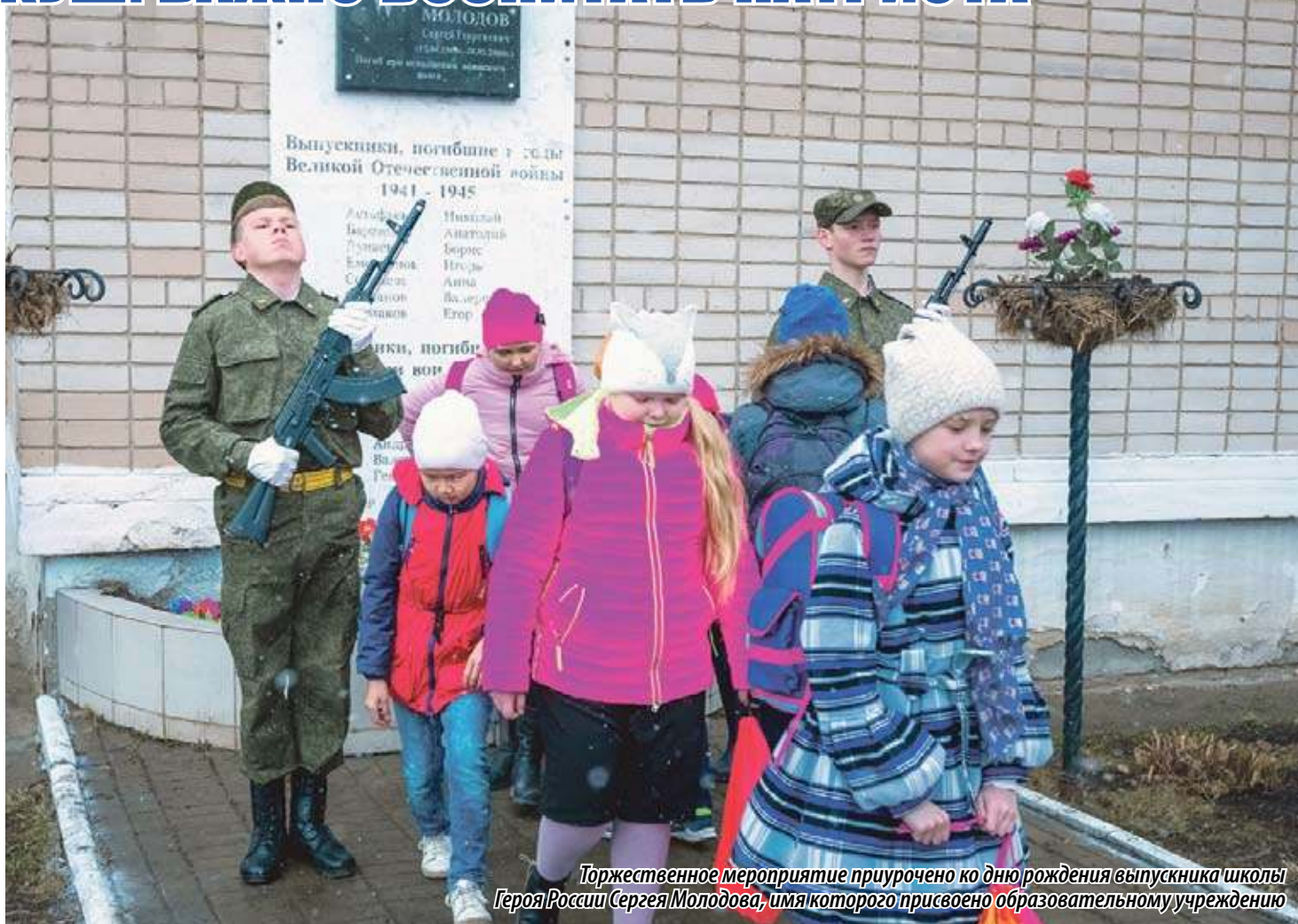
Торжественное мероприятие приурочено ко дню рождения выпускника школы Героя России Сергея Молодова, имя которого присвоено образовательному учреждению

Что касается награжденных в этот день школьников, то каждый из них отметил: подобные высокие награды ко многому обязывают. Это стимул