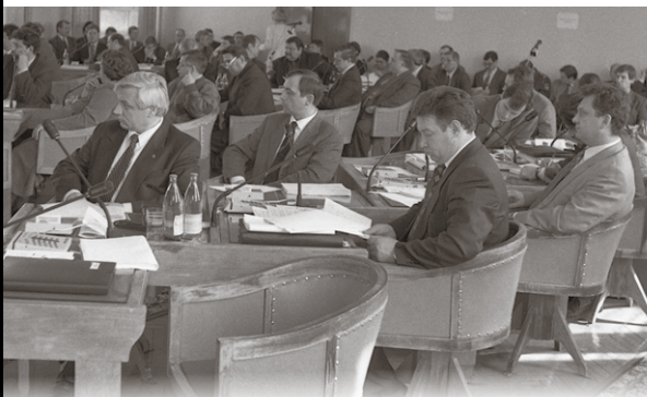
Идет заседание Законодательного Собрания. Апрель 1997 г.