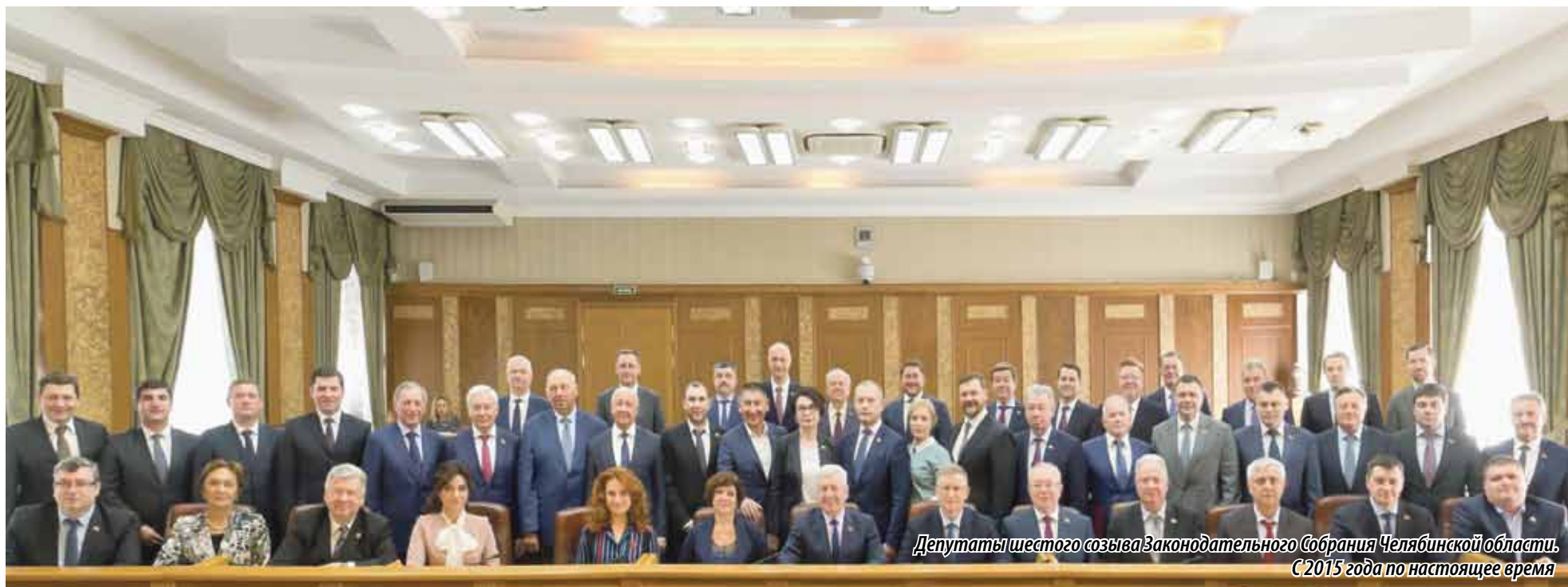
Депутаты шестого созыва Законодательного Собрания Челябинской области. С 2015 года по настоящее время