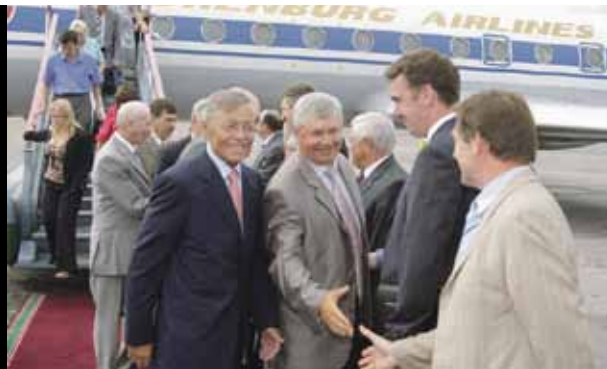
Губернатор Петр Сумин и председатель Законодательного Собрания Владимир Мякуш во время официального визита в Уфу. 11 июля 2007 г.