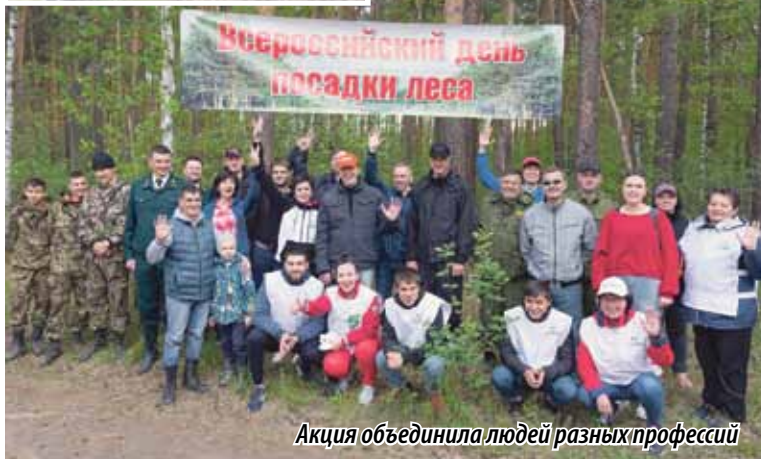
Акция объединила людей разных профессий