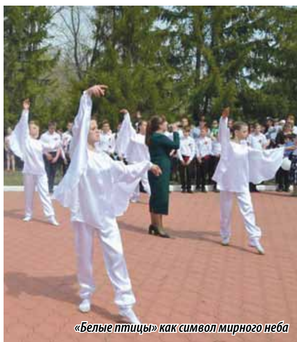
«Белые птицы» как символ мирного неба

телей Тракторозаводского района Челябинска. Праздники проводились в школах № 39, 19, 59, 81, 84, 86, 101, 112, 116, 120, 155, ДДК «Ровесник» и во Всероссийском обществе слепых. Гости тепло встречали молодых артистов и аплодировали выступлениям. А по окончании концерта для ветеранов организовывали чаепитие с пирогами, фруктами и сладостями (к слову, специально для этого в гранд-отеле «Видгоф» было испечено более 400 различных угощений).