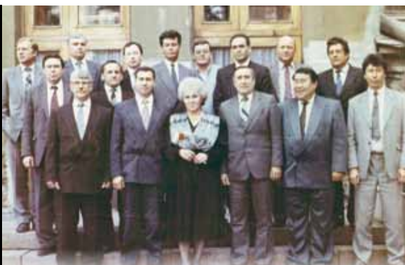
Депутаты I созыва после заседания областной думы с главой администрации Челябинской области В.П. Соловьевым. 1994 г.

Оглядываясь на более чем 20-летний опыт работы в Законодательном Собрании, могу сказать, что вывел для себя непреложное правило: если стал депутатом, будь добр – трудись для людей...»