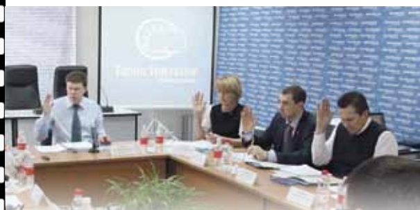
Выездное заседание комитета по экономической политике и предпринимательству в инновационном бизнес-инкубаторе. 17 февраля 2011 г.