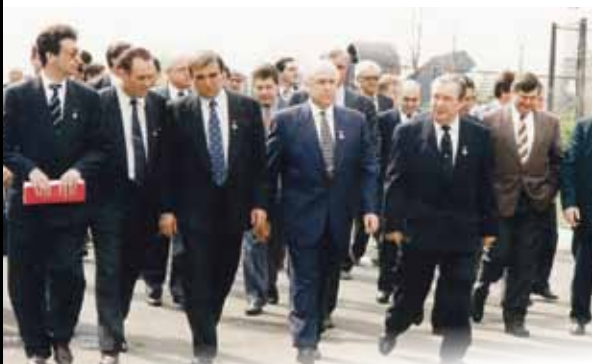
Визит председателя правительства РФ В.С. Черномырдина в Челябинскую область. Председатель Челябинской областной думы В.Н. Скворцов (второй слева), А.И. Стариков (третий слева). Апрель 1995 г.