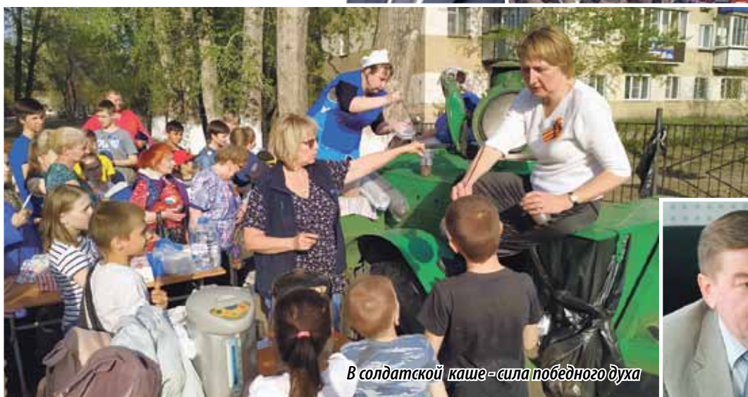
В солдатской каше – сила победного духа