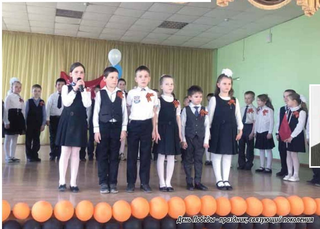
День Победы – праздник, связующий поколения