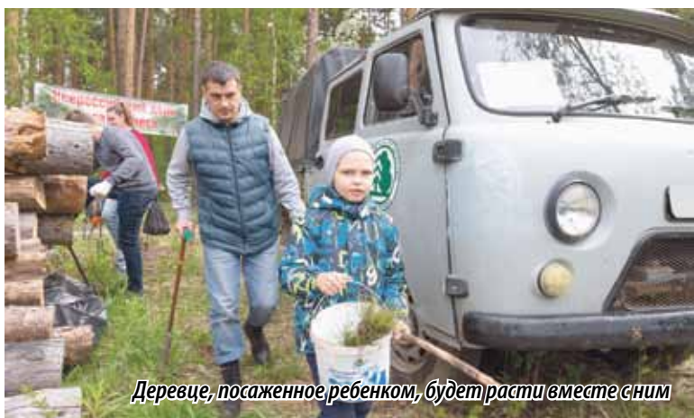
Дерево, посаженное ребенком, будет расти вместе с ним

«Мы проводим лесовосстановительные мероприятия одновременно с лесопожарным сезоном. В настоящее время уже прошел первый весенний пик и можем говорить смело: мы отстояли леса Челябинской области от этого ежегодного бедствия, тем не менее, 4,2 тысячи гектара площади, покрытой лесом, и 7 тысяч гектаров общей площади лесного фонда, к сожалению, пройдено лесными пожарами. Однако это намного меньше, чем в прошлом году, практически в два раза. Лесовосстановительные мероприятия проводятся в срок и в полном объеме.»