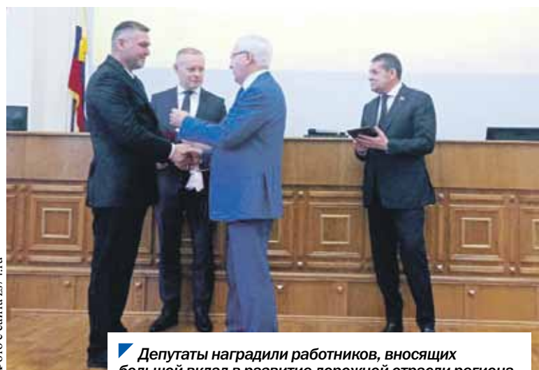
Депутаты наградили работников, вносящих большой вклад в развитие дорожной отрасли региона.

профессионализм и ответственность, проявляемые в ходе строительства новых и ремонта действующих объек-