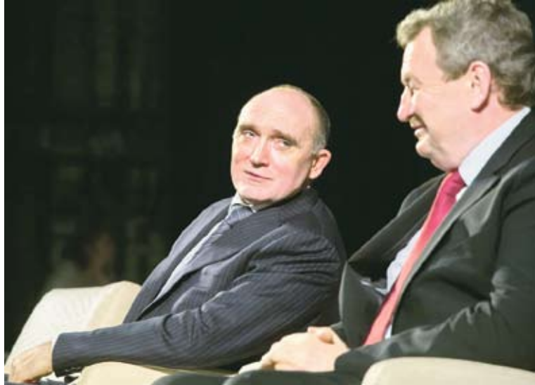
Губернатор Борис Дубровский и Анатолий Литовченко.

В ЧЕЛЯБИНСКОЙ ОБЛАСТИ ОФИЦИАЛЬНО ДАН СТАРТ ИЗБИРАТЕЛЬНОЙ КАМПАНИИ В ДЕПУТАТЫ ГОСУДАРСТВЕННОЙ ДУМЫ ФРАКЦИИ «ЕДИНАЯ РОССИЯ». 2 МАЯ В СТОЛИЦЕ ЮЖНОГО УРАЛА ПРОШЕЛ ФОРУМ ЧЛЕНОВ И СТОРОННИКОВ ПАРТИИ ВЛАСТИ. В НЕМ ПРИНЯЛИ УЧАСТИЕ ПОРЯДКА ТРЕХ ТЫСЯЧ ЧЕЛОВЕК. ПРИ ЭТОМ ПОЧТИ 700 ЧЕЛОВЕК ПРИСУТСТВОВАЛО НА САМОМ ФОРУМЕ, И ДВЕ ТЫСЯЧИ ЮЖНОУРАЛЬЦЕВ НАБЛЮДАЛИ ЗА НИМ БЛАГОДАРЯ ОРГАНИЗОВАННОЙ В 42 МУНИЦИПАЛЬНЫХ ОБРАЗОВАНИЯХ СЕЛЕКТОРНОЙ СВЯЗИ. МОДЕРАТОРОМ ФОРУМА БЫЛ ПРЕДСЕДАТЕЛЬ ЗАКОНОДАТЕЛЬНОГО СОБРАНИЯ ЧЕЛЯБИНСКОЙ ОБЛАСТИ, РУКОВОДИТЕЛЬ ФРАКЦИИ «ЕДИНАЯ РОССИЯ» В РЕГИОНАЛЬНОМ ПАРЛАМЕНТЕ ВЛАДИМИР МЯКУШ.