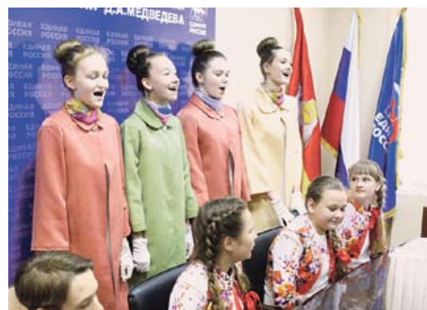
Детский художественный коллектив «Синтай» стал самым большим, пришедшим на прием, и получил поддержку и возможность развиваться дальше.